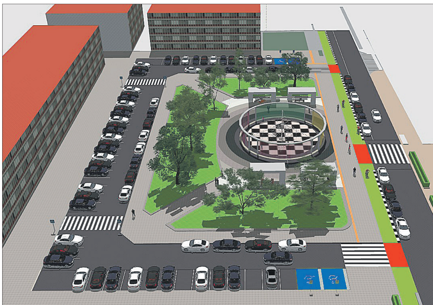
Plaza Blas Domingo Llido.

es van fer per eliminar un xicotet escaló provocava caigudes en la zona d'esbarjo que està entre l'Avinguda Andalusia i el carrer General Prieto, una actuació que durant la reunió amb l'Associació de Veïns van indicar que era necessària perquè provocava caigudes.