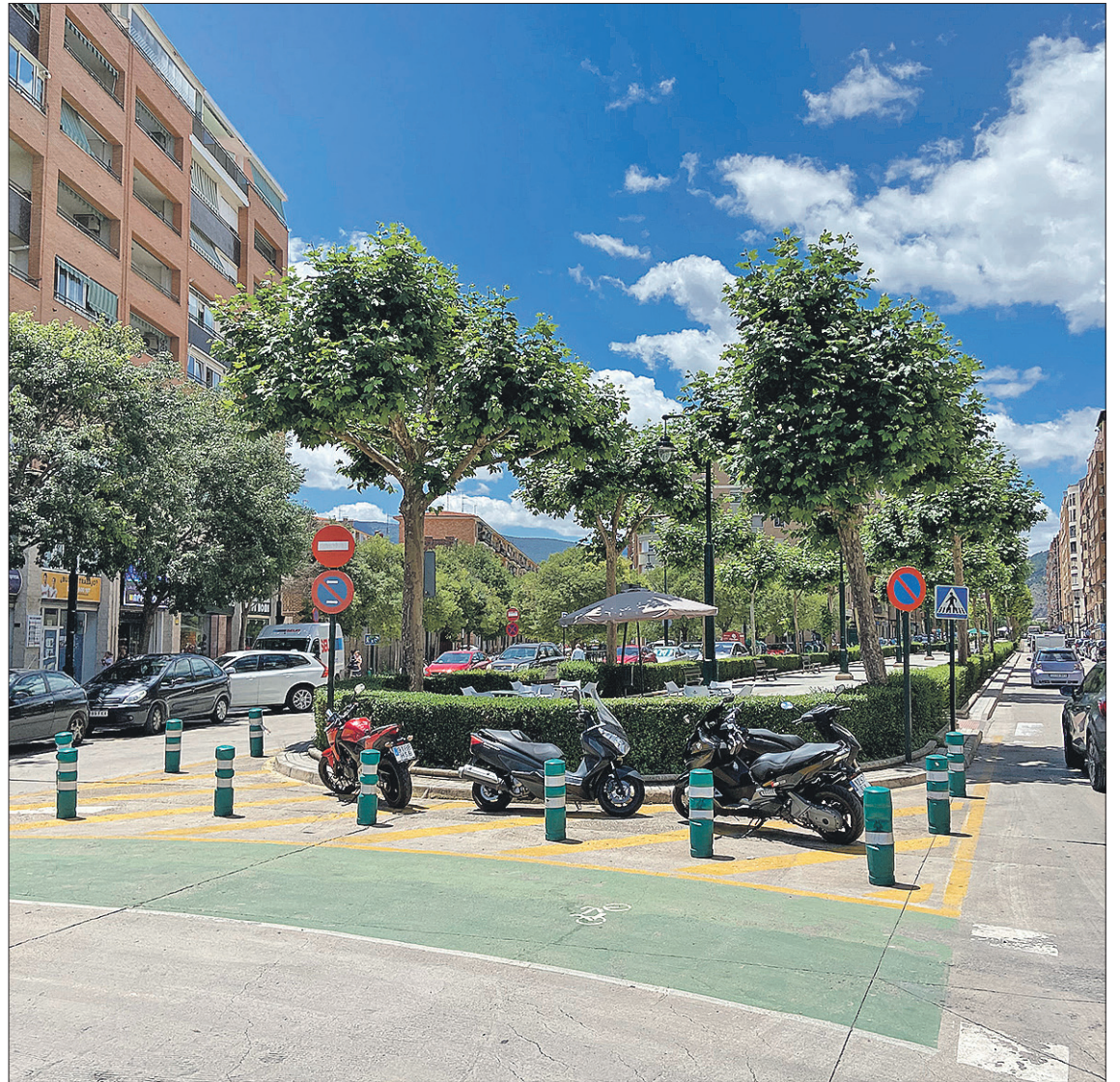
La avenida de la Hispanidad requiere mejoras, según los vecinos.

“Pensamos que Alcoy está falta de un mantenimiento continuado: hay numerosos baches”, afirma el dirigente vecinal. La Fireta de Nadal, de carácter solidario, se celebrará a mediados del mes de diciembre