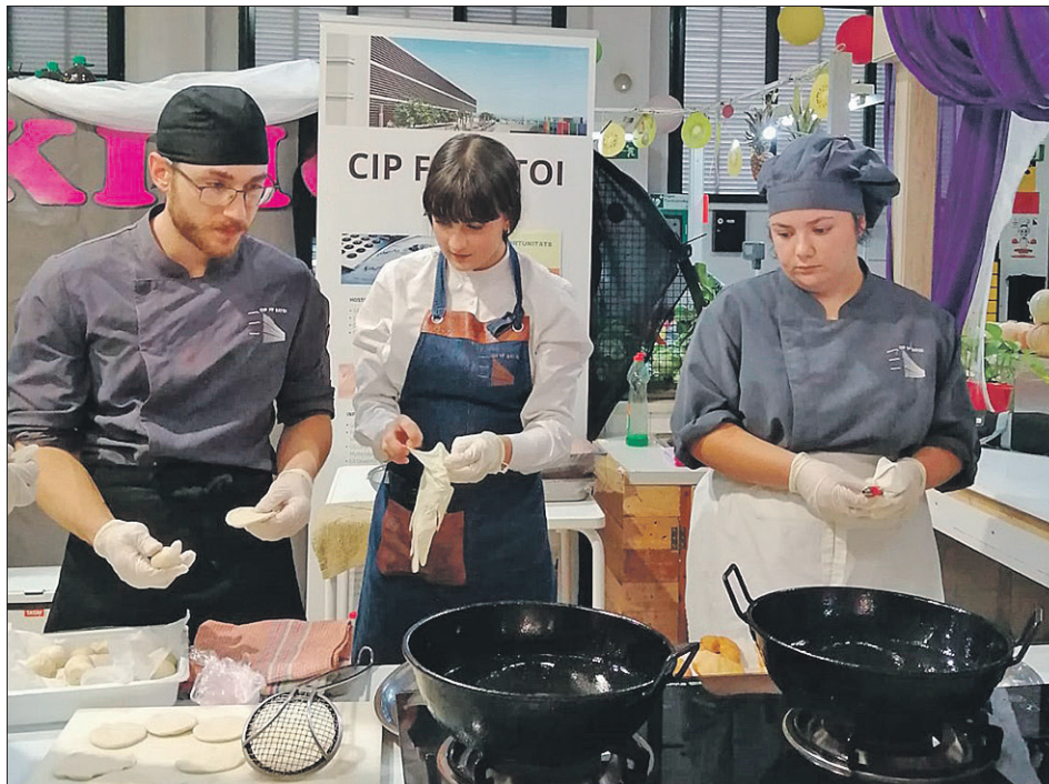
Dos momentos del cooking show.