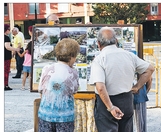
La 'Setmana dels Barris' es la actividad más participativa y tradicional de cuantas se celebran en el barrio.