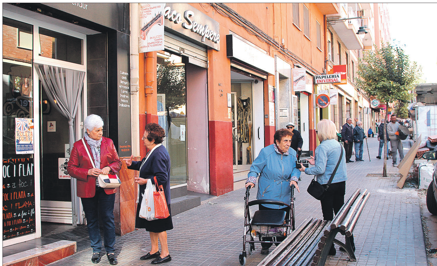
El barrio cuenta con numerosos y muy variados establecimientos comerciales.

Pese a ello, el pequeño comercio es consciente de la evolución de las nuevas tecnologías, motivo por el que “tenemos comercios que están más puestos en este asunto y que están haciendo sus pinitos en la venta online o tienen página web”, siendo un plus para este tipo de establecimientos.