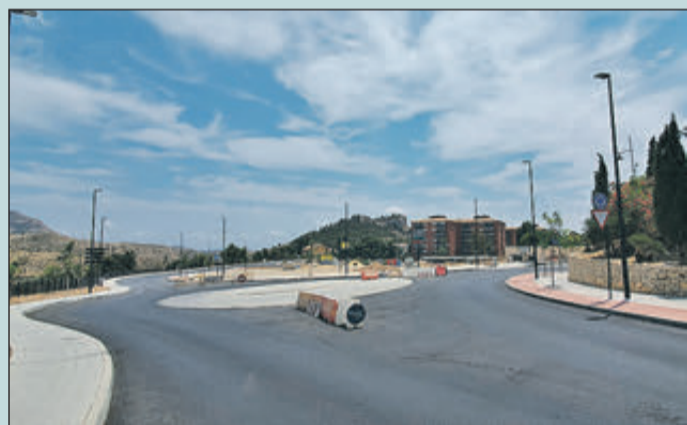
Una de las zonas que se va a señalar, antes de pintarla.

diferents agents de l'àmbit territorial valencià (des d'administracions autonòmiques i locals, agents socials o empreses fins a entitats sense ànim de lucre) per a crear una xarxa col·laborativa amb la qual impulsar un nou model de gestió que permeta adaptar les polítiques actives d'ocupació a les necessitats reals del territori, les persones i les empreses.