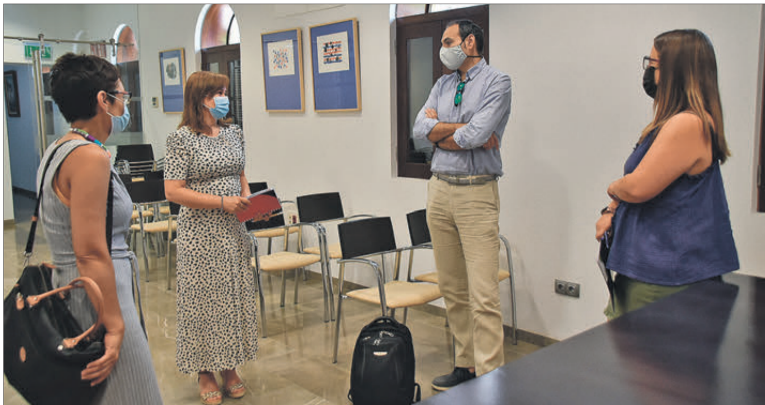
Un instant de la reunió de presentació del projecte d'Agenda Urbana 2030.