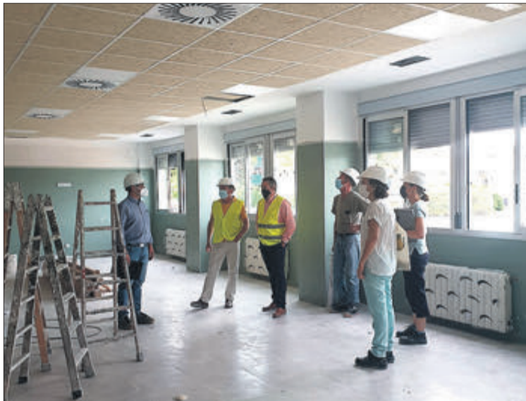
Imatge d'una de les obres que s'estan realitzant.

A més, en el terreny que quedava entre aquest edifici i la resta del cen-