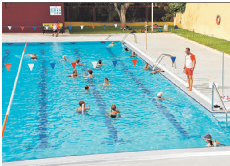
A l'Escola-Campus s'han realitzat nombroses activitats.

L'edil ha explicat que "l'Ajuntament ha fet un gran esforç econòmic per a augmentar el nombre d'activitats i poder disposar de tot el material necessari, així com per a comptar amb més monitors, entre ells un dedicat a atendre els xiquets amb necessitats especials". "Això no suposarà un increment del preu per als pares i mares, ja