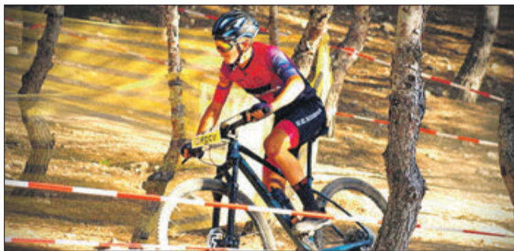
Challenge de carretera.

Enguany la condició física i la sort està a favor del corredor xixonenc, on també va en primera posició en l'Open de la Comunitat Valenciana de BTT a l'haver guanyat totes les curses que s'han celebrat i en tercera posició en el campionat