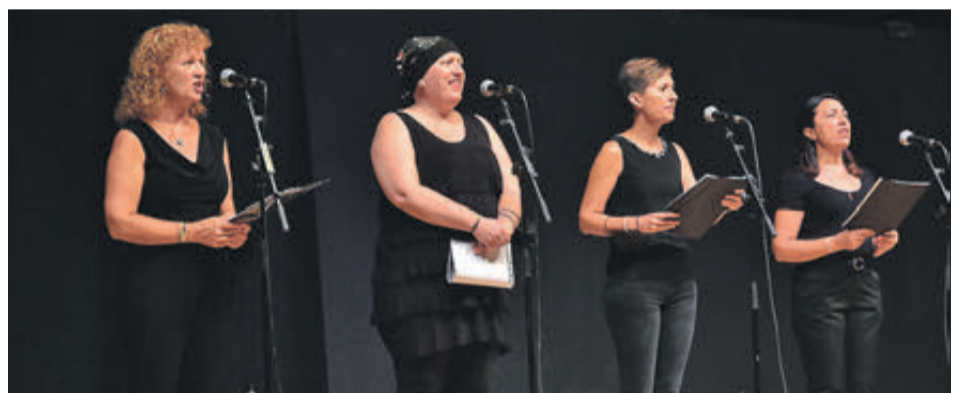
Imatges de les diferents actuacions culturals i d'oci que han tingut lloc durant el mes de juliol a Xixona.

DESTACA EL FESTIVAL INTERNACIONAL DE TROMPETA, QUE HA RECUPERAT EL SEU FORMAT PRESENCIAL