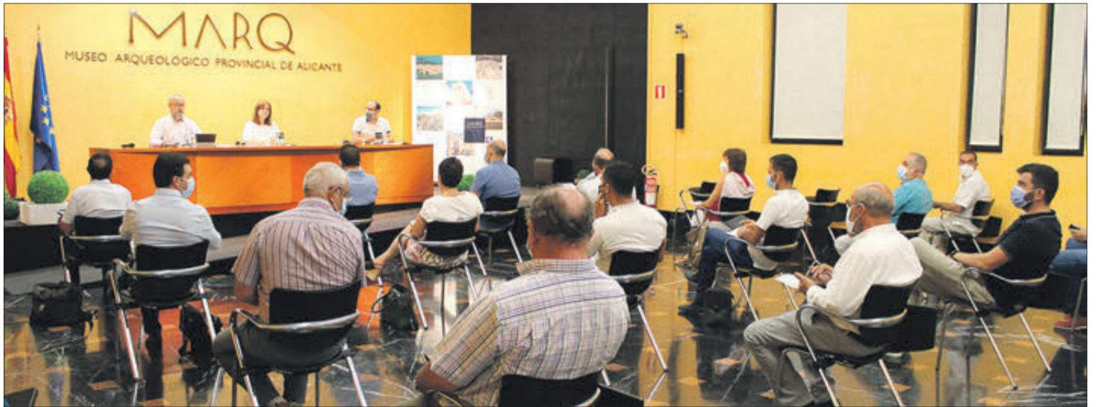
La Junta General i la Comissió de Govern es van celebrar en el Marq d'Alacant.

D'altra banda, es va procedir al nomenament del nou vicepresident segon de l'entitat, el representant de l'Ajuntament