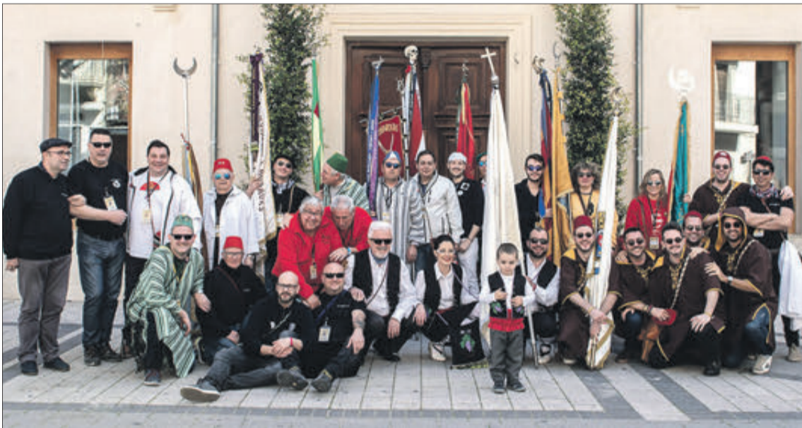
Imatge d'arxiu dels membres de la Federació de Sant Bartomeu i Sant Sebastià.

“Ens veiem obligats a desistir i no celebrar cap dels actes”