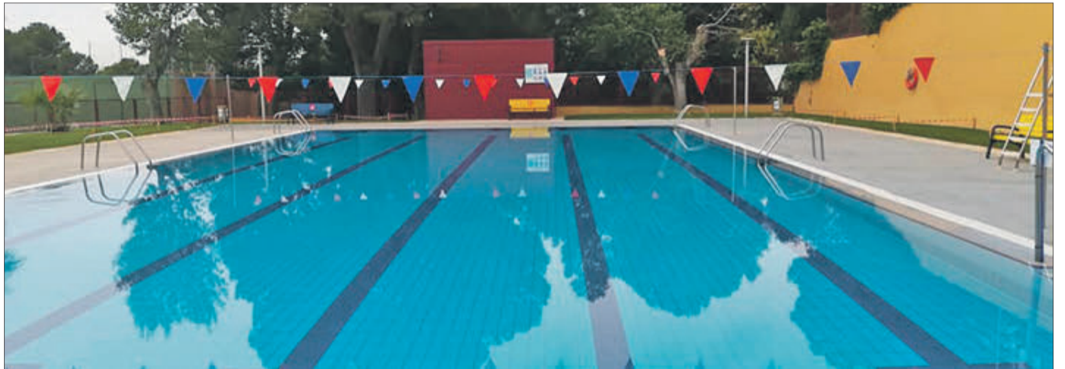
En les piscines s'ha reduït l'aforament al 50%.

El ball i el consum en barra segueix sense estar permès, mentre que d'altra banda, des de la Generalitat Valenciana es continua recomanant l'ús de la màscara a l'aire lliure “especialment en ambients urbans”, a excepció de les platges i espais naturals. El President Ximo Puig ha fet també una crida a mantindre la prudència i la cooperació per a complir amb rigor