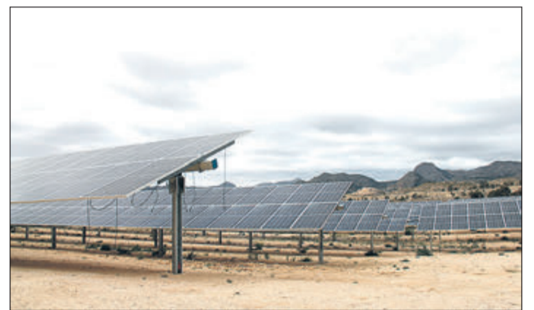
La planta solar 'Turroneros' es va inaugurar a l'abril.

"Estem parlant d'uns llocs de feina molt necessaris, especialment pel que fa a la gent jove que pateix una taxa d'atur de vergonya i que, de no haver-se creat, no justifiquen la quantitat