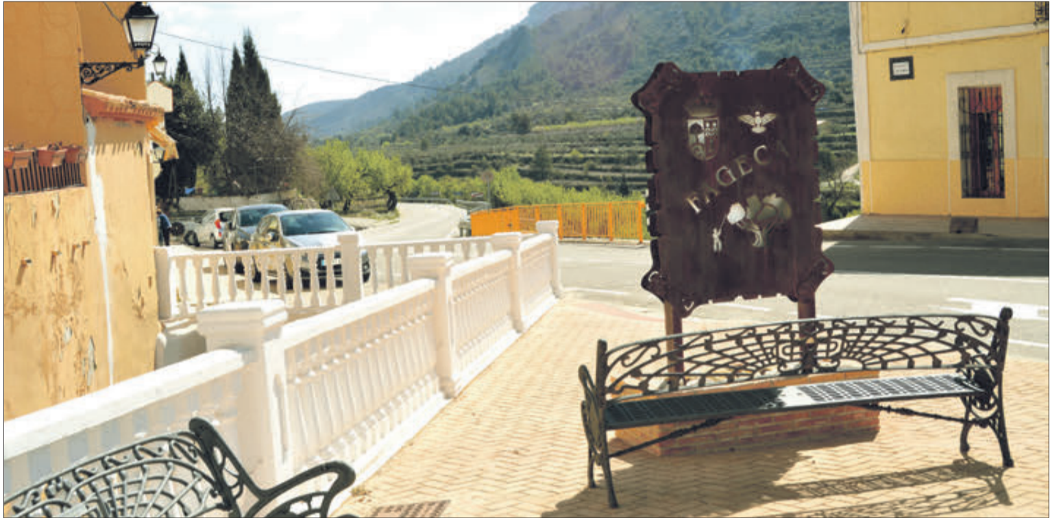
Fageca és un dels municipis que es veurà beneficiat per les ajudes europees.