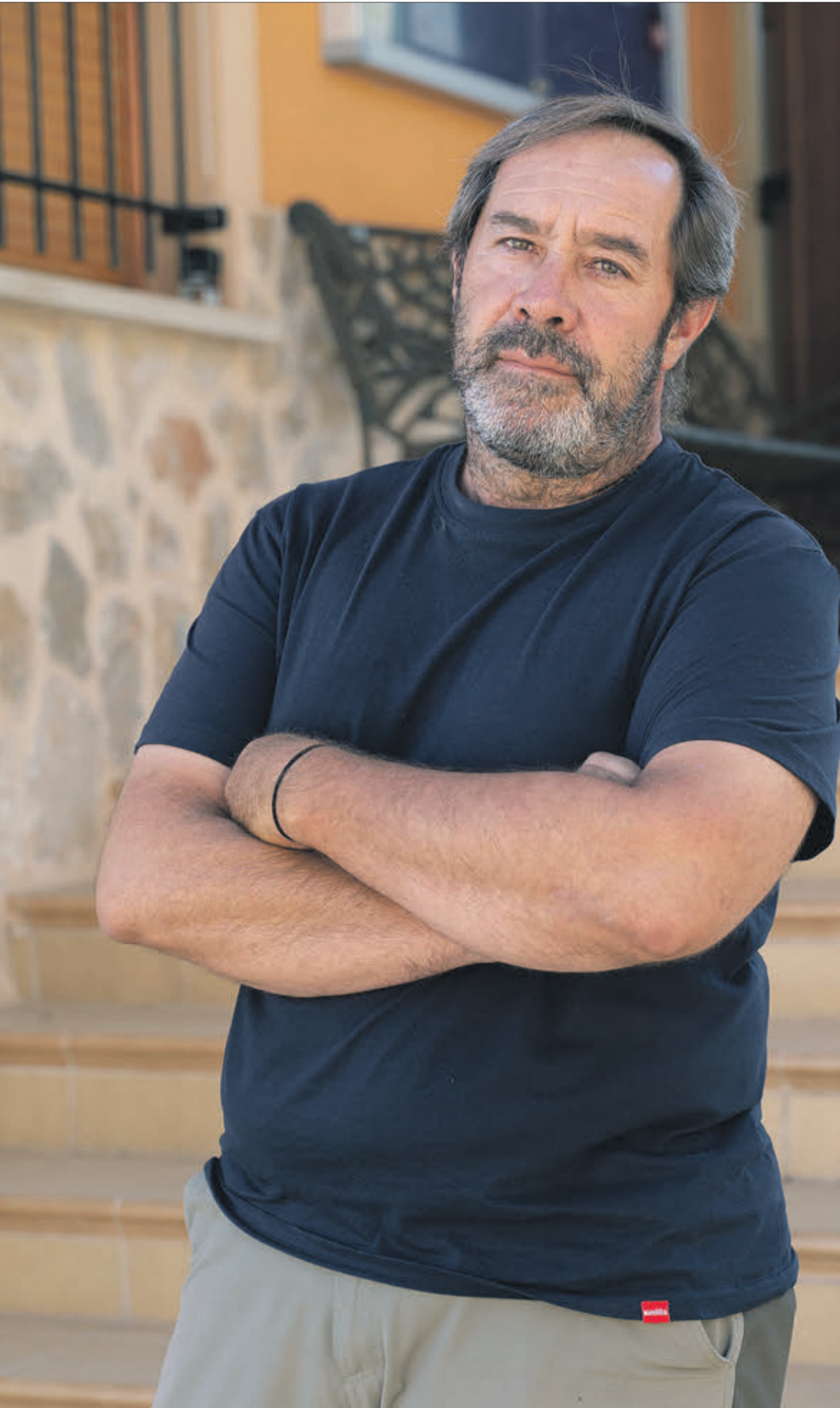
Frau posa a les portes de l'ajuntament de Tollos.