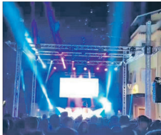
Diferents imatges de la festa que Beniarrés va celebrar en honor de Sant Pere.