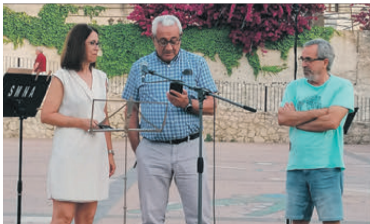
Diferents moments de l'acte celebrat al pati de les antigues escoles.