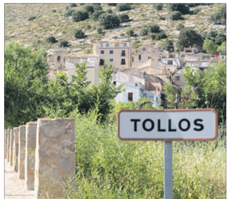
Accés al municipi.

viu a Tollos està jubilada. A part de mi, pocs més treballen en el camp.