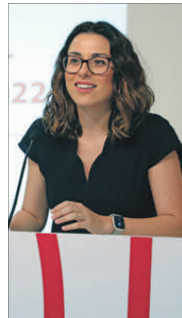
La consellera Aitana Mas.

Per aquest motiu, la Conselleria inclou en el pla de mesures una sèrie de recomanacions nutricionals per a combatre la deshidratació en les persones dependents institucionalitzades o usuàries dels centres de majors.