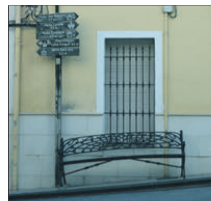
Un banc i panell indicatiu per a fer visites

EL SEU PRINCIPAL ATRACTIU ÉS EL JACIMENT RUPESTRE SANTUARI DE PLA DE PETRACOS