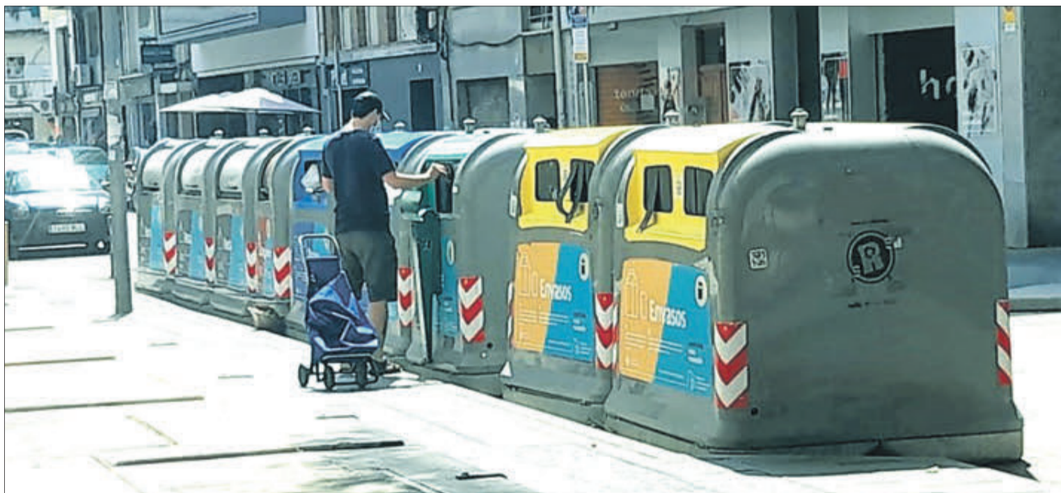
Un home utilitza un contenidor per al reciclatge d'envasos de vidre.