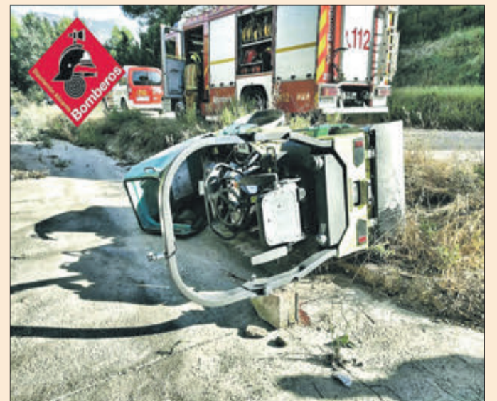
El vehicle que va protagonitzar el mortal accident.

El tràgic accident, en el qual el conductor va morir pràcticament en l'acte, va succeir en la CV-700, en una zona en obres coneguda com a partida La Cabaña. De fet, a l'arribada dels serveis d'emergència estava ja sense vida el cos de l'operari.