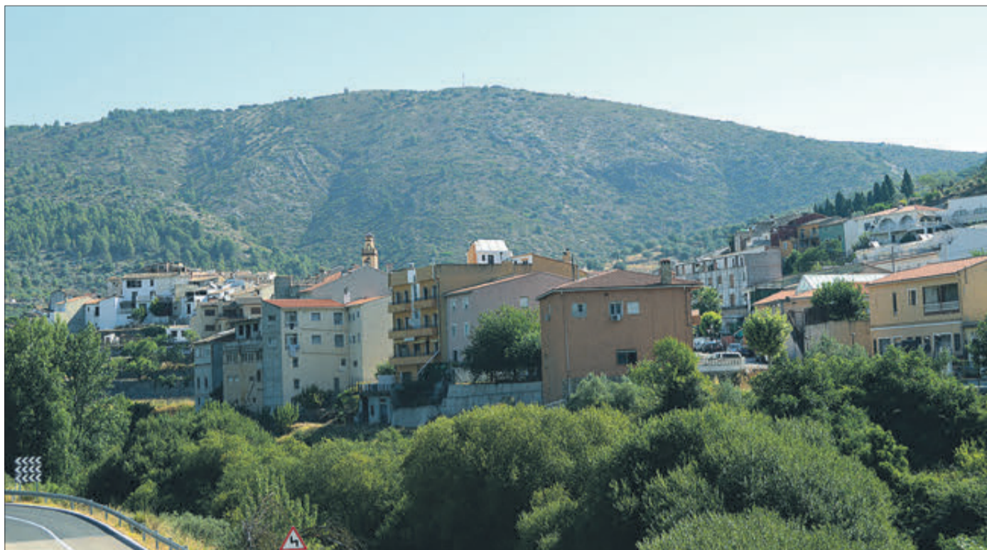
Panoràmica del municipi.