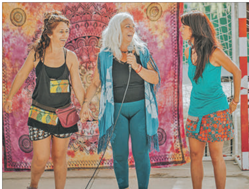
Dues imatges de l'activitat que es va desenvolupar en el poliesportiu de l'Alqueria d'Asnar.