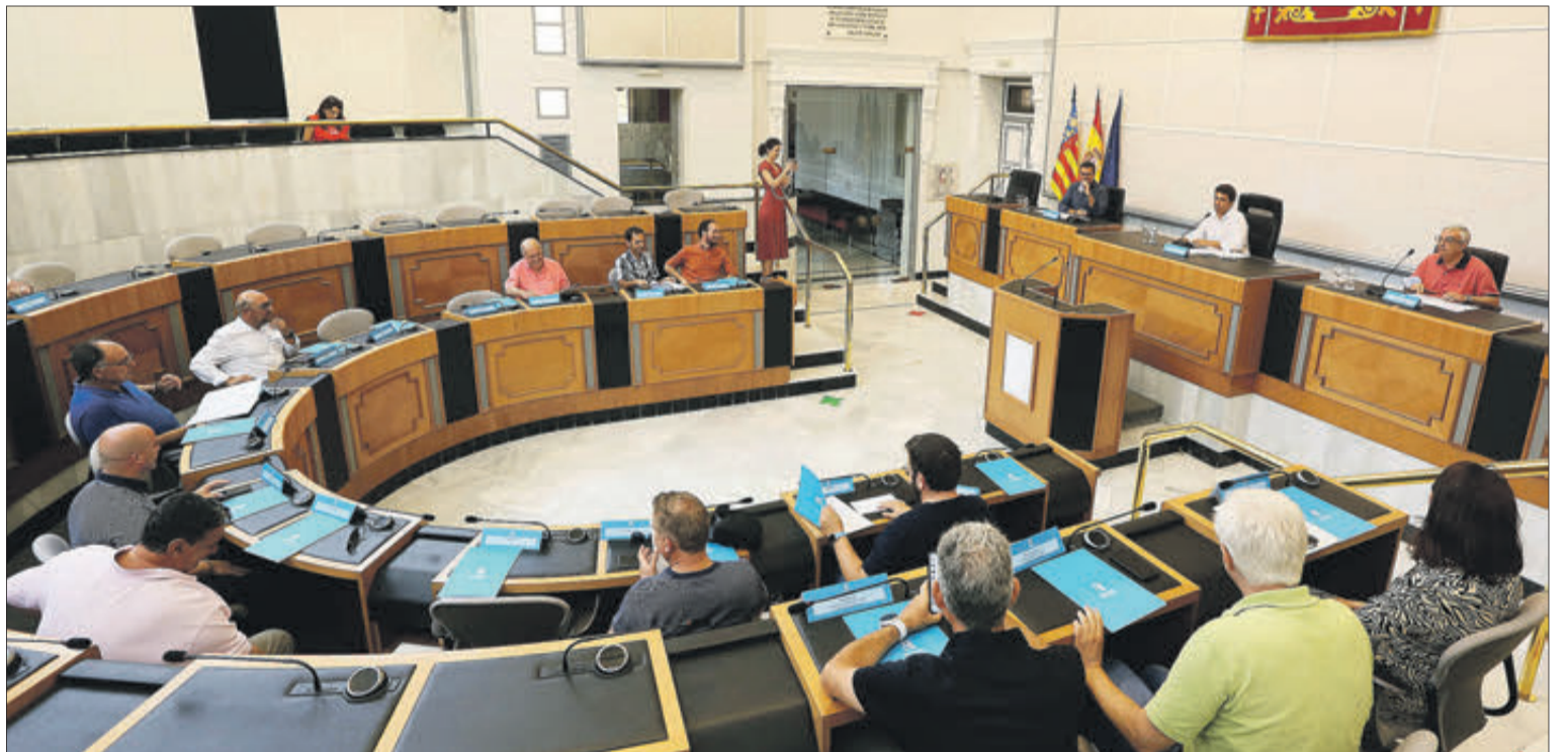
La reunió es va desenvolupar en el saló de plens de Diputació.