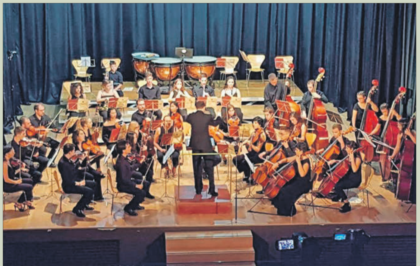
La simfònica de Sant Vicent del Raspeig durant el concert que va oferir.