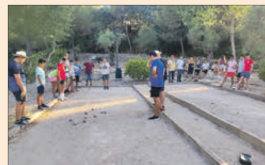
Pista de pàdel i torneig de petanca.