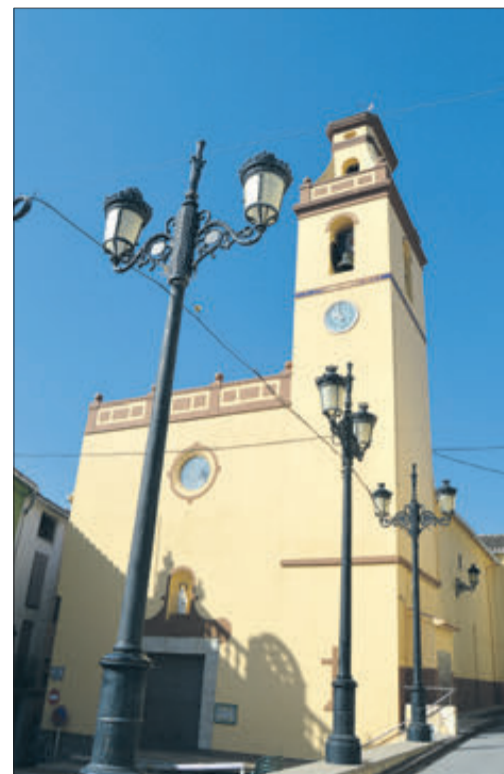
Església Parroquial de Castell de Castells.