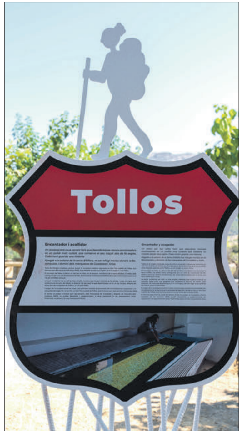
La ruta 99 promou el turisme.