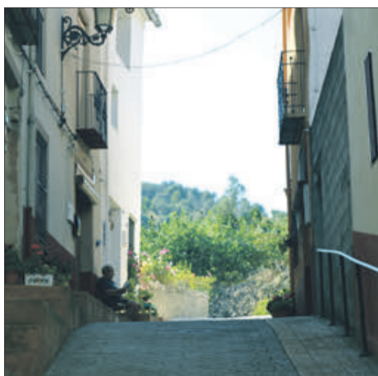
Castell de Castells és un municipi amb poc més de 400 veïns.

Uns anys més tard, en 1290 (o 1320 segons una altra versió), va ser comprat