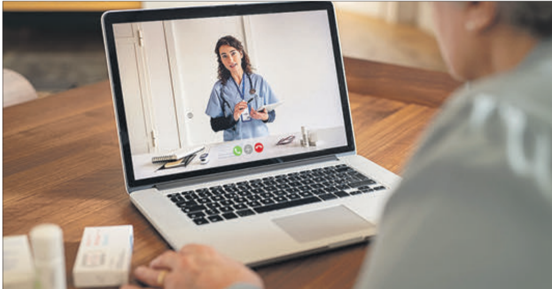
Una dona fa ús de l'ordinador per a contactar amb la seua metgessa.

1. Conceptes avançats. Pàgines webs i dominis. 2. Serveis d'ús habitual: navegació i correu electrònic. 3. Serveis avançats: videoconferència, teleformació. 4. Programes d'intercanvi P2P. Descàrrega directa, àmbit legal, portals i blogs. 5. Conceptes de seguretat. Perills: virus, troians, cucs i phishing. 6. Antivirus i firewalls. Contingut actiu en les pàgines web. Restringir la navegació. 7. Correu electrònic avançat. Llistes