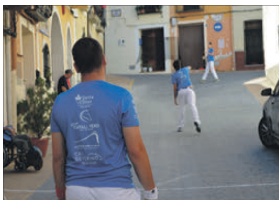
Partida de pilota valenciana.