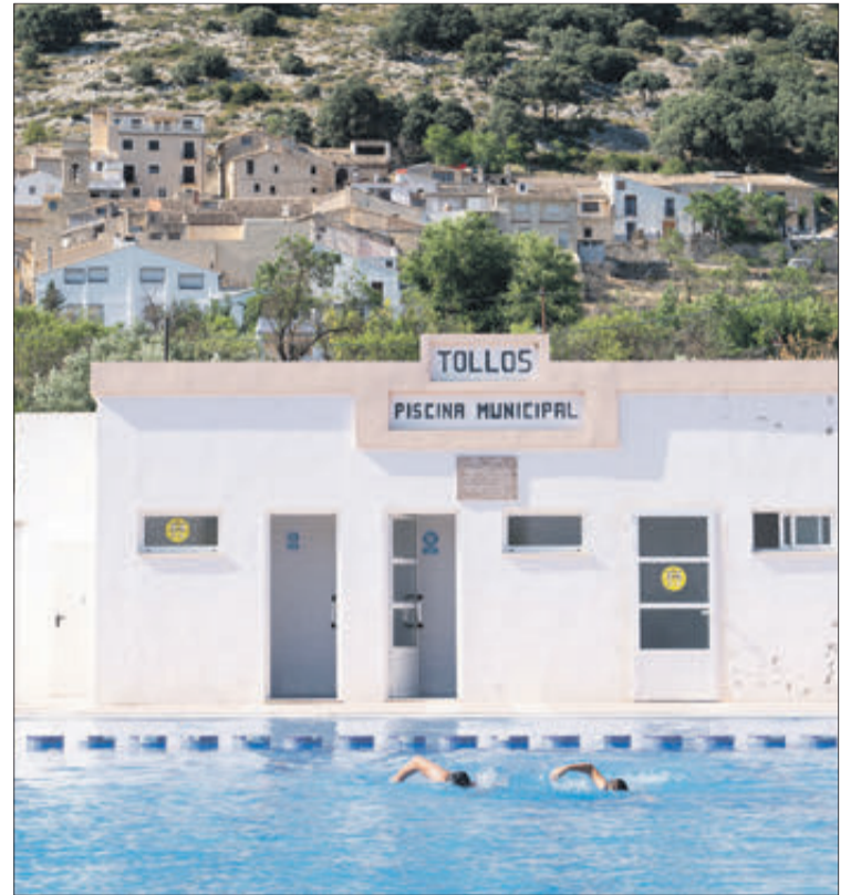
Piscina de Tollos.