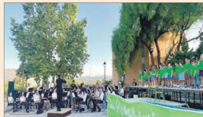
Un moment del concert celebrat a Beniarrés.

El concert va posar també en contacte als alumnes i professors del CRA Riu Serpis (aulari Perputxent) d'educació infantil i primària amb l'equip organitzatiu i els músics de l'Unió Musical de Beniarrés.