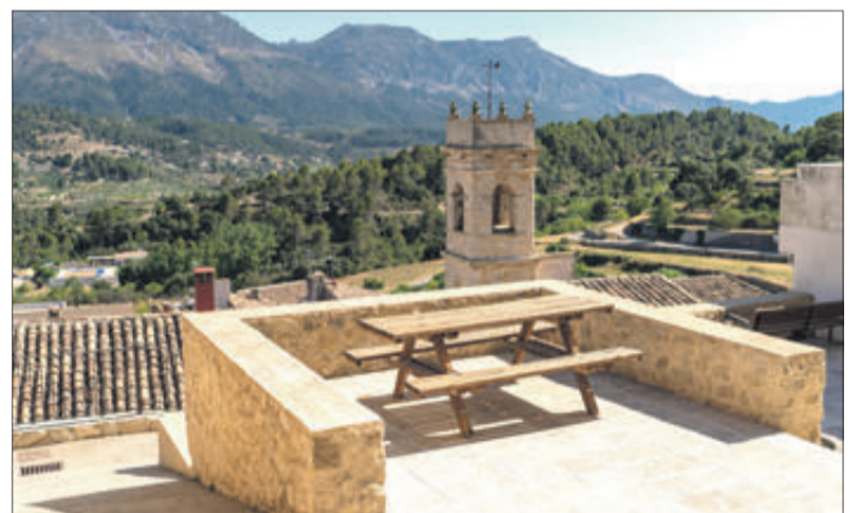
Tollos està envoltat de bells paratges.