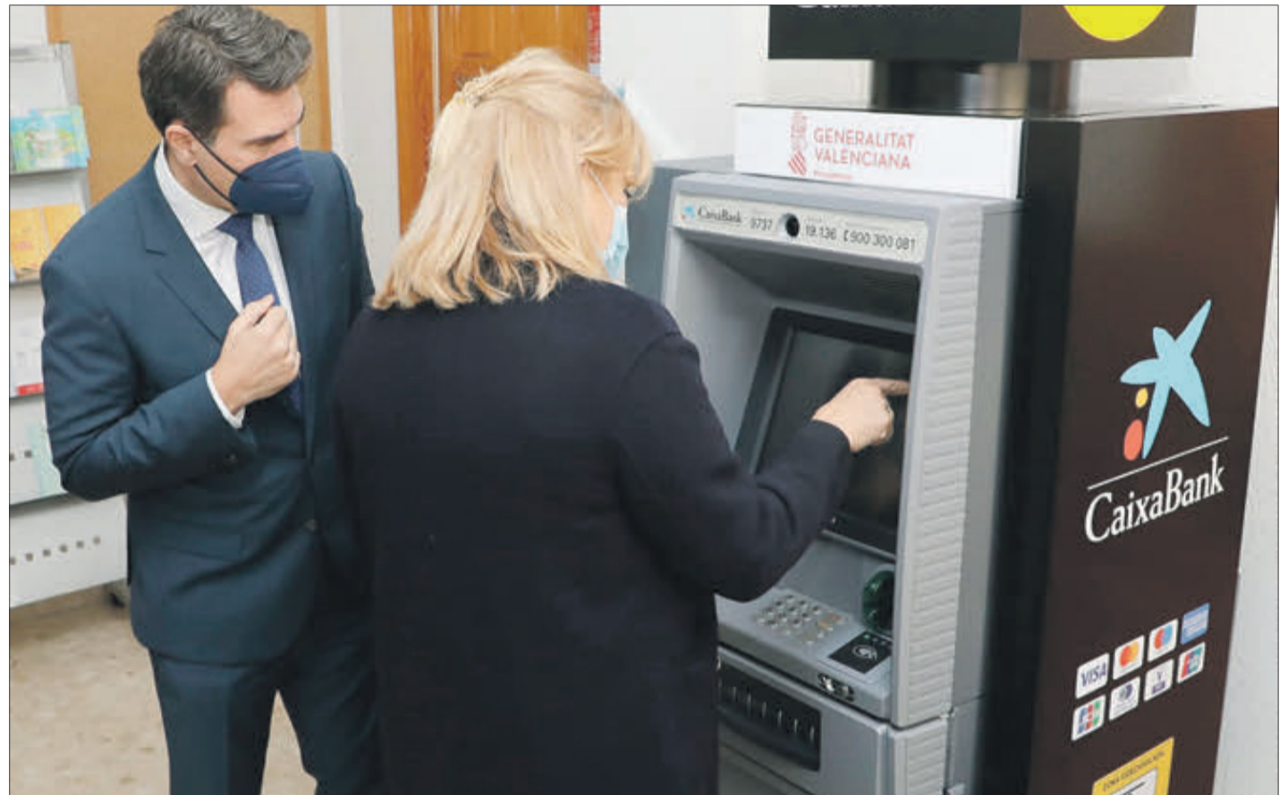
Presentació del programa contra l'exclusió financera, en un xicotet municipi de la Comunitat Valenciana.

“Garantir serveis és el primer pas per a evitar que la gent es vaja dels pobles”, va sentenciar la dirigent, que va revelar tot seguit com a clau el treball conjunt entre AVANT, CaixaBank i els ajuntaments, que han sigut els que han sol·licitat l'ajuda i han posat l'espai públic per a la instal·lació dels caixers.