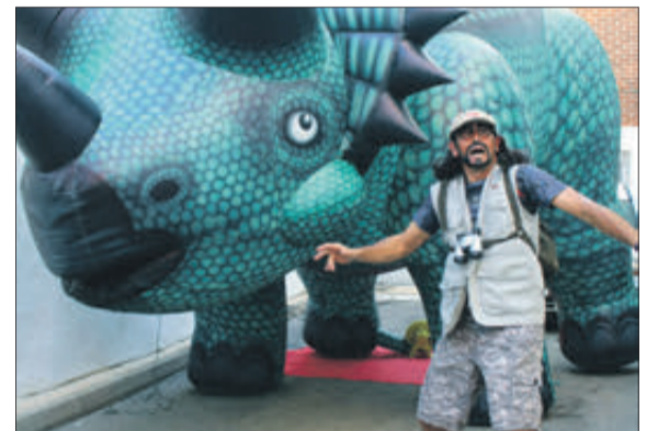
Plantà del Xop, processó, disfresses i teatre infantil, a Millena.