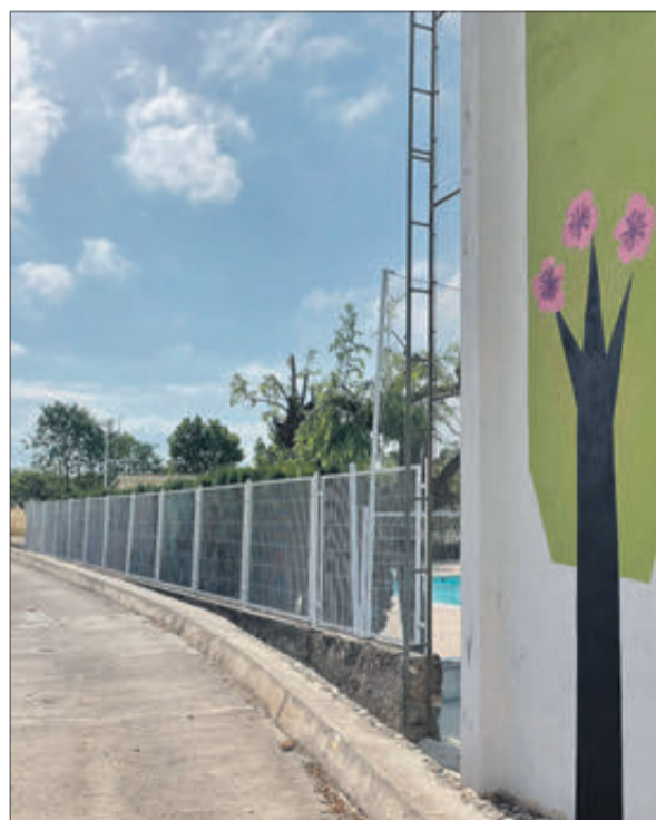
Instal·lacions que han sigut sotmeses a obres de millora.