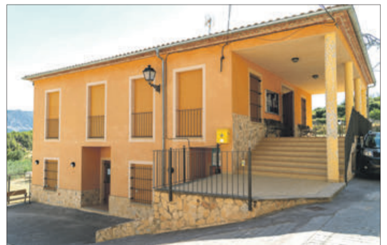
Edifici de l'Ajuntament.