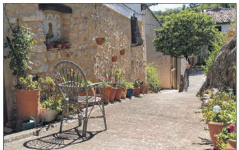
Un carrer del municipi.