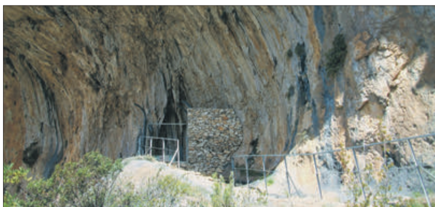
Santuari del Pla de Petracos.