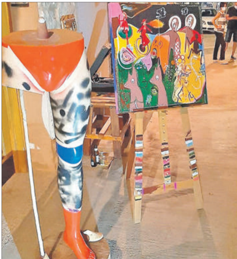
L'art torna als carrers del municipi.

L'exposició estarà oberta per a tot el públic de manera gratuïta del 13 al 27 d'agost i es tracta, assenyalen els organitzadors, d'una oportunitat única de poder recórrer un poble convertit en museu.