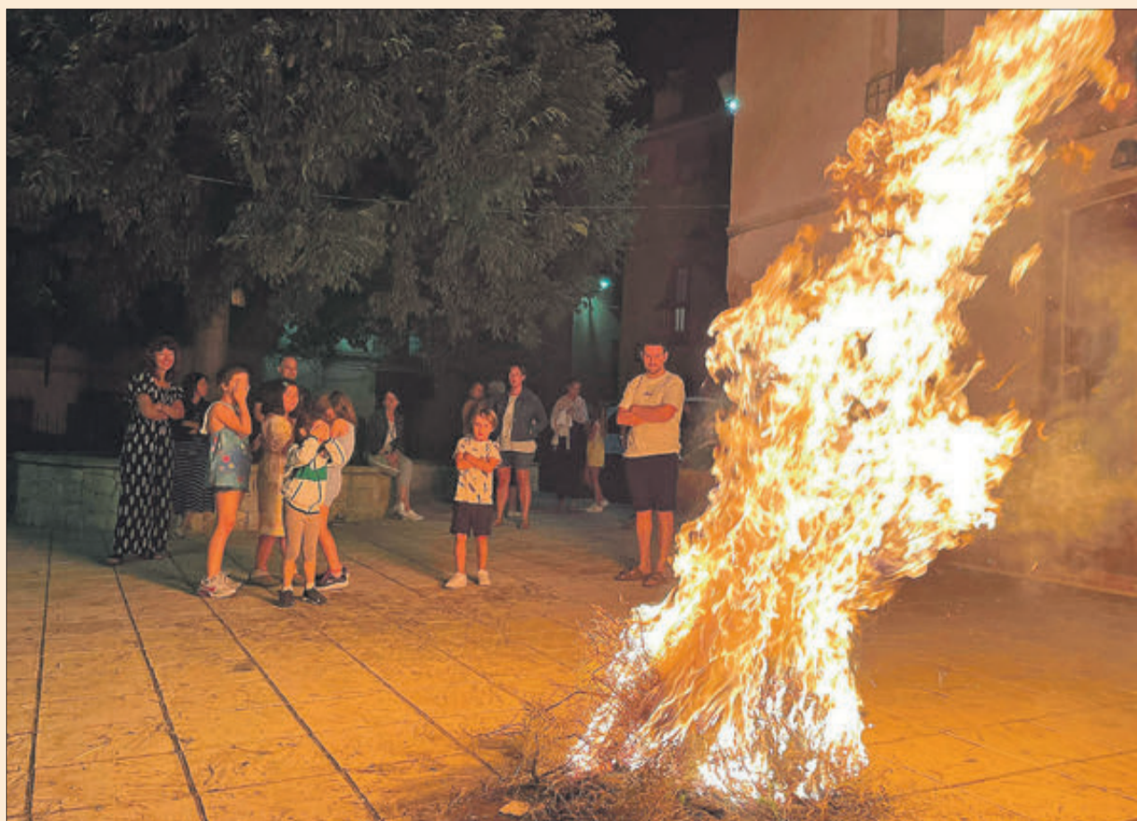
La festa de les fogueres de Sant Joan, en Fageca.

Finalment, el mateix dia de Sant Joan es va obrir la piscina municipal, amb un horari tots els dies d'11 a 14 i de 16 a 20 hores, amb diverses promocions, com el Bo Temporada o el Bo 15 dies. La primera hora, d'11 a 12, queda reservada per als majors de 60 anys o persones de risc.