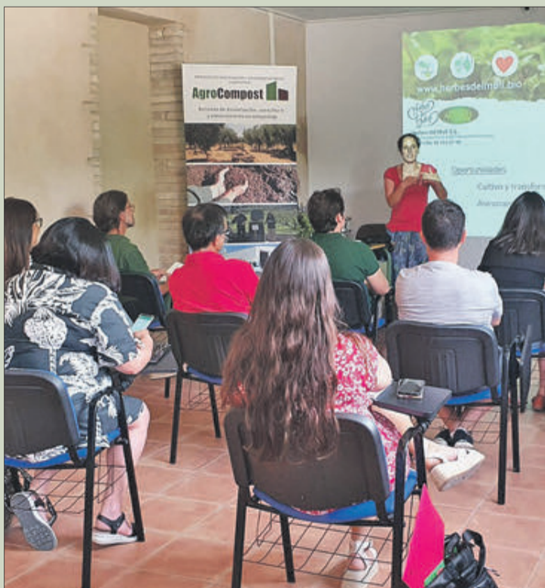
Dos de les sessions celebrades.