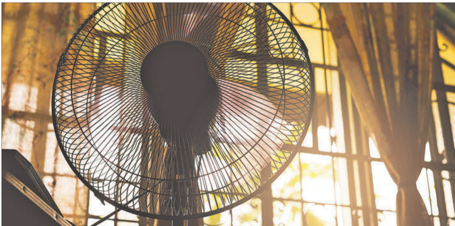
Un ventilador en funcionament a l'interior d'un habitatge, com a mesura per a combatre la calor.

Moltes persones rebutgen comptar amb aquests aparells d'aire condicionat, per diferents motius, entre ells, la salut, l'economia (cada vegada més) o l'esmentat canvi climàtic.