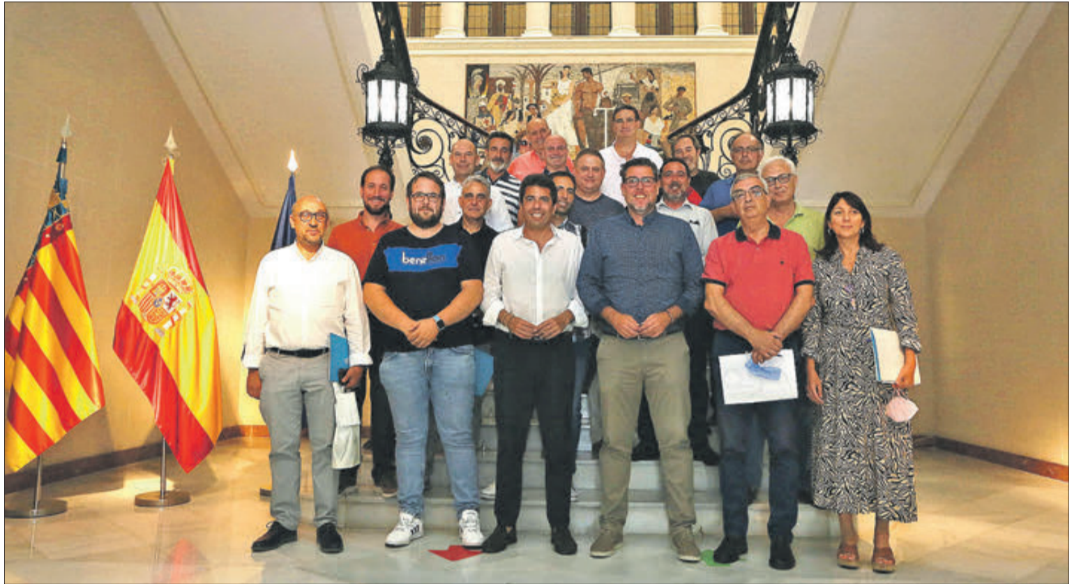
Els alcaldes assistents a la reunió i el president de la Diputació, Carlos Mazón.

Per a establir una nova regulació en les prestacions als ajuntaments, es redactarà un reglament, i durant l'elaboració d'aquesta norma, es dictaran instruccions amb la intenció especialment d'agilitar fórmules que garantisquen la