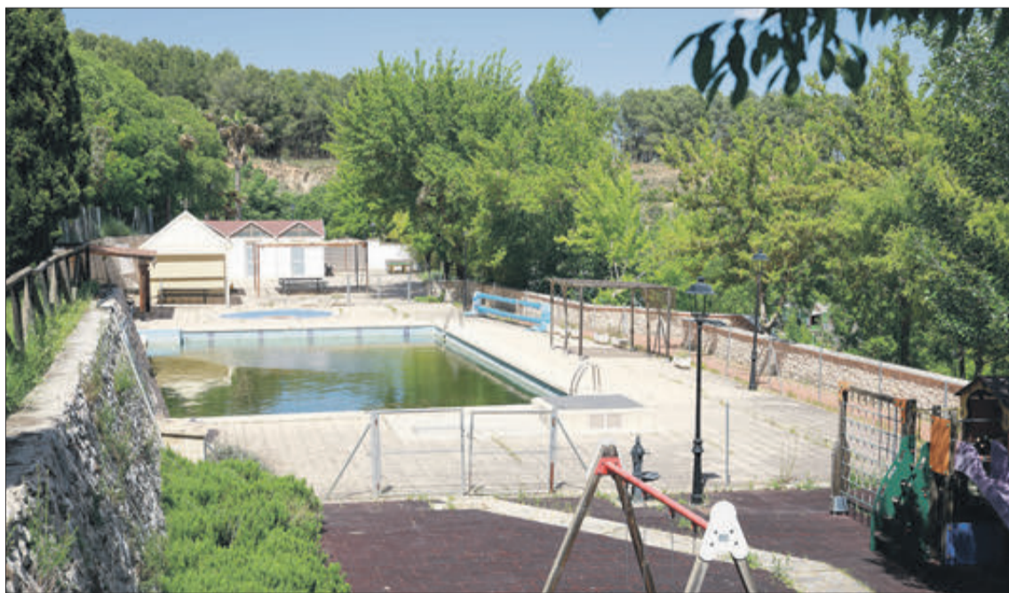
Imatge d'arxiu de la piscina d'Alcosser.

Finalment, cinc municipis més, entre ells Agres, han sol·licitat la prestació per a participar com a soci no líder del projecte i percebran 8.697 euros en total. Els altres consistoris són els d'Altea, Bigastro, Ibi i Tibi.