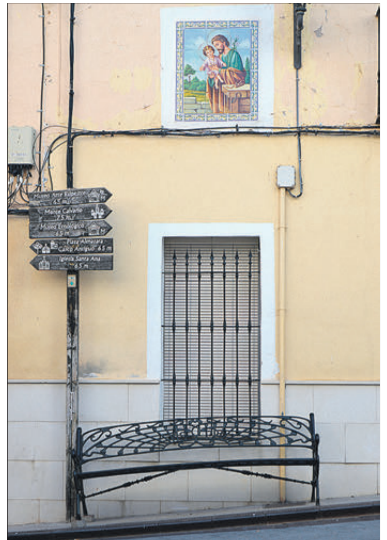
El municipi respira tranquil·litat