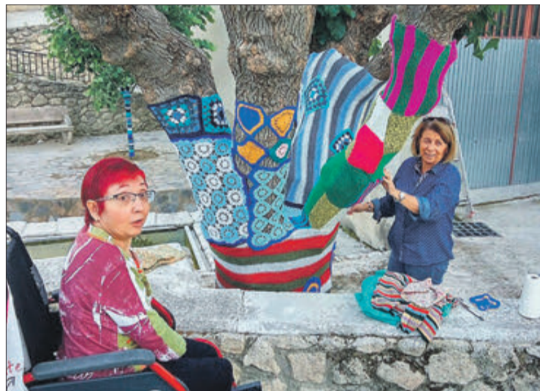
El grup va participar el passat 22 d'octubre en la II Trobada de la Dona Rural.