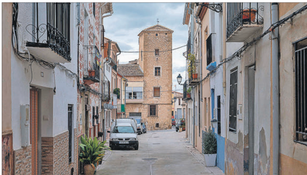
Un carrer de Benasau.

CENTRADA EN LA NATURALESA I GASTRONOMIA DE LA COSTA BLANCA