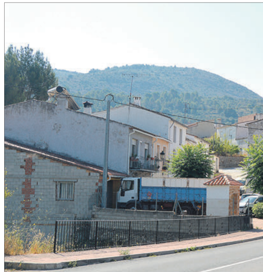
Un dels accessos al municipi.

També les rutes senderistes, tan valorades per la seua riquesa natural i paisatgística, la nostra hostaleria i les