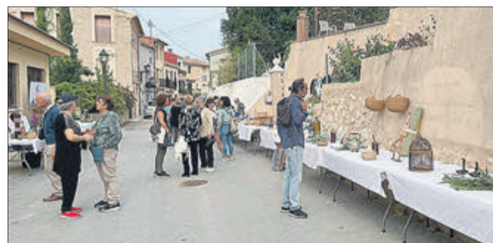
Algunes de les activitats desenvolupades amb motiu de la Trobada de la Dona Rural.

SEGONA EDICIÓ DE LA TROBADA DE LA DONA RURAL