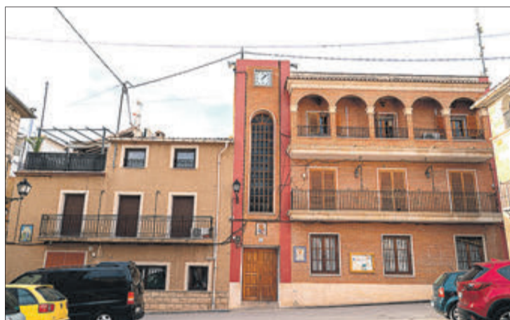
La seu de la banda de música.