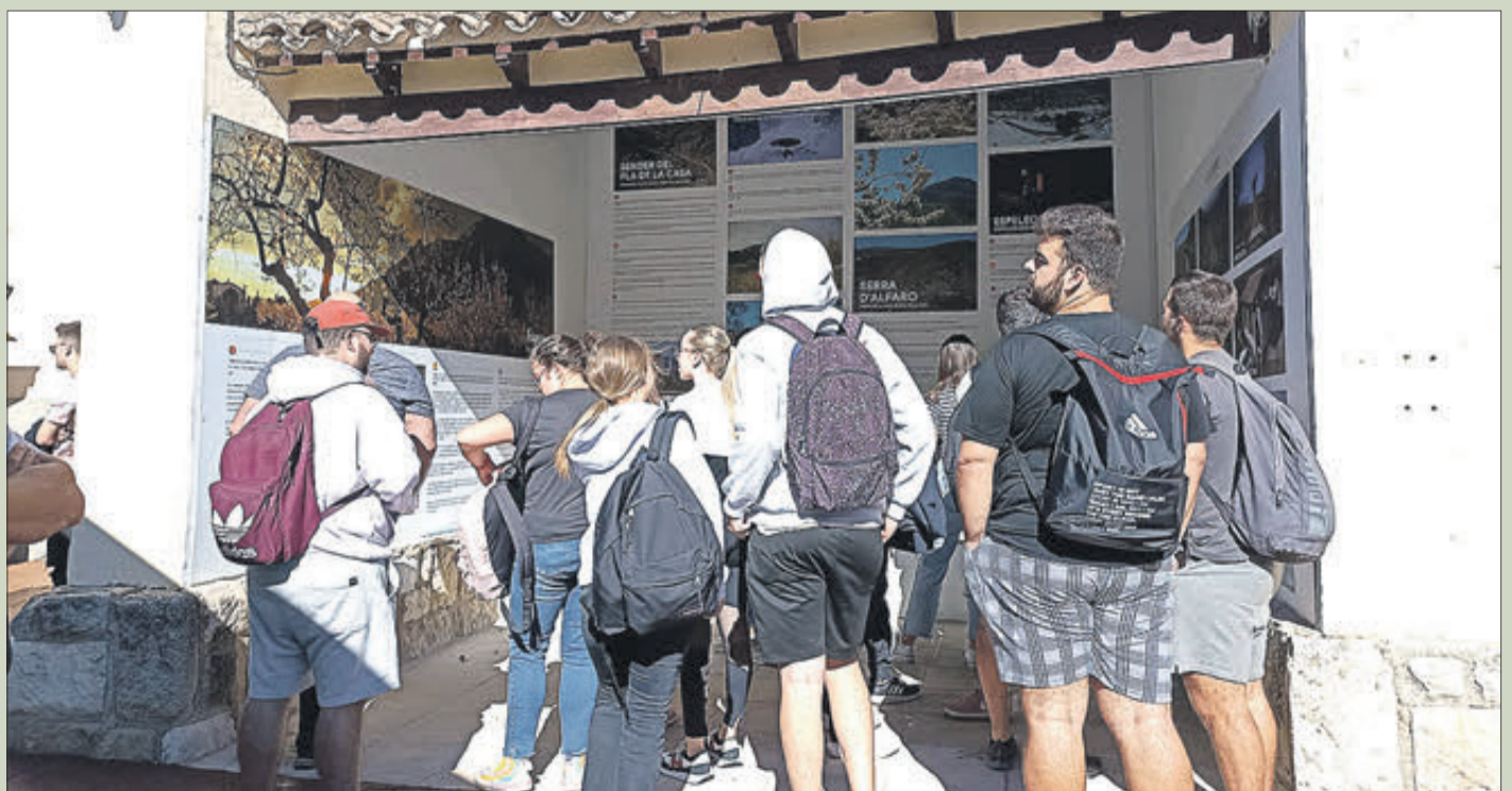
Estudiants de 4t Grau de Turisme de la UA, observen el punt d'informació turística a Fageca.

De la mateixa manera també s'han actualitzat els cartells de les coves de l'arena, sester, forn de calç i corral de la salema, i s'ha fet una nova, carrascar.