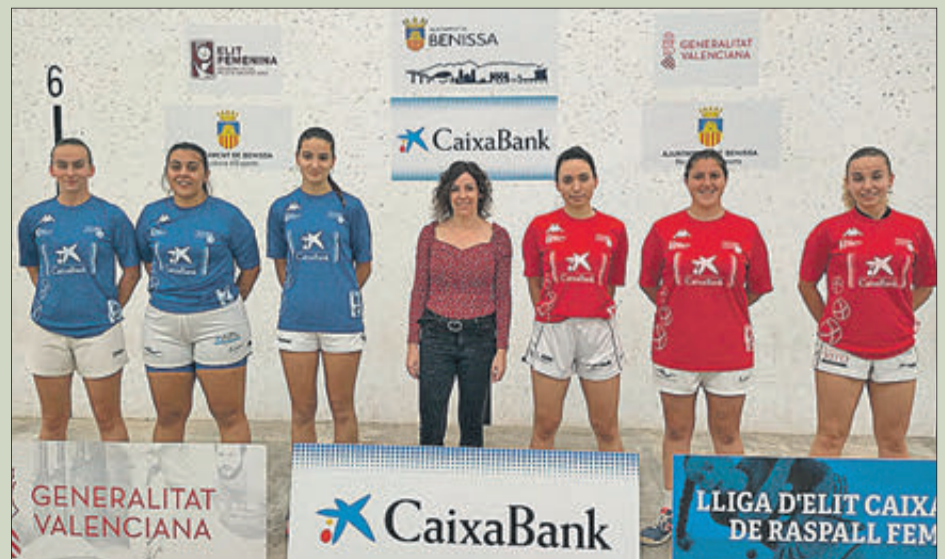
Jugadores que competiran al campionat professional.