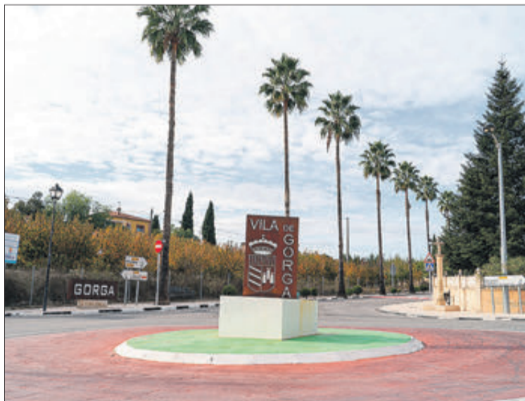
Rotonda d'accés a Gorga.

El seu terme municipal, que no arriba als 10 km 2 , limita amb els de Cocentai-