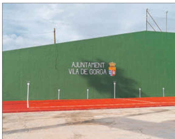
Frontó del poliesportiu.