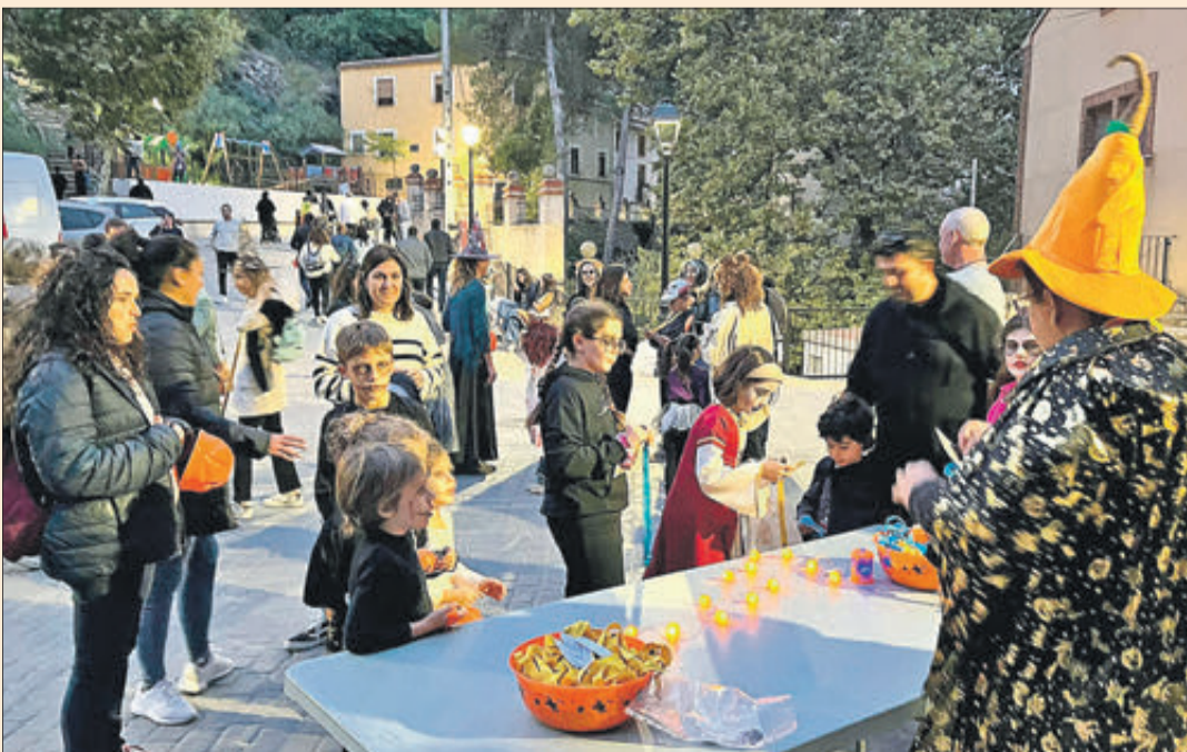
Diferents moments de la divertida festa 'Espanta la por' celebrada a Agres.