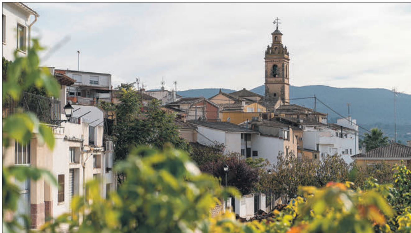
Vista panoràmica del municipi.