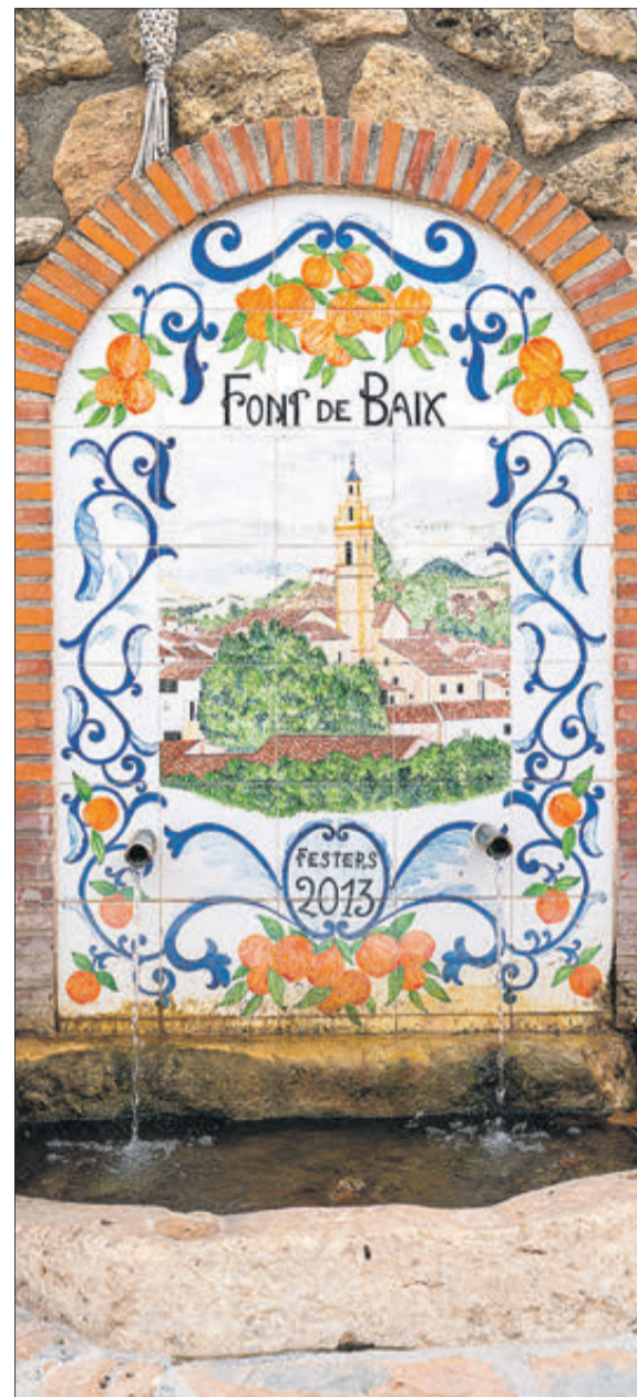
La Font de baix.

LES SEUES FESTES PATRONALS, A LA FI D'AGOST, HONREN A LA VERGE DE GRÀCIA