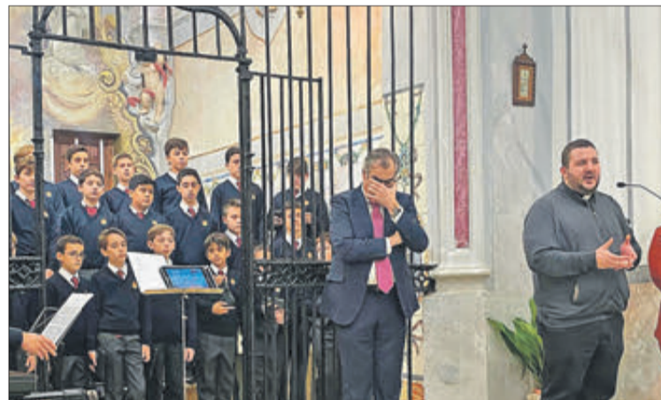
La campana, moment de la benedicció i actuació de l'escolania de València.