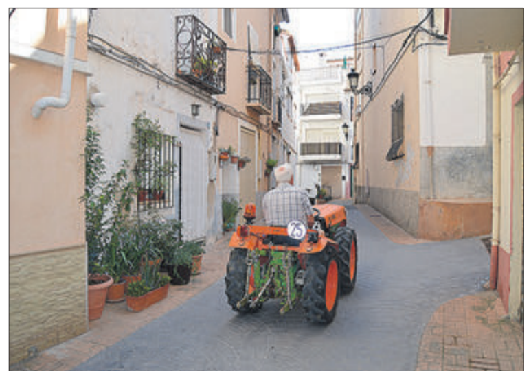
Un veí condueix un tractor per un dels carrers.

Castell de Castells, però ara els que la cultiven ho fan per oci o tradició familiar.