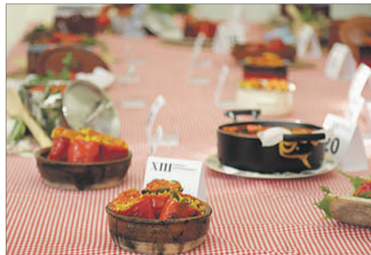
Una exhibició culinària va mostrar els secrets de dos plats típics d'Oliva.