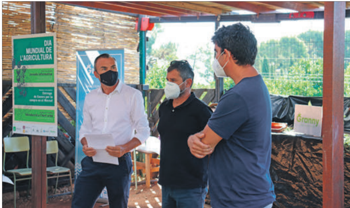
L'Ajuntament va celebrar el Dia Mundial de l'Agricultura amb un acte a la finca de Martí de Veses.

Així, la finca de Martí Deveses va acollir un acte en què es van explicar algunes de les iniciatives en matèria d'agricultura que s'han dut a terme a la ciutat en els últims mesos i que van des de la redacció d'un Pla Estratègic per a posar en valor l'agricultura al municipi, fins a les millors realitzades en la xarxa de camins agraris del terme, o el Pla de Lluita Integrada contra les Plagues, que persegueix crear un ecosistema natural que ajude a reduir l'impacte negatiu de les plagues i a millorar el medi ambient. Precisament, un dels participants en la