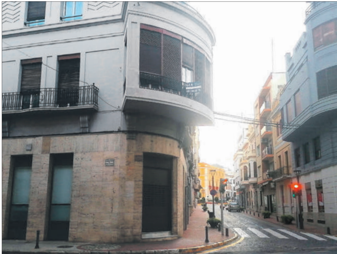
Un dels locals llogats per l'Ajuntament.

La necessitat de reubicar aquests serveis i departaments municipals està provocada pel mal estat en què es troba la segona planta de l'edifici de l'Ajuntament, afectada per les goteres i filtracions de la coberta, uns problemes que venen de lluny. De fet, segons apunten