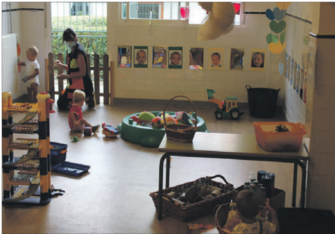
Les escoles infantils van rebre els primers alumnes el passat 1 de setembre.

Les primeres escoles en obrir les portes als alumnes van ser les tres d'educació infantil, que des de l'1 de setembre van començar les activitats amb els més menuts. Tot i la pandèmia, l'assistència