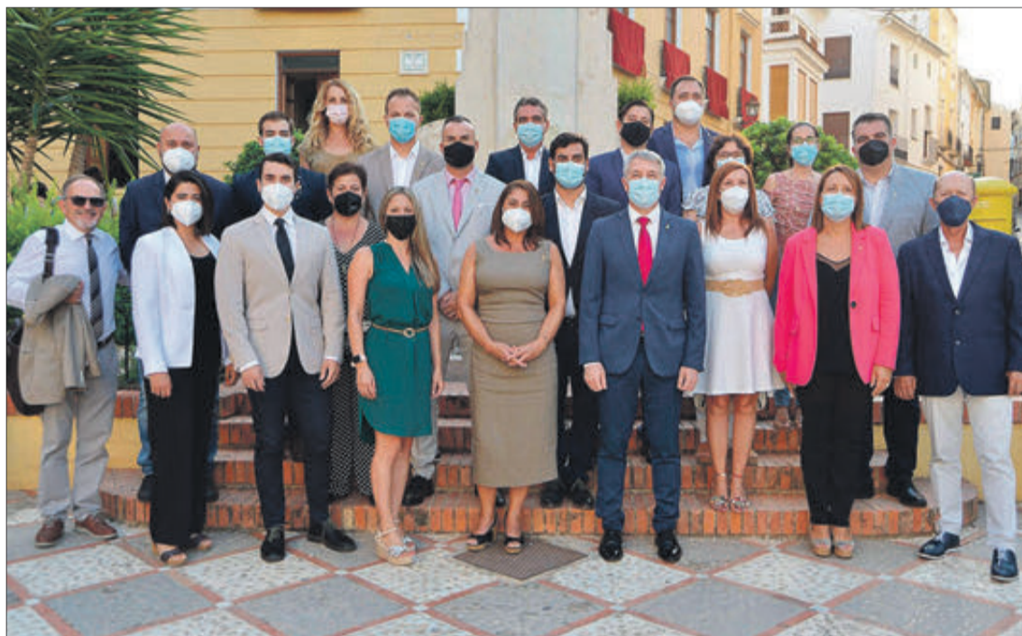
La corporació municipal, amb la nova alcaldessa al centre.