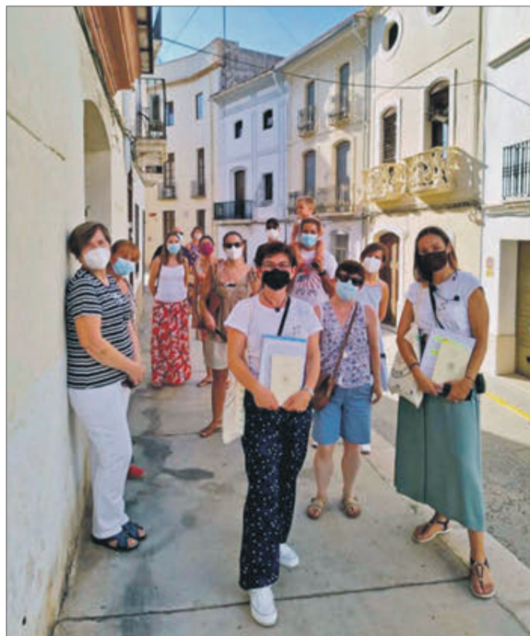
Les visites guiades van començar el passat 11 de setembre.

La participació és gratuïta, però cal inscripció prèvia per formulari fins a completar l'aforament normatiu de 15 persones per grup i sessió. A més, per a assistir serà necessari rebre la confirmació de reserva i caldrà seguir les mesures de seguretat recomanades per les autoritats sanitàries: ús obligatori de mascaretes durant tot el recorregut i de gel hidroalcohòlic a l'entrada del museu, així com mantenir una distància interpersonal mínima d'1,5 metres que no s'aplicarà entre persones convivents.