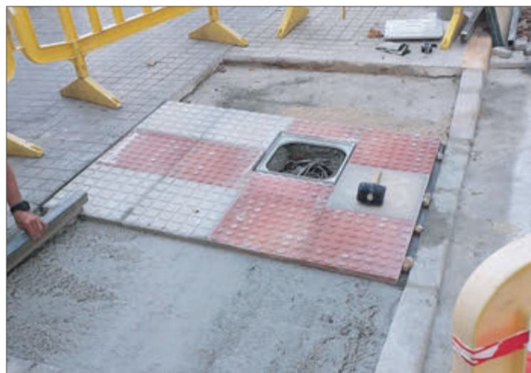
Alguns dels treballs realitzats en l'entorn dels centres.

Les activitats previstes en els tres centres es duen a terme seguint les mesures de sanitat proposades que, amb la experiència del curs passat, permeten moti-