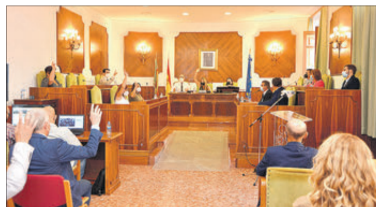
Un moment del ple d'investidura de la nova alcaldessa.