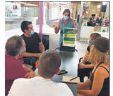
Entrega de llavors al mercat.

donar visibilitat al Pla de Lluita Integrada contra les plagues i que ocuparà diversos espais per tota la ciutat. En aquesta primera imatge es pot veure un 'fardatxo', un rèptil autòcton en habitual en la geografia valenciana i en algunes