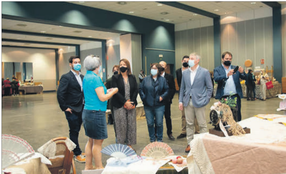
La Fira del Fil es va celebrar per primera vegada en 2020.