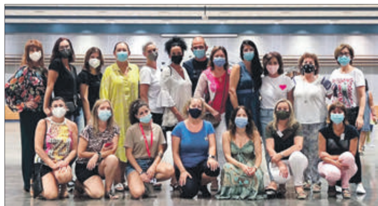
La Fira va celebrar la seua novena edició al Centre Polivalent.