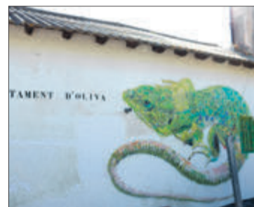
El mural, amb el fardatxo.

La cita va servir també per a descobrir un mural que vol