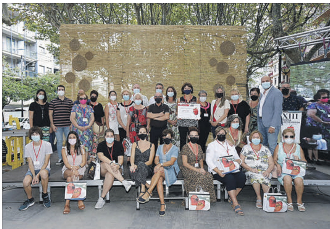
Vint persones van participar en el VII Concurs de Pebrera Farcida.