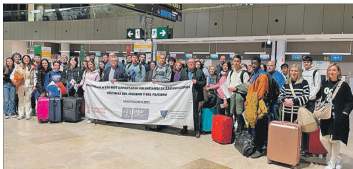
Alumnes del Gregori Maians en l'aeroport de Mauthausen.