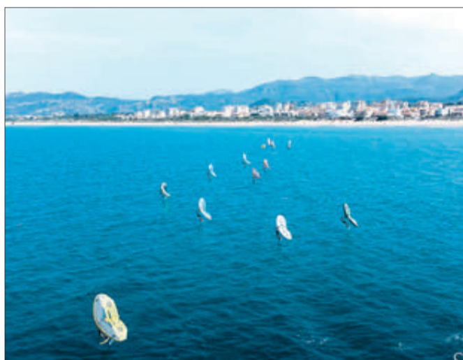
Una imatge de la competició.