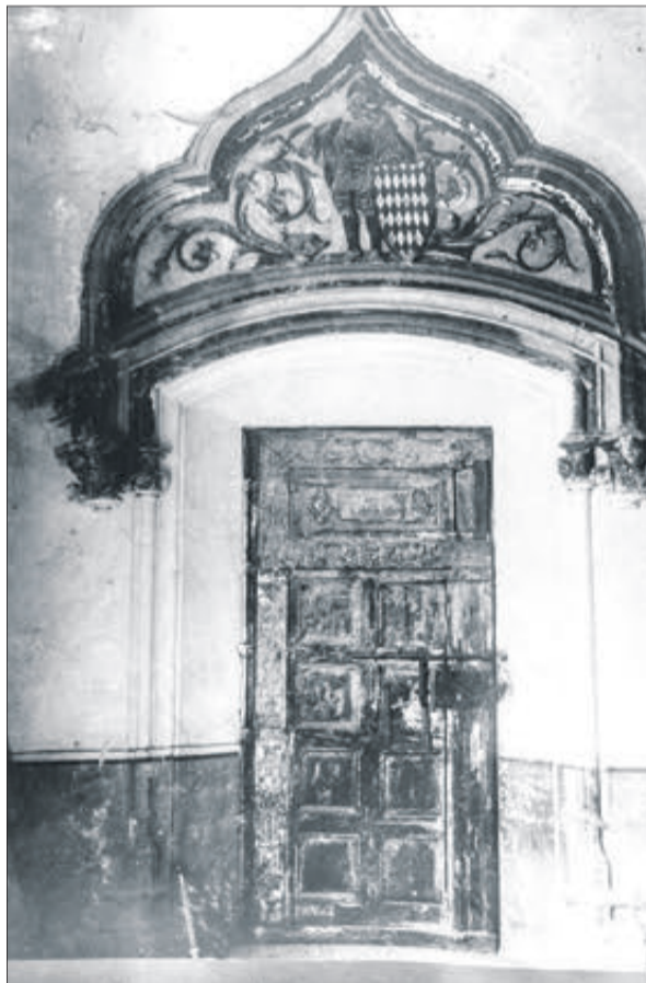
Porta del Palau amb el Guerrer dels Centelles (3).