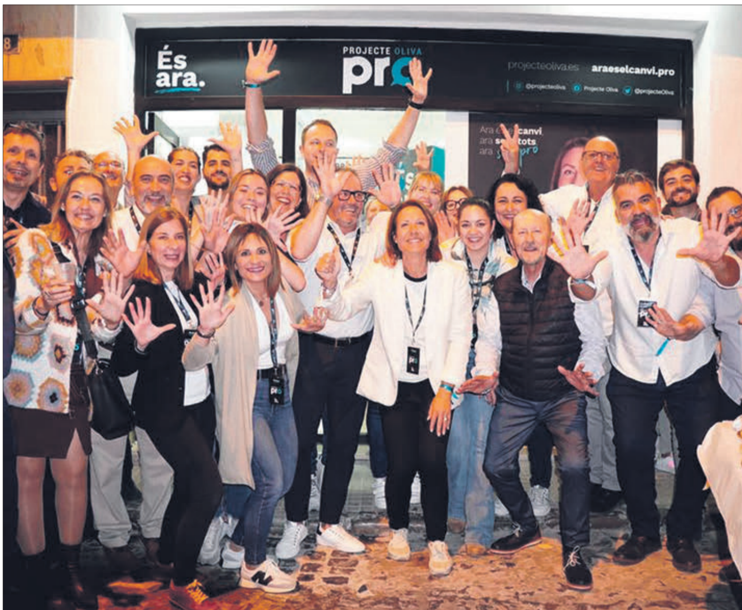
Celebració de la candidatura de PRO Oliva durant la nit electoral.

entrava com a alcaldessa el primer que anava a fer era una Auditoria dels comptes municipals, en considerar que en determinats departaments hi ha hagut moltes despeses que es podrien haver estalviat i amb menor cost.