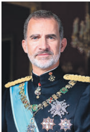
El rei Felip.

El mes següent, novament monsenyor Simeoni escrivia al cardenal Antonelli