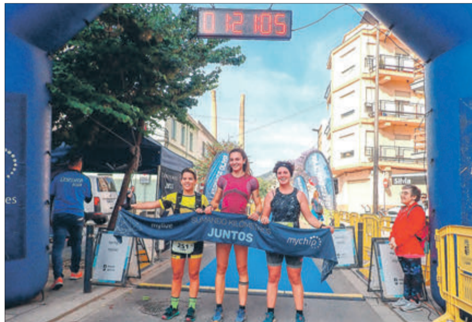
La tres primeres classificades en l'sprint curt.

Covatelles d'Oliva celebrat aquest diumenge des del carrer Comte d'Oliva pel terme municipal olivense i organitzat pel C.E. L'espenta en col·laboració amb el Departament d'Esports de l'Ajuntament d'Oliva.