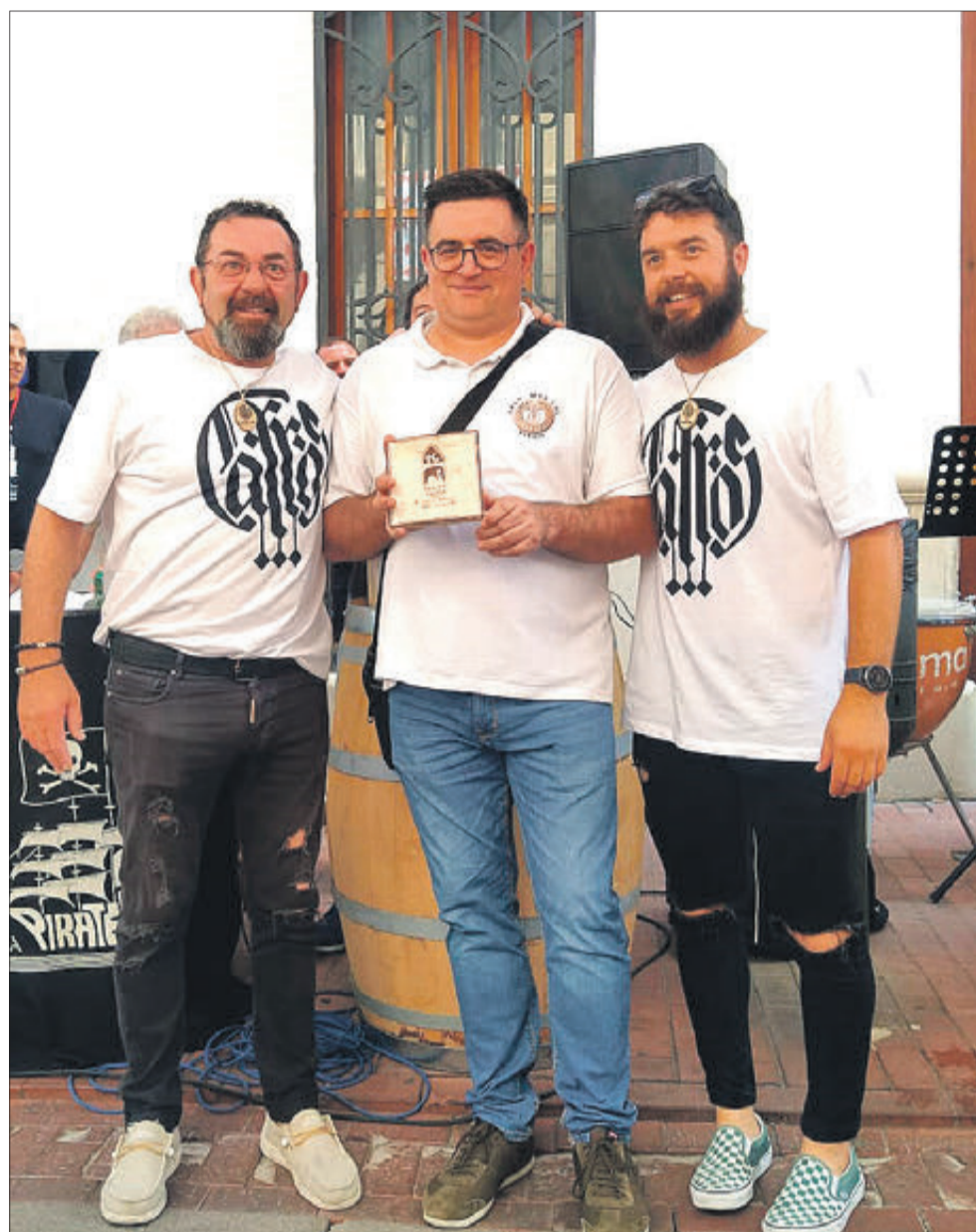
Grup Musical Albaida va tindre el seu record.