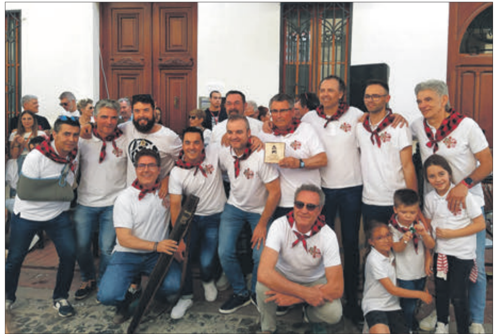
Filà Andalusos d'Alcoi.