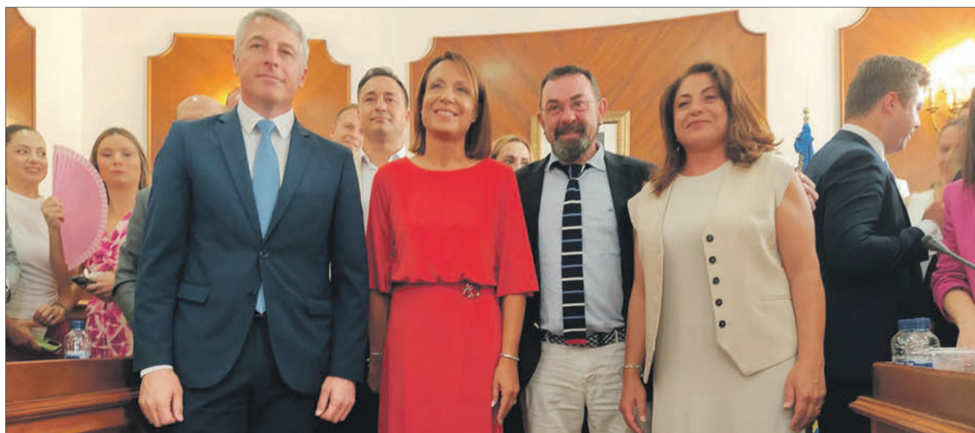
Quatre alcaldes d'Oliva.