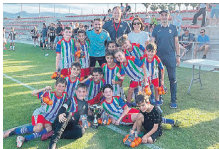
El Kelme d'Elx es va imposar en categoria benjamí.

per a ells és un al·licient jugar en les mateixes instal·lacions que ho fan els professionals". Després del Covid els millors equips d'Europa trien aquest complex per a fer els seus stages de concentració. Recentment va estar el Getafe C.F. i estan previstos altres grans clubs d'Europa de futbol i també de Rugbi de nivell internacional.