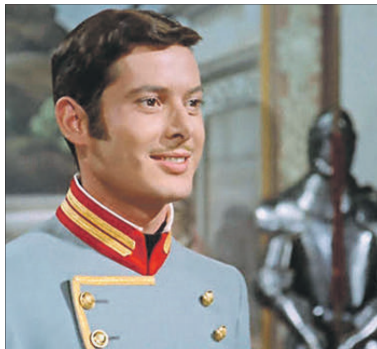
L'actor oliver Vicente Parra.

Los Borbones en pelota. Ricardo de la CIERVA, La otra vida de Alfonso XII , Fénix, Madrid, 1994.