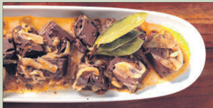
Un dels plats als quals es fa referència en el llibre.

Així, podem trobar aperitius i tapes "de sempre" que encara es poden veure amb una certa assiduitat i altres, els més, que ja no es cuinen. Receptes tradicionals d'Oliva com Fesols bullits, Favas bullides, Carxofes, Mandonguilles d'abadejo, Pastissos de gamba amb bleda, Coques, Favas sacsades, Allipebre de musola, Caragols en salsa, Una Pallà: papes i boquerons, Sardina a la