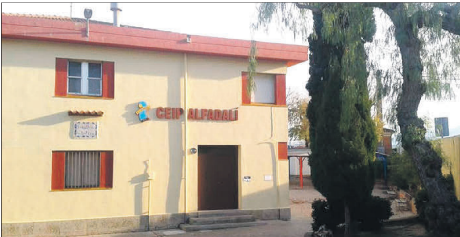
CEIP Alfadalí serà ampliat i millorat.

Per la seua banda l'IES Gregori Maians rebrà una subvenció en forma d'inversió de 1,1 milions d'euros per a la construcció d'un nou gimnàs que s'ubicarà en un nou pabelló junt a les actuals instal·lacions del centre; i el Conservatori Professional de Música, Josep Climent de la nostra localitat, ampliarà el seu aulari i tindrà unes millores amb noves sales per un import de 1,7 milions d'euros, donat que s'ha quedat menut per a les necessitats actuals del centre educatiu i el nombre d'alumnes.