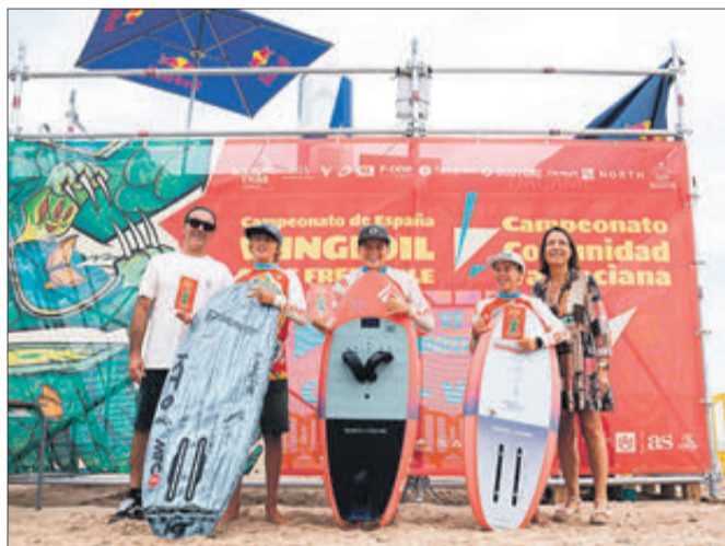
Podi de la categoria júnior.