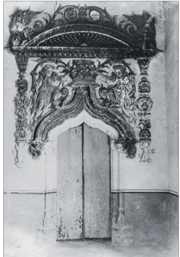
Porta del Palau dels Centelles.

l'Ajuntament d'Oliva i la Associació Cultural Centelles Riusech amb la Hispànic Society of America, es va acordar la cessió del llegat de Fischer a Oliva després d'una sèrie de condicions. Les negociacions van continuar fins al 3 de febrer de 2010, data en la qual finalment va arribar a Oliva el llegat documental de