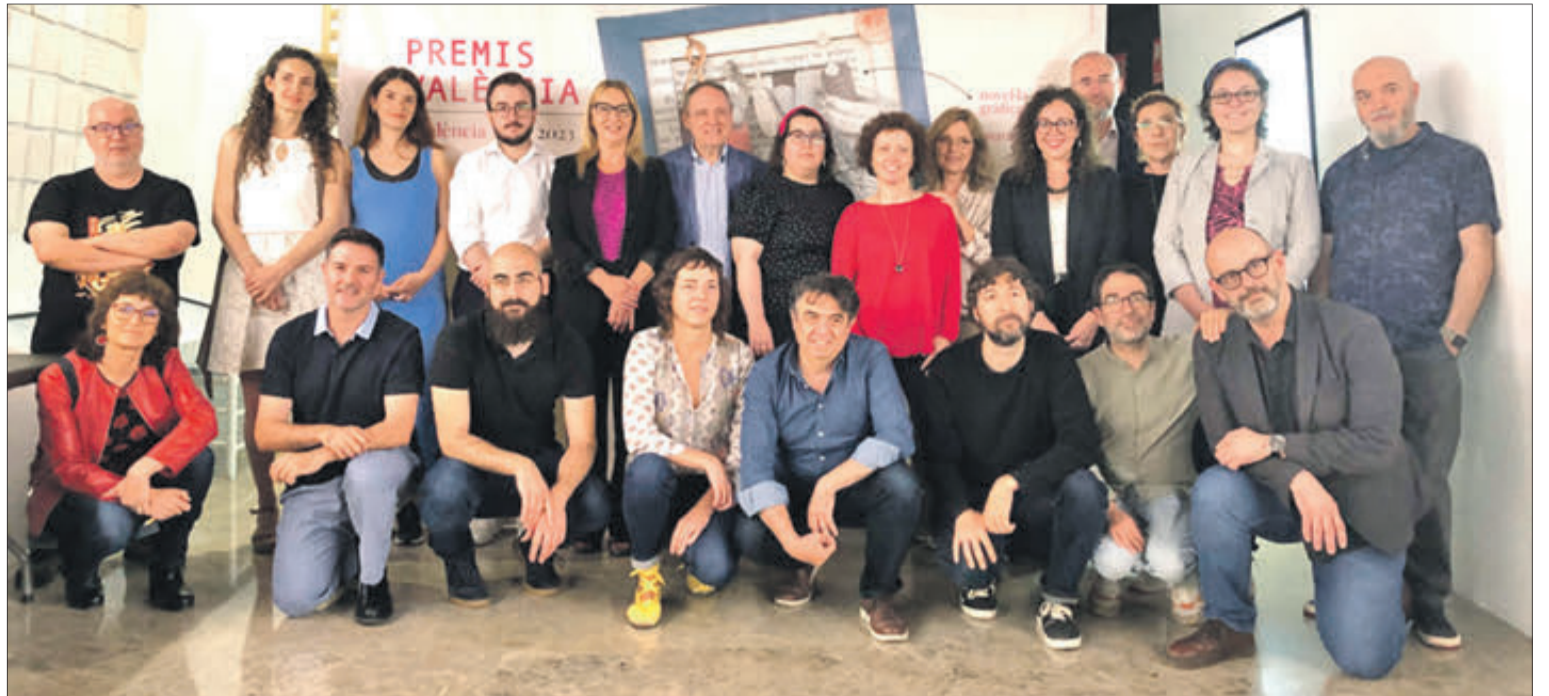
Membres del jurat dels premis València Nova.