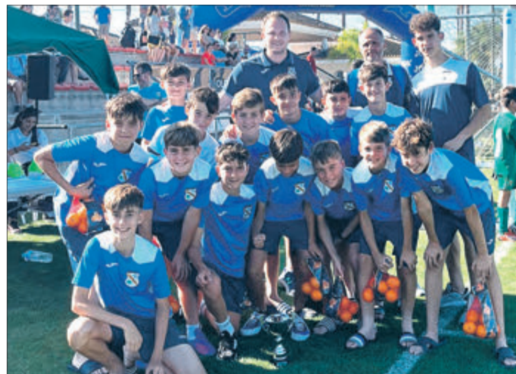
El UD Oliva va ser tercer en alevins.