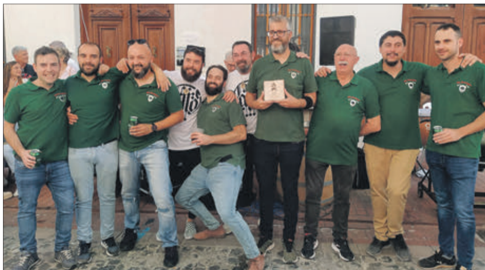
Membres dels Muntanyesos d'Albaida.