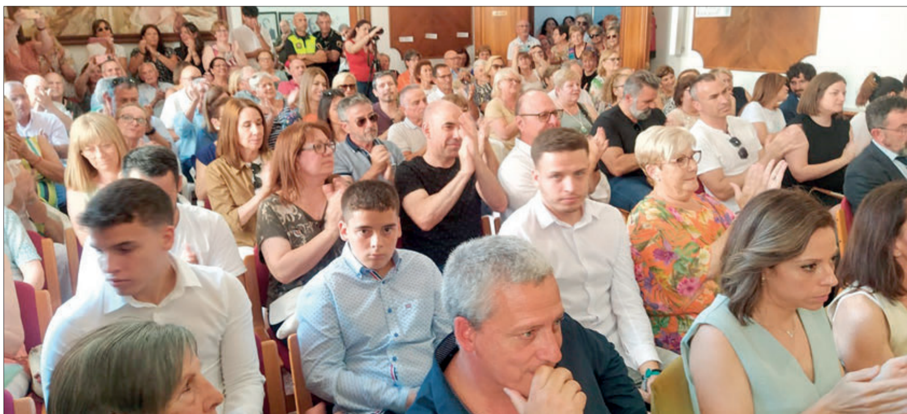
L'Ajuntament s'òmplic per a assistir a l'acte d'investidura.