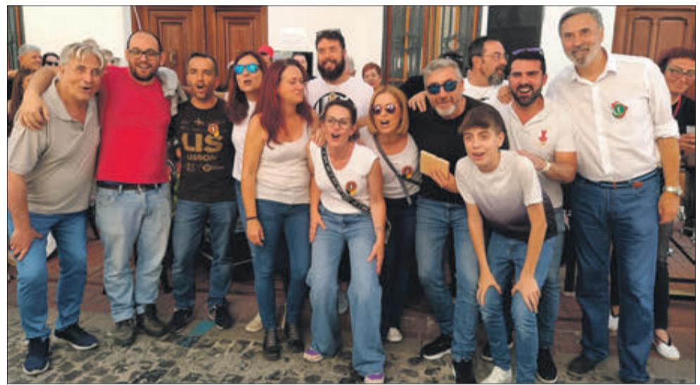
La filà Cordón d'Alcoi va guanyar entre les del bàndol moro.

LA FILÀ CORDÓN EN EL BÀNDOL MORO I ANDALUSOS D'ALCOI I MUNTANYESOS D'ALBAIDA VAN RESULTAR GUANYADORS