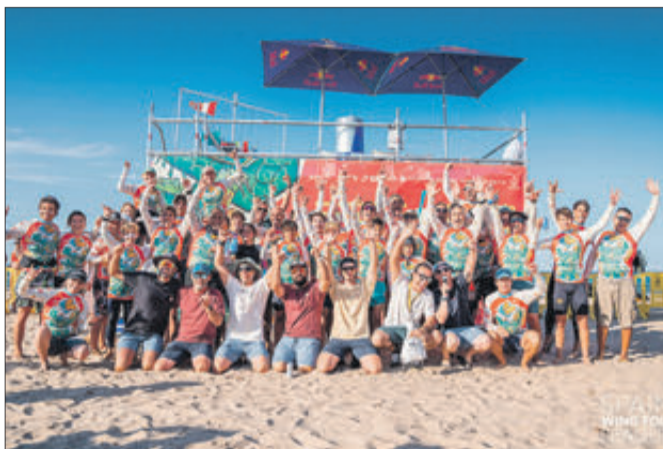
Els participants en la prova.