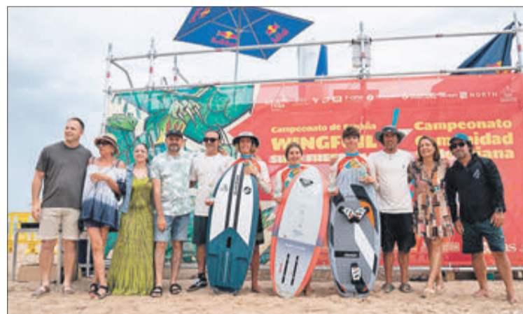
Els guanyadors i autoritats.