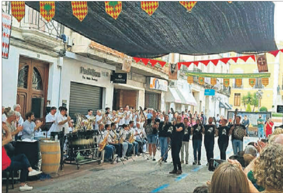
Gran ambient en l'acte del II Enginy Fester de la Filà Pirates.