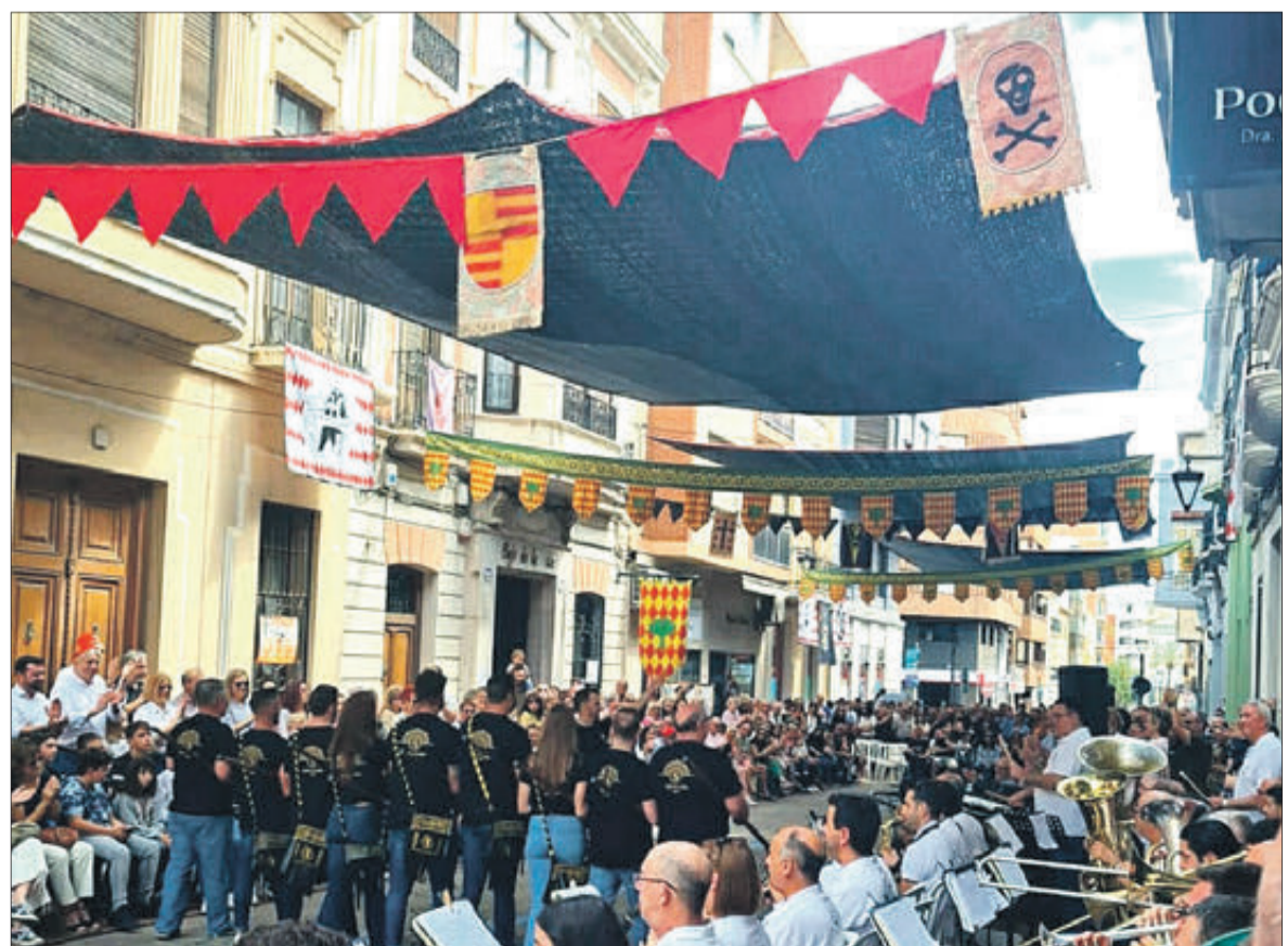
El grup musical d'Albaida va fer sonar totes les peces dels participants.

Cal destacar el gran ambient al carrer, amb l'engalanament amb banderes d'Oliva i la còpia del fris del Palau dels Centelles a l'eixida de l'acte. Els participants van gaudir en acabar el concurs-exhibició d'un dinar de putxero tradicional.