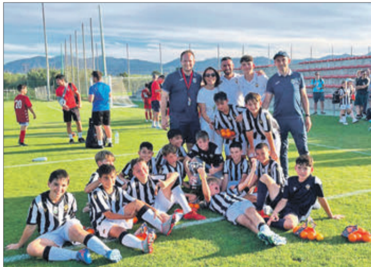
El Castelló va ser el guanyador en categoria aleví.