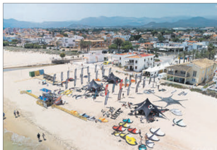
Vista aèria del muntatge organitzatiu a la platja.