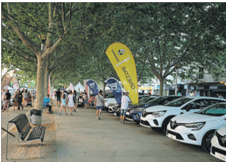
La fira del motor i la matinal motera, en imatges del passat any.

El recinte firal és un espai ampli, tancat i vigilat per tal d'assegurar aforaments i el compliment de les mesures de seguretat. A més incorpora una exposició del Concurs de Carretons premiats els passat dissabte en la tradicional Baixada de Carretons, organitzat per les associacions del Barri del Pinet i