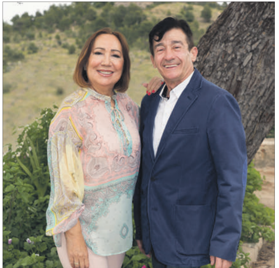
Els pregoners 2022

ENGUANY, PER PRIMERA VEGADA, EL PREGÓ DE FESTES EL REALITZARAN DOS PERSONES ALHORA