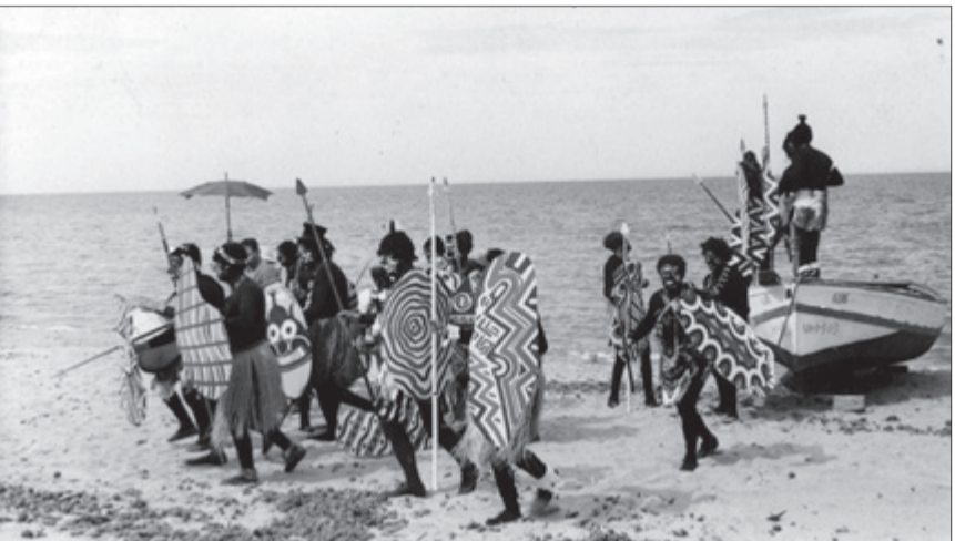
Desembarc Canibal. Anys 50.