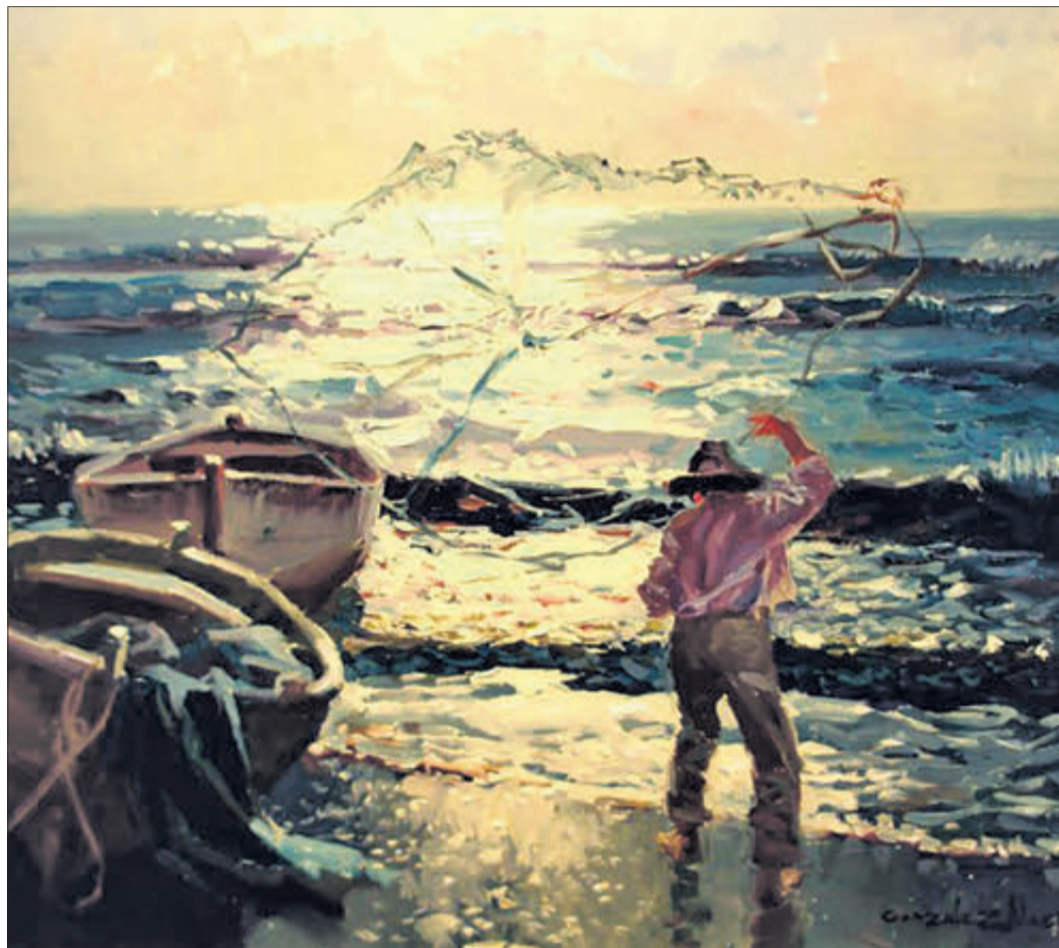
El raller, oli del pintor borrianenc González Alarcu

A la meua família hi havia rallers. A mi m'haguera agradat ser-ho també, però, per unes coses o altres, tot va quedar en un desig de joventut. I com que ara és massa tard per a intentar-ho, almenys em queda la satisfacció de gaudir quan veig un raller a les nostres platges. Llavors, els meus records viatgen a la velocitat de la llum fins aquelles vesprades d'estiu on jo feia d'escuder de mon pare. Una mena de Sanxo Pança atrafegat per l'arena esperant que la sort ens brindara alguna llissa. Ah! Quan pescàvem a rall... Moments eterns amanits amb arroves de felicitat. Moments d'un passat entranyable on renaix l'enyorança pels absents.