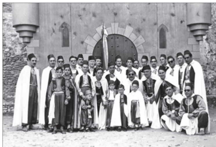
Festers davant del Castell (1950).