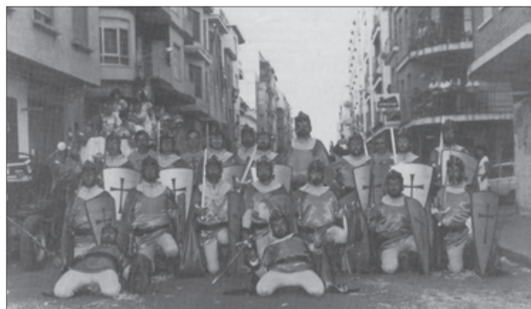
Els Creuats. Anys 80.

del patriarca Sant Joan de Ribera, probablement en la seua visita pastoral de 1571, per refermar la fe cristiana d'un barri que llavors comptava amb una majoria de cristians nous amb un culte no massa evident.