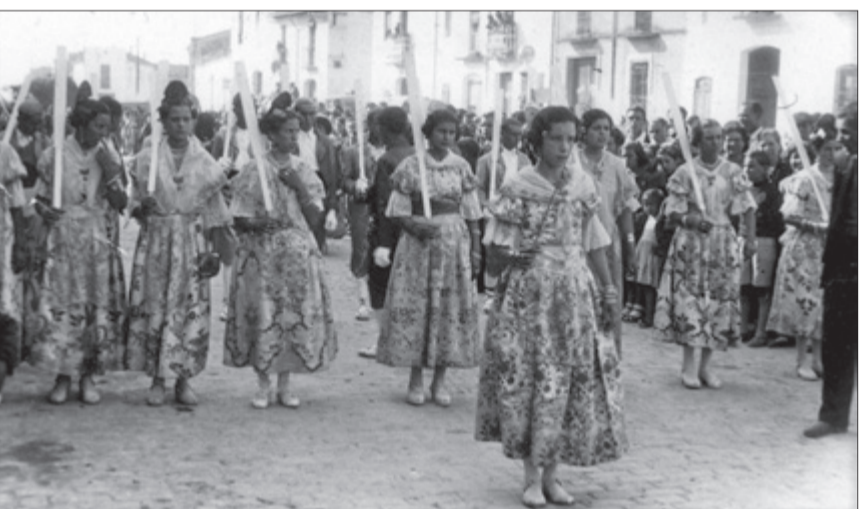
Moros i Cristians. Anys 50.