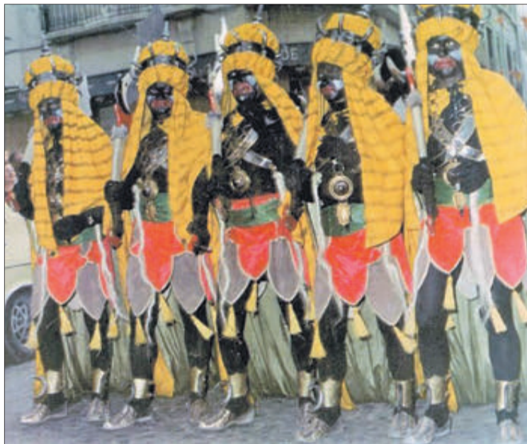
Moros del Metall, any 1975.

Posteriorment fou declarat el Comtat d'Oliva creat el 1449 per Alfons el Magnànim en consideració pel suport rebut per Francesc de Gilabert Centelles i Queralt, comtat que va continuar en mans de la família Centelles, posteriorment emparentada amb els Borja, ducs de Gandia. El raval o moreria d'Oliva, que es va