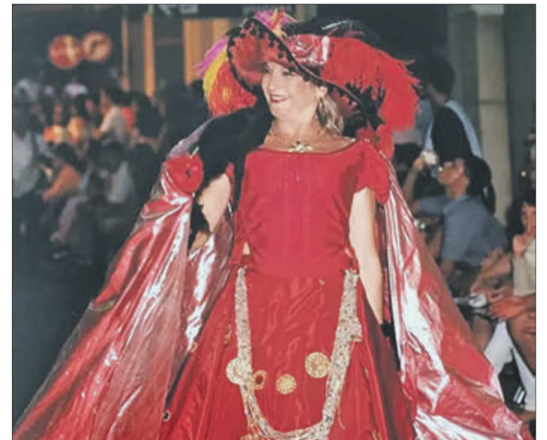
La primera dona capitana festera Fila Pirates (1999).

El rei va entrar al Regne de València per la Font de la Figuera el divendres dia 5 de febrer de 1.599, descansant dissabte dia 6 a Xàtiva. L'endemà, oïda missa al Convent de Santa Clara, proseguí cap Oliva, on feu nit al Palau Comtal dels Centelles entre el diumenge dia 6 i el dilluns dia 7