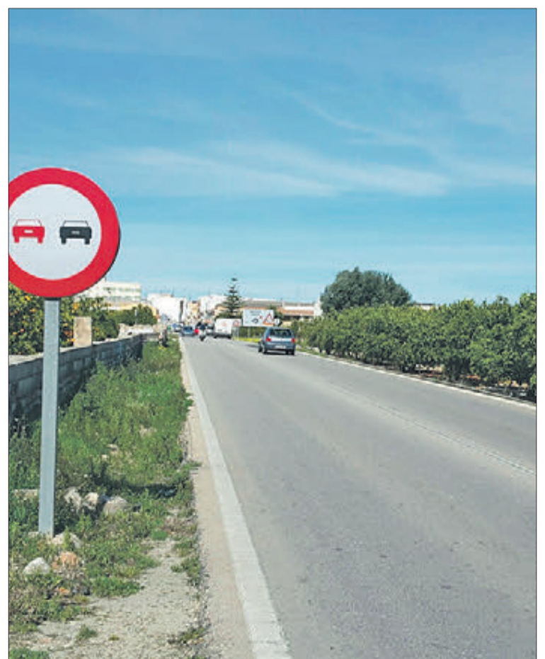
Carretera que serà sotmesa a obres de millora.

El carril bici recorrerà en paral·lel a la nova calçada, que comptarà amb sistemes de drenatge per a evitar acumulacions d'aigua en una carretera molt transitada, especialment durant la temporada estival ja que dona accés a les zones costaneres del sud de la Safor.