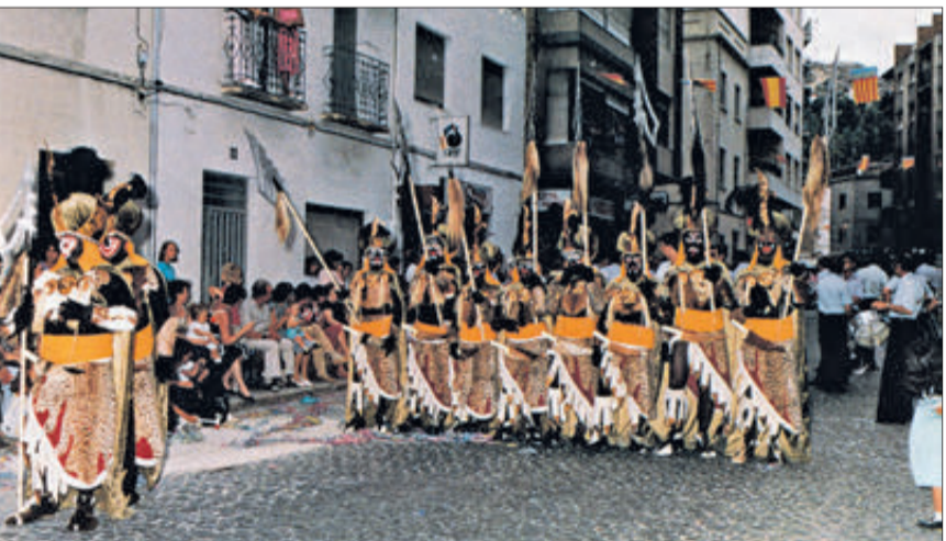
La filà Canibals, als anys 80.