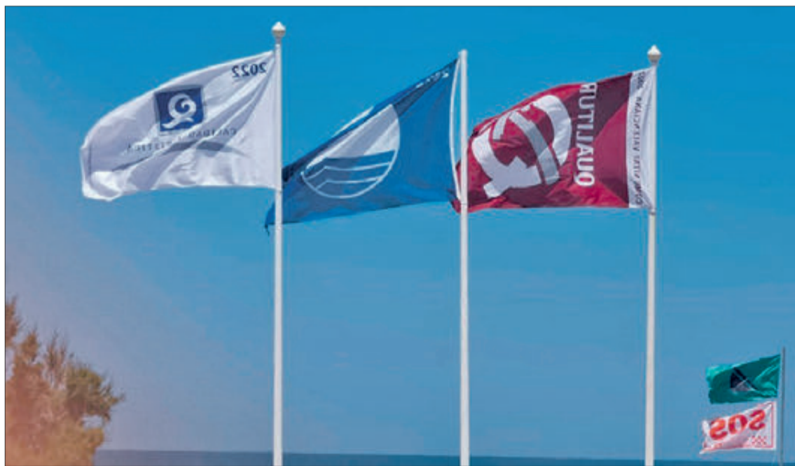
Les banderes de qualitat de les platges d'Oliva

taments de Turisme i de Platges de l'Ajuntament d'Oliva, que dirigeix Kino Calafat s'ha apostat una altra vegada per la seguretat i accessibilitat a l'hora de dotar a les platges de banderes amb codis de senyals perquè les persones que tenen problemes a l'hora de distingir els colors pugu-