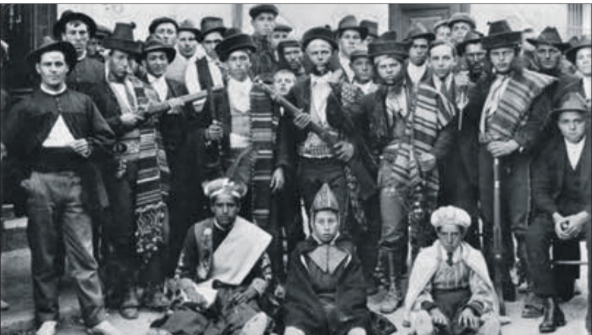
Bandolers. Oliva 1921.