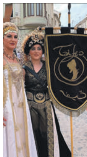
Estandart dels Taifes