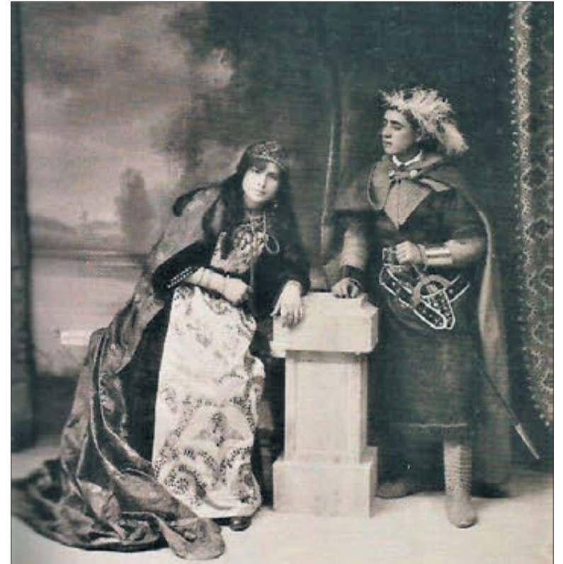
Governador i governadora (1920).

LES FESTES HAN TINGUT TRES ETAPES I HI HA CONSTÀNCIA DE LA SEUA CELEBRACIÓ EN 1921