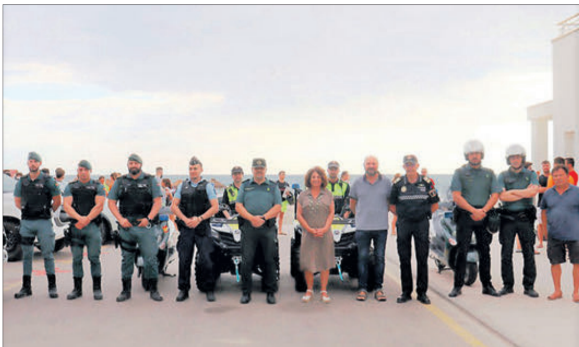
Presentació del dispositiu de platges

Així, a la platja de Terranova-Clotal, hi ha instal·lats dos punts de vigilància amb dos socorristes cadascun, i a la platja de Terranova-Burguera, un punt