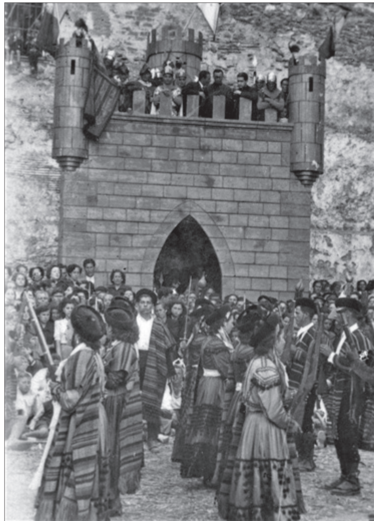
Moros i Cristians al Castell. Anys 50.