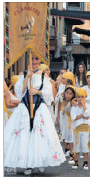
Estandart dels Maseros