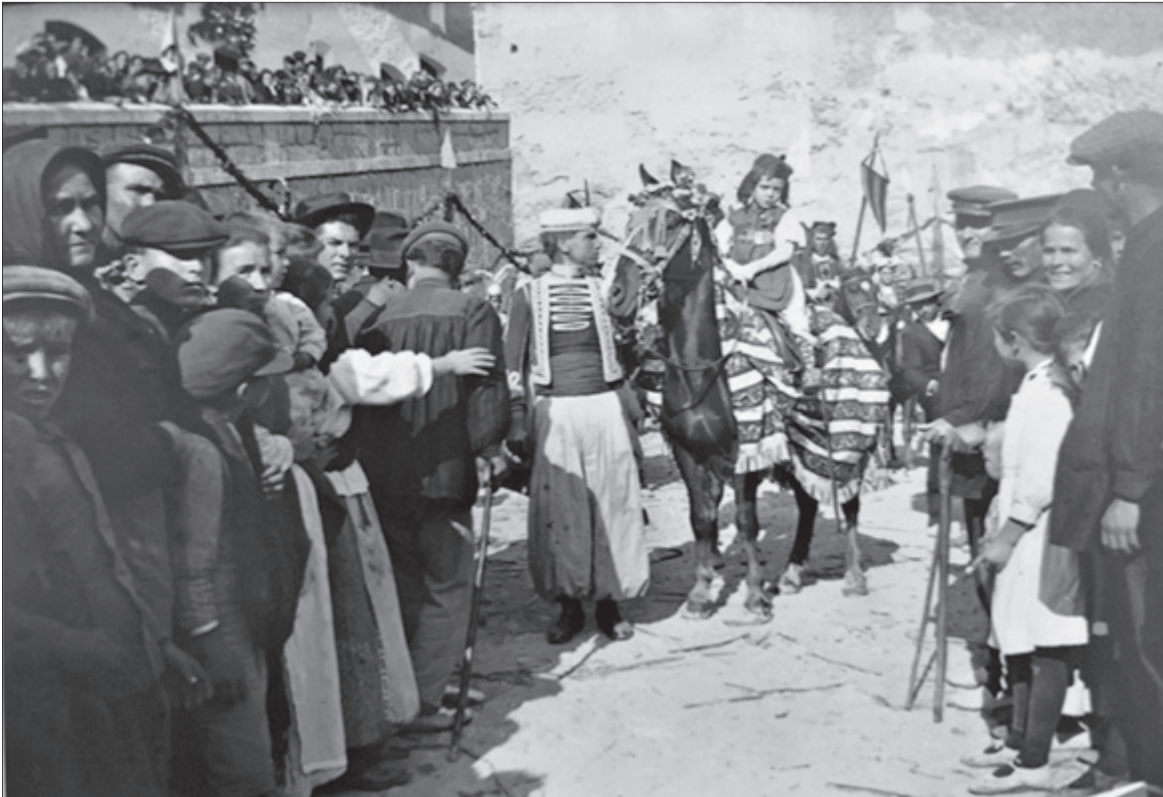
L'Àngel Anunciador (1921).