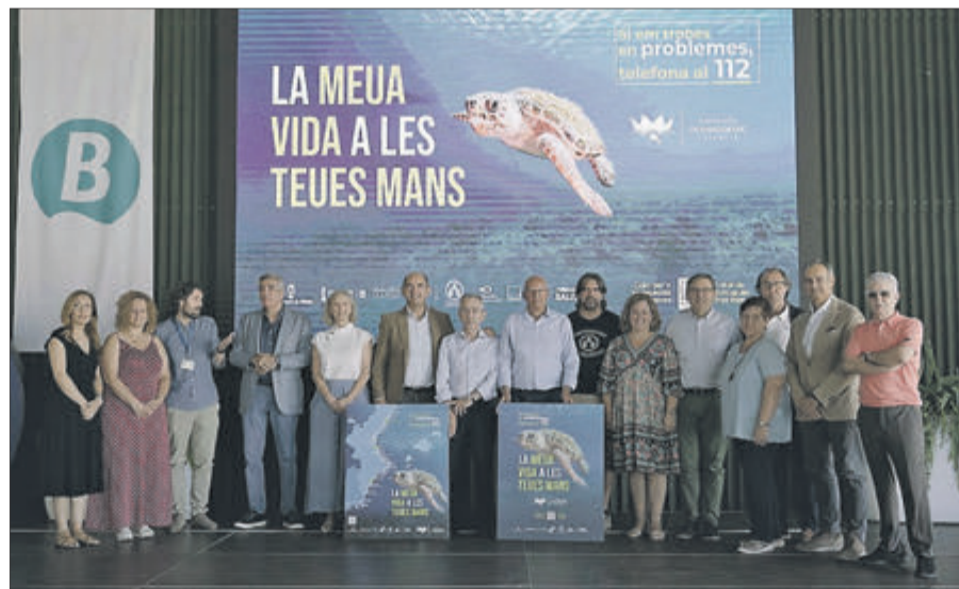
La iniciativa mediambiental està present a 60 municipis.