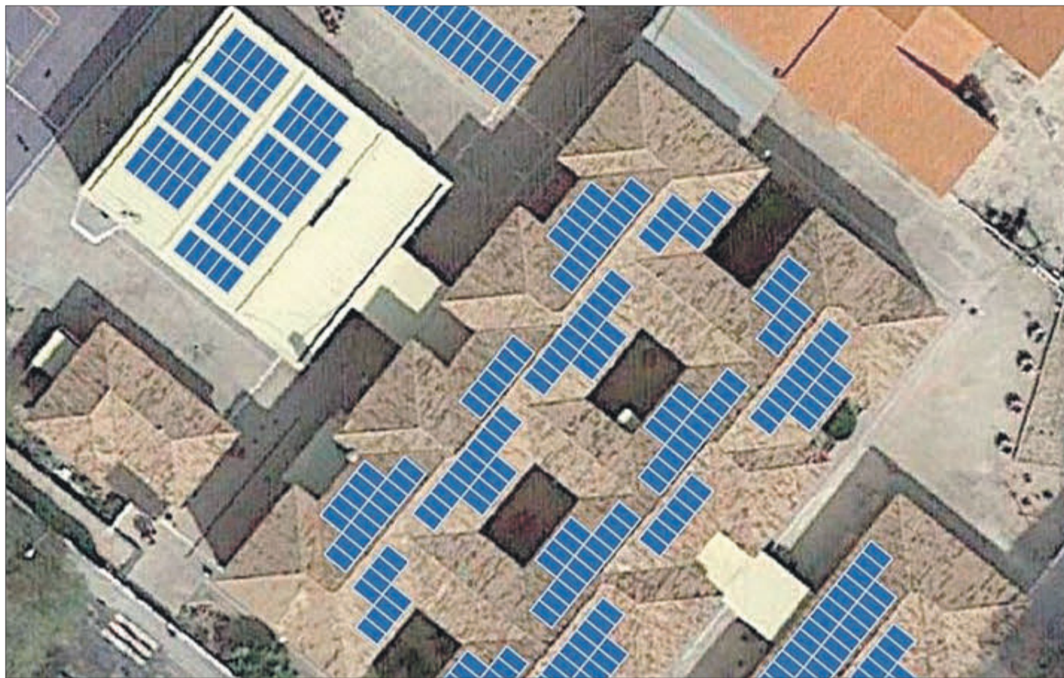
Projecte del CEIP Lluís Vives per a la instal·lació de plaques solars.

PER A LA INSTAL·LACIÓ DE SISTEMES FOTOVOLTAICS APROFITANT ELS SOSTRES DE LES ESCOLES