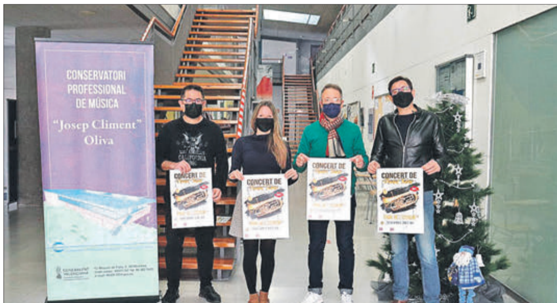
Presentació del tradicional concert.