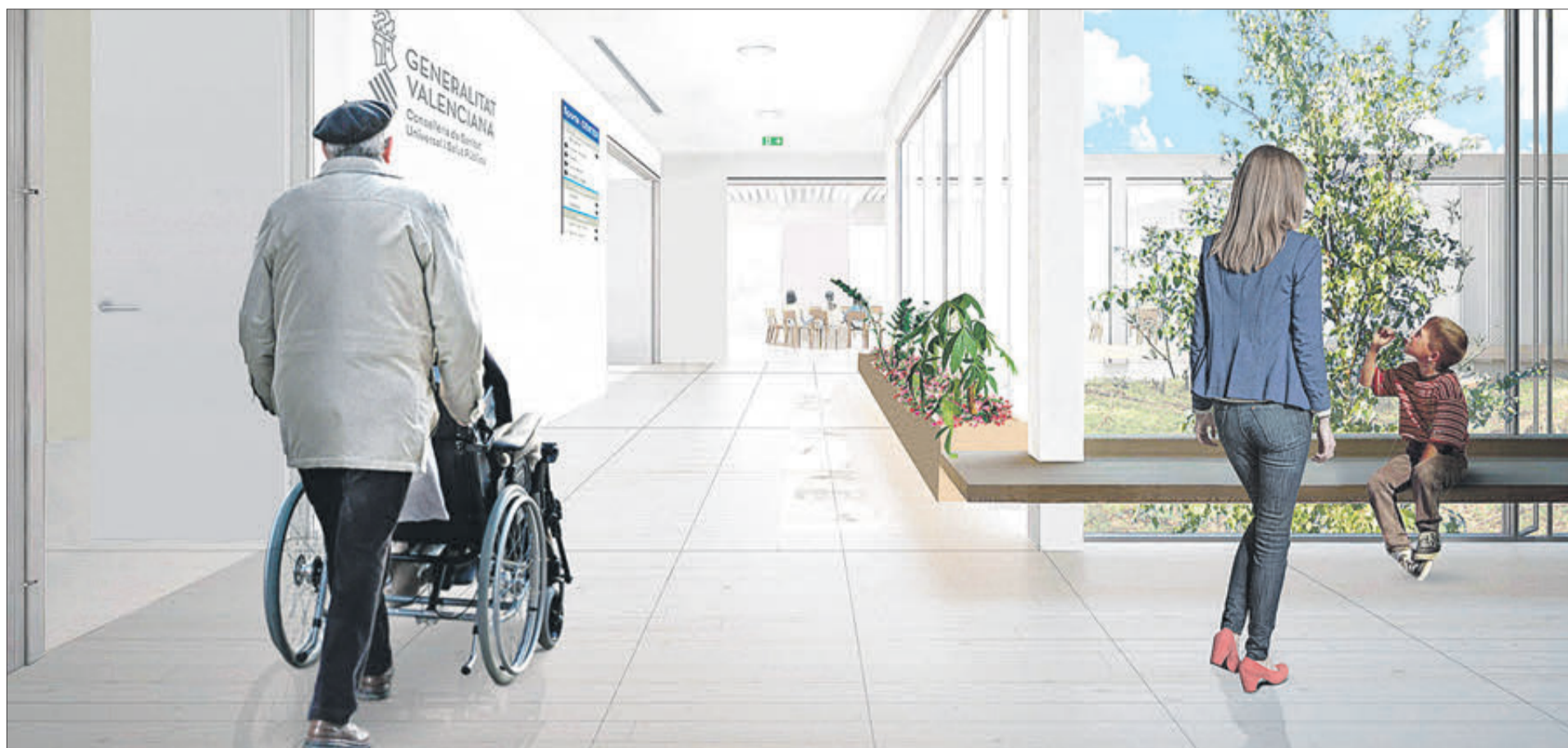
Recreació de com serà l'interior de l'edifici una vegada estiga construït.

S'HA APROVAT EL PROJECTE BÀSIC DE LA CONSTRUCCIÓ DE L'EDIFICI PER UN IMPORT DE 3,4 MILIONS D'EUROS