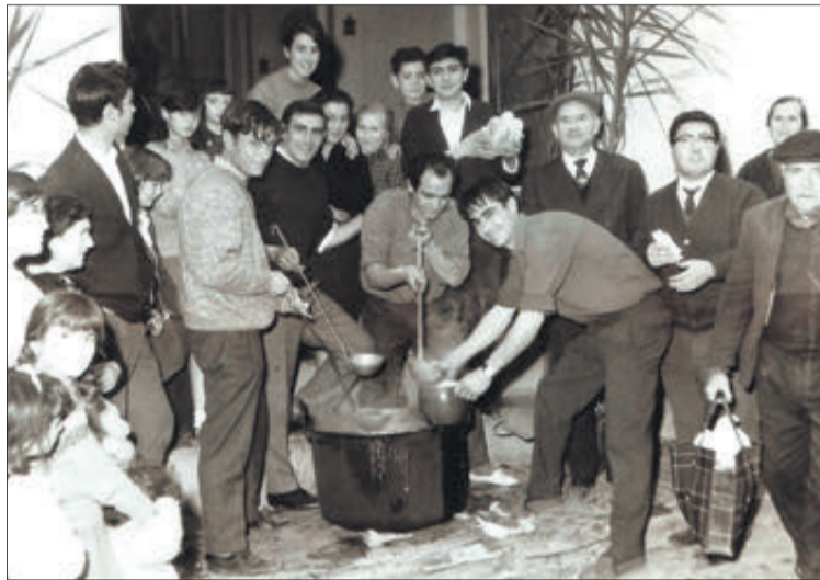
Imatge històrica de les Calderes, en l'ermita (1960)

Pel que sembla, cada any es va nomenar una comissió de festes que arrancaven les seues activitats demanant a domicili, modestes quantitats, per a