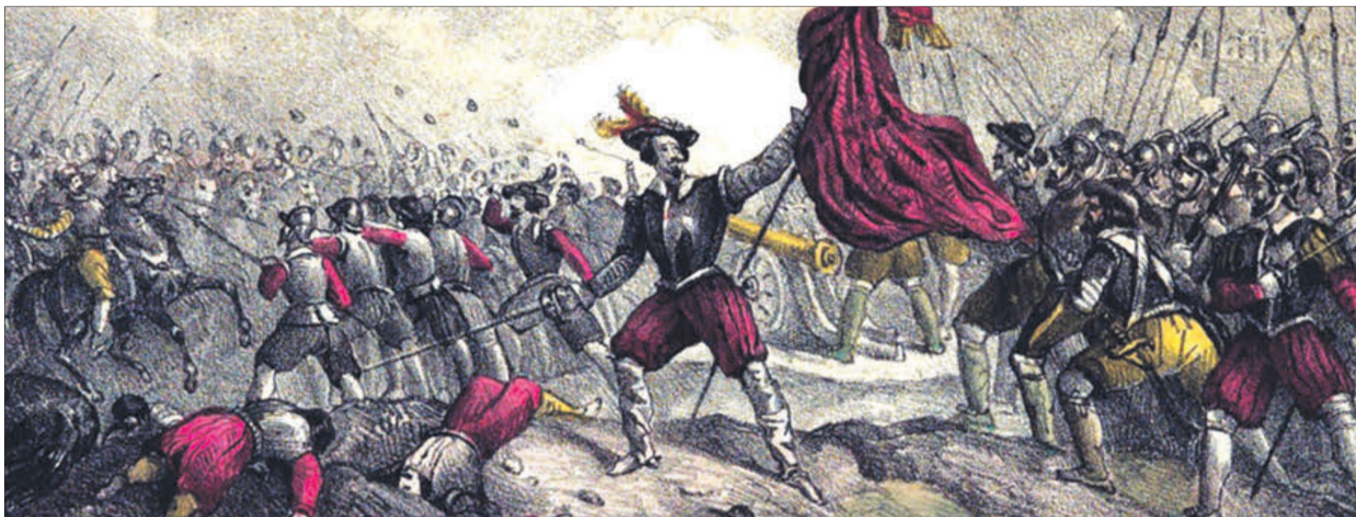
La Batalla del Vernissa

EL 25 DE JULIOL DE 1521, FA JUSTAMENT CINQ-CENTS ANYS, VA TENIR LLOC LA BATALLA DEL VERNISSA