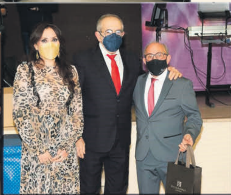
Festa de Santa Marta 2021