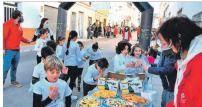
Corredors al seu pas per l'avaluament.