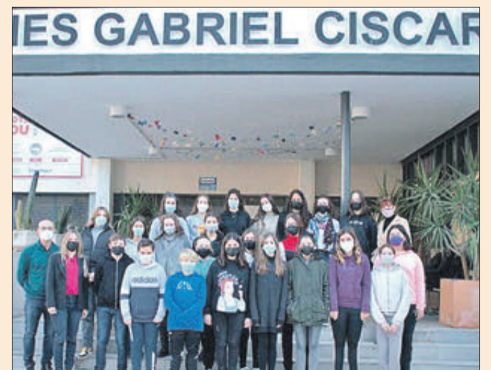
L'IES Gabriel Císcar d'Oliva va fer lliurament, amb la presència de la vicealcaldessa.