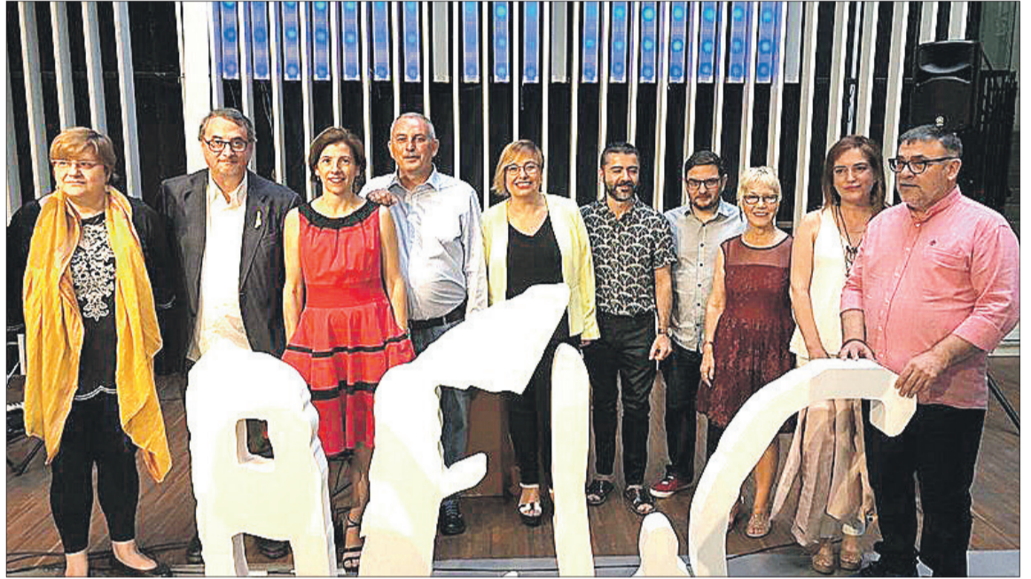
Entrega dels Premis de la Crítica dels Escriptors Valencians 2021.

Els premiats van rebre un diploma honorífic i una escultura de l'artista plàstic Jordi Albiñana, en l'acte oficial de deslliurament de premis que va tindre lloc en el Centre de Cultura Contemporània Octubre i que es va ajornar des d'el mes de juny passat a causa de la pandèmia del Coronavirus.