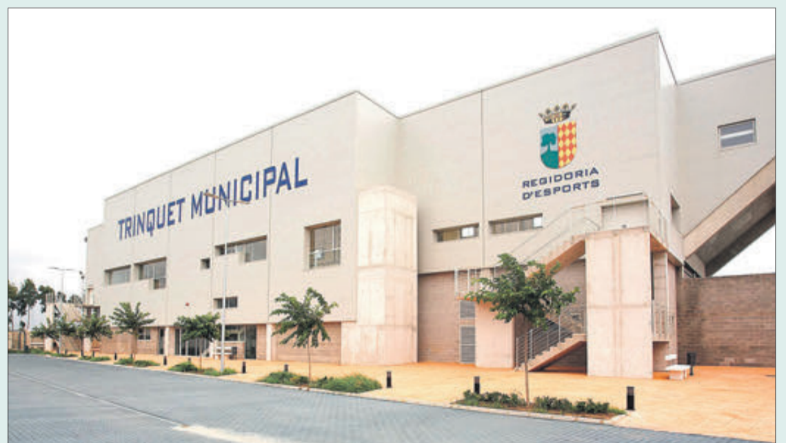
Instal·lacions esportives municipals.

Els esports que es promocionen estan dividits entre esports col·lectius: vòlei, bàsquet, handbol, futbol. I els esports recreatius/individuals: atletisme, pàdel, golf, natació, escacs,