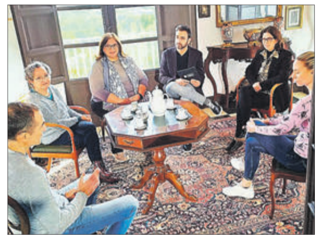
Rodatge de À Punt a l'Elca.