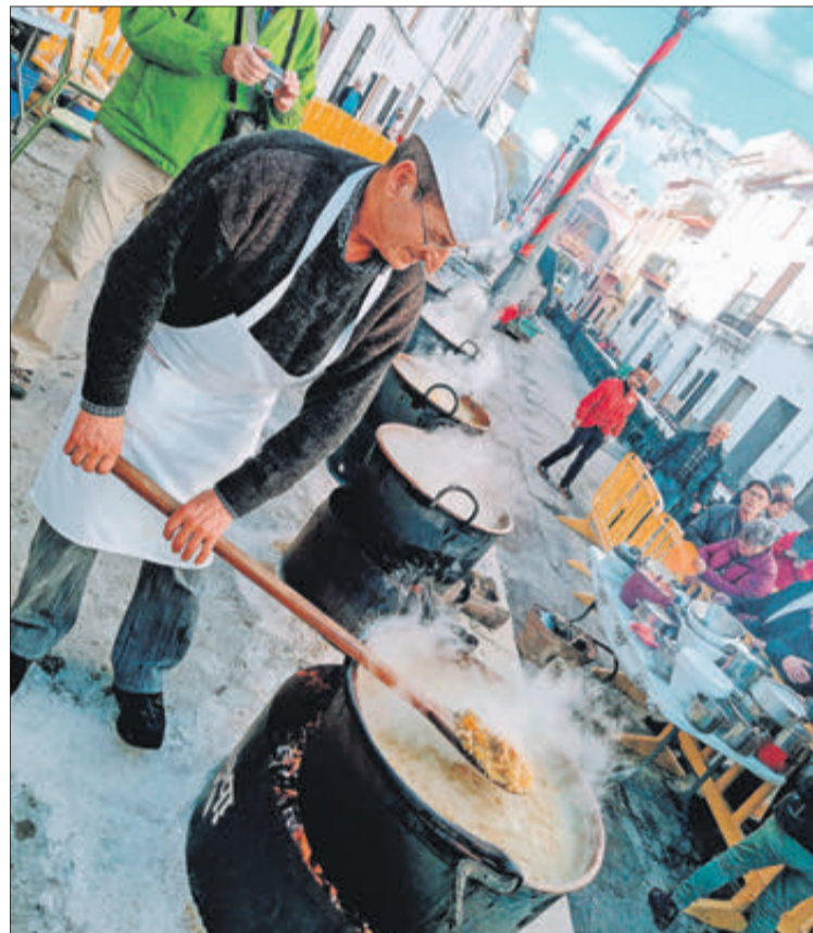
Moment de la cocció de les calderes.

l'elaboració de Les Calderes. Amb la deguda antelació, a més, se sacrificava a un porc, pel qual emulaven els carnisers de la barriada. I amb tots els productes rebuts es guisaven les creïlles amb els principals ingredients de la carn, les creïlles i l'arròs.