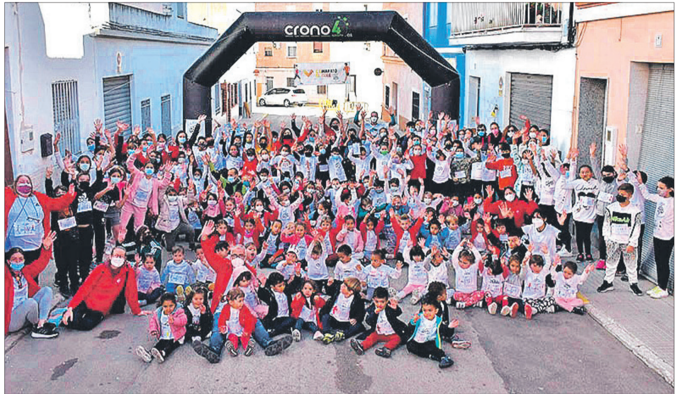
Participants en la prova disputada el 3 de desembre.

Aquesta extraordinària iniciativa completa la programació d'activitats que està duent endavant el centre escolar, ja que en la jornada de dijous, 2 de desembre, es van realitzar també uns tallers d'alimentació per tal de conscienciar a l'alumnat de la conveniència de tenir hàbits alimentaris saludables per a una millor qualitat de vida.