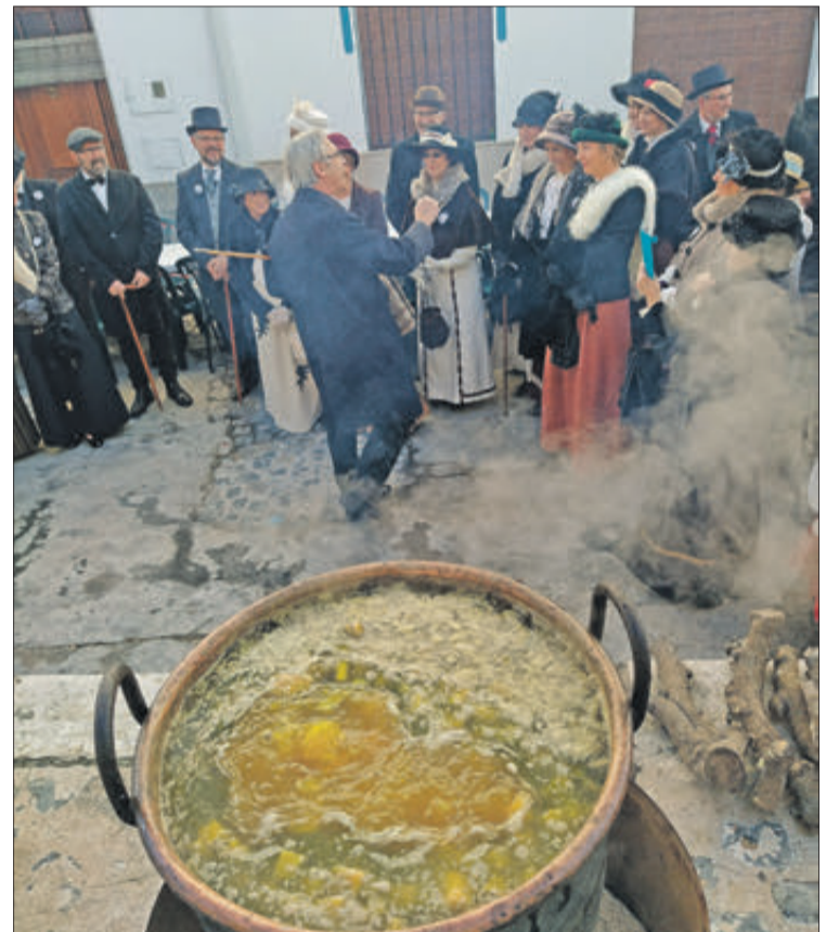
Calderes i vestits d'època.