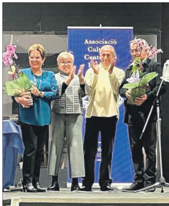
Un moment de l'homenatge.

el grup ecologista Samaruc, que es va fusionar amb Acció Ecologista-Agro.