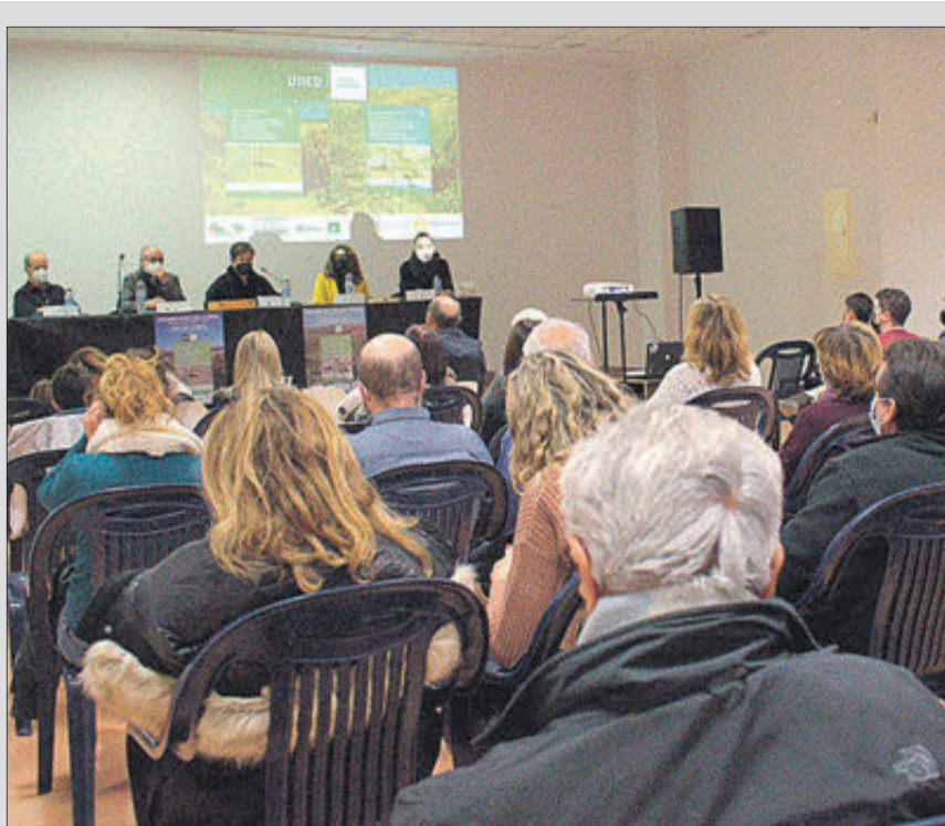
Un moment de la presentació del llibre.

RESIDENCIES TERCERA EDAD Residencia Sant Francesc ..... 96 296 36 36 Residencia Virgen del Rebollet ..... 96 285 00 52 Residencia La Carrasca ..... 96 285 80 81