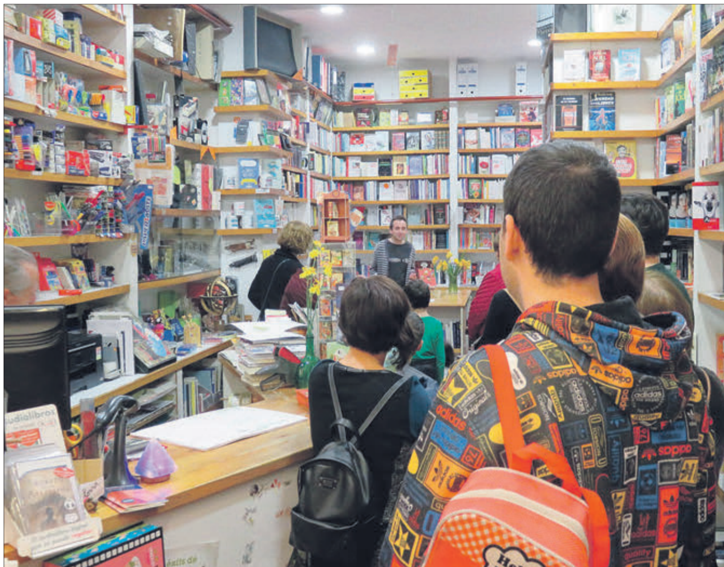
Un dels molts actes celebrats en La Fona.