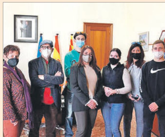
Els estudiants estan fent pràctiques a la ciutat.

L'IES Gabriel Ciscar, té l'acreditació ERASMUS+, amb un conveni amb centres de les poblacions franceses de Sisteron i Saint Germain en Laye i l'alemanya d'Ofenburg, per desenvolupar pràctiques del professorat i alumnat de formacions professionals.