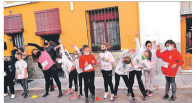
Escolars durant el calentament previ a la carrera.