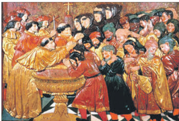
Bateig de mudèjars Felipe Bigarny, ca. 1521, Capella Reial de Granada.

A mitjan juliol de 1521, Peris va sotmetre militarment el castell de Xàtiva i, tot seguit, fixà el seu objectiu a la Safor, on restava el virrei, el comte de Mèlito. El duc de Gandia, Joan de Borja, i el comte d'Oliva, Serafí de Cen-