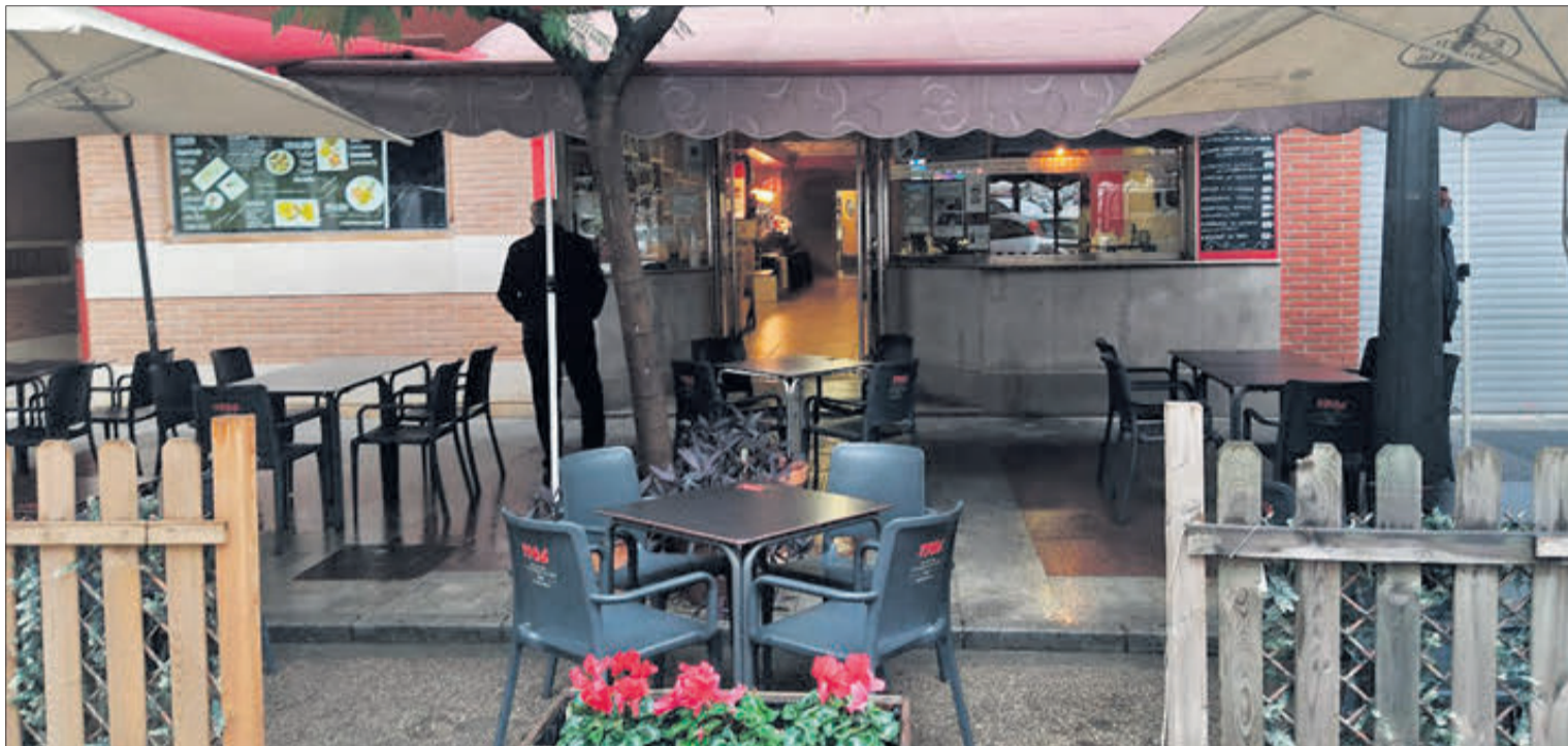
Terrassa d'un establiment hostaler de la ciutat.

La promoció arrancava el passat diumenge 6 de desembre, incloent així el Pont de la Constitució, i es prolongarà fins el proper dimecres 22 de desembre, període en el qual estaran a la venda els 2.000 gastroxecs a la disposició de veïns i visitants.