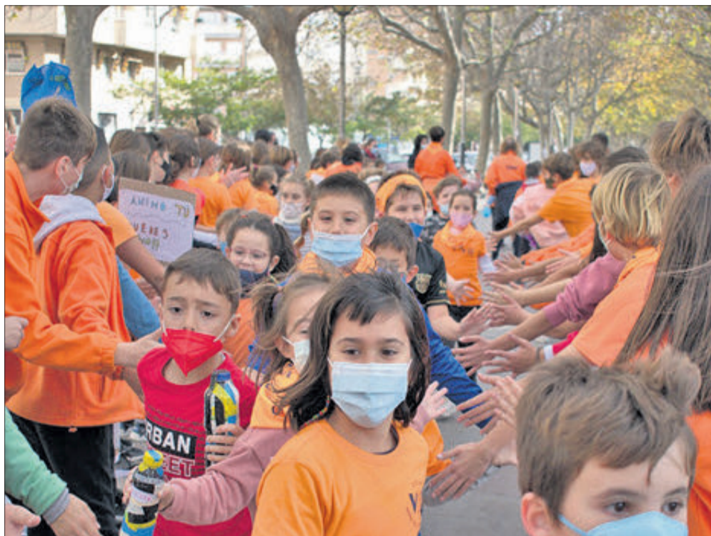
Imatge de la Marató del CEIP Verge dels Desemparats.