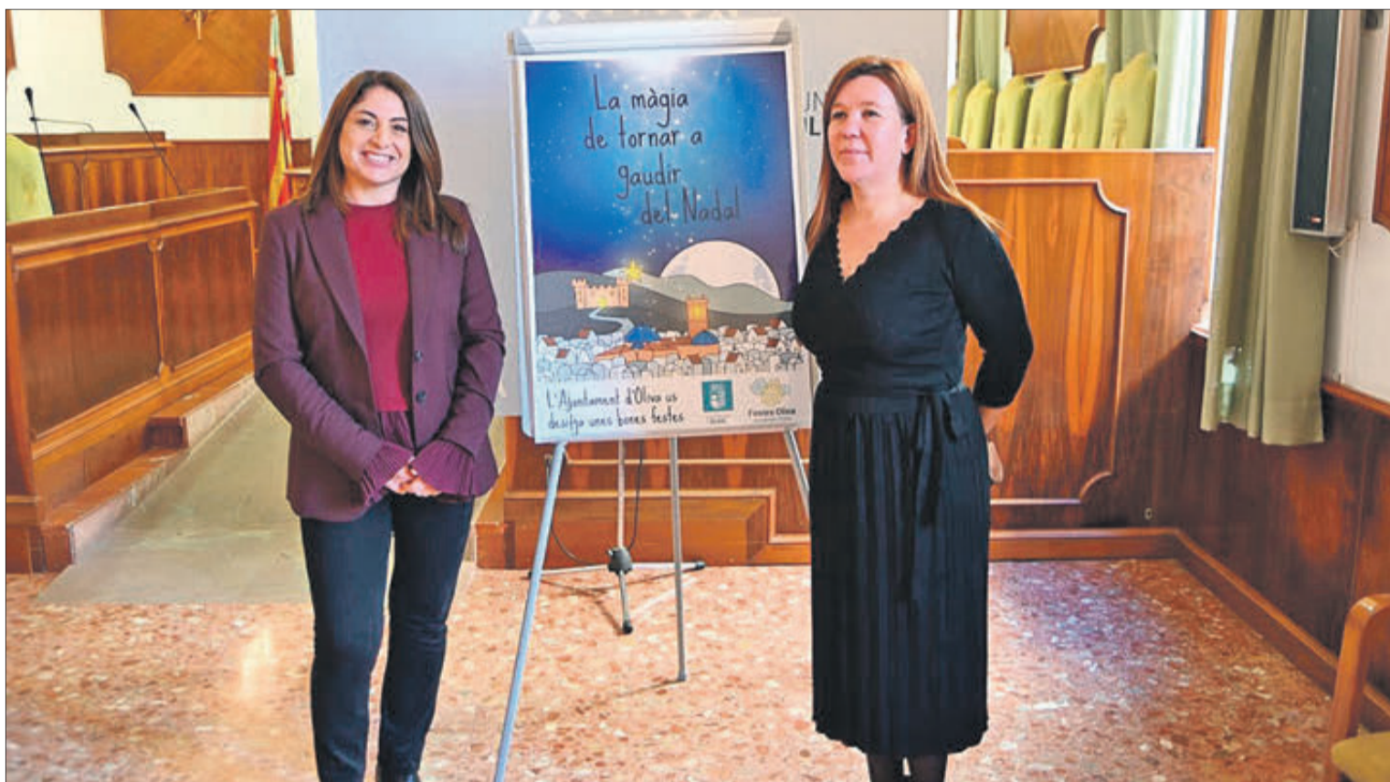
Moment de la presentació dels actes per a celebrar el Nadal.

Des del Departament d'Educació també han organitzat el tradicional Nadaltubes, el concert de tubes del Conservatori d'Oliva, que tindrà lloc el dia 20 a les 18 hores, al Parc de l'Estació. I des de la Regidoria de Joventut, el tradicional Certamen de cartes i dibuixos als Reis Mags, que faran el lliurament de premis el dia 29 de desembre a les 18.30 hores