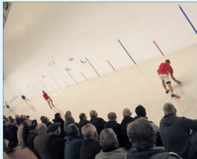
Partida de pilota al trinquet d'Oliva.

El Club de Pilota Oliva participa un any més en aquesta important competició amb diversos equips, que suposen la pràctica de l'esport autòcton dels valencians, on la nostra ciutat és una de les que més figures han donat a la història en la modalitat del raspall.