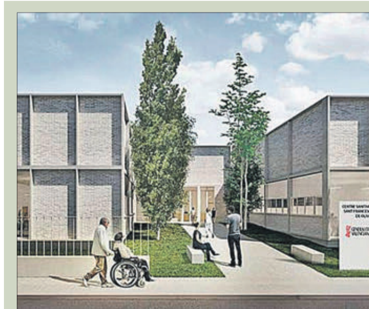
Imatge virtual del projecte.

L'accés a l'edifici es produirà per planta baixa a través d'una rampa per un dels espais que queda entre les pintes simètriques que conformen la planta en forma de "espina". Els diferents espais de l'edifici s'organitzen com adherits a l'eix principal, però deixant buit entre ells de tal forma que queden separats per pastilles intercalades amb espais verds oberts que permetran la ventilació creuada dels espais així com l'aportació de llum natural en totes les sales de consultes i altres estades requerides. Tot això permet una relació visual dels usuaris amb el cel i l'arbratge exterior, la qual cosa humanitza els espais i fa que l'edifici se senta com un ens ple de vida.