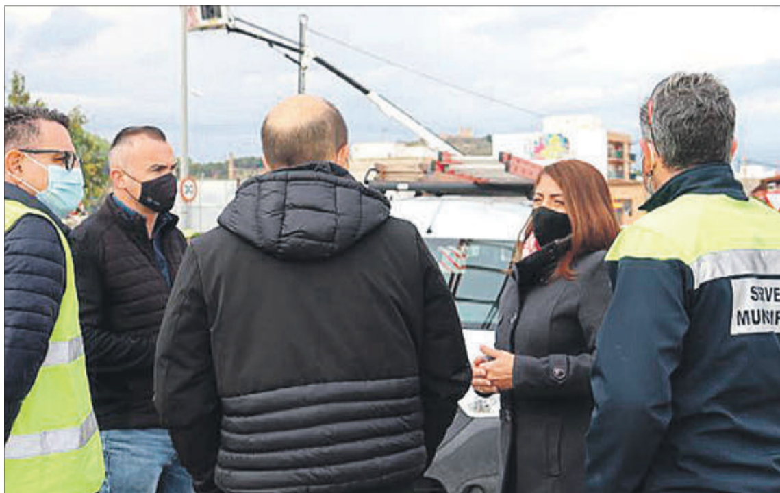
El regidor d'Obres i Serveis i l'alcaldessa han seguit aquestes actuacions en el polígon El Brosquil.