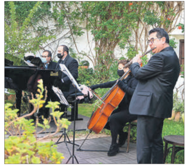
Estrena de la peça Maese Brines.