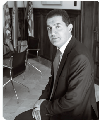
Toni Francés. Alcalde d'Alcoi

Des d'aquestes línies vull agrair l'incansable treball de tots els que han fet possible que puguem retrobar-nos en aquesta celebració. No ha sigut una tasca fàcil, però l'entusiasme i el bon fer d'entitats, particulars i de la Regidoria de Turisme ha permés poder disposar d'un programa que ens permet recobrar la il·lusió que, des del primer moment, ha acompanyat aquesta celebració.