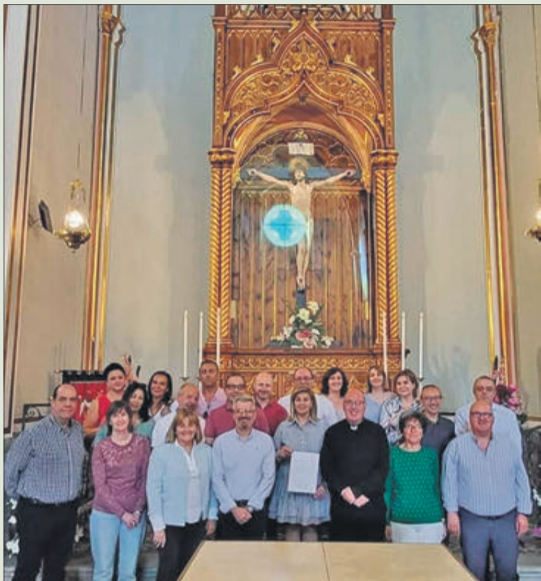
Integrants de la confraria davant l'altar del Sant Crist.

La confraria del Santíssim Crist de l'Agonia es va reunir el 10 de juny per a tractar l'aprovació dels estatuts de la institució. D'aquesta manera s'uneix a iniciatives similars empreses per altres confraries locals per a comptar amb el document en el qual es regulen les disposicions i clàusules que defineixen l'estructura, funcionament i objectius, entre altres aspectes, de l'entitat, i poder regularitzar la seua entitat jurídica amb independència de la parròquia.