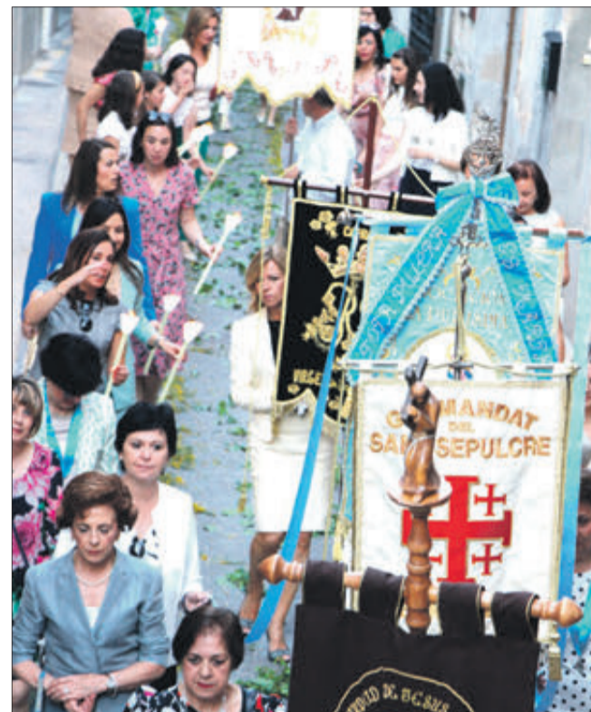
Estendards i representants de les diferents confraries.