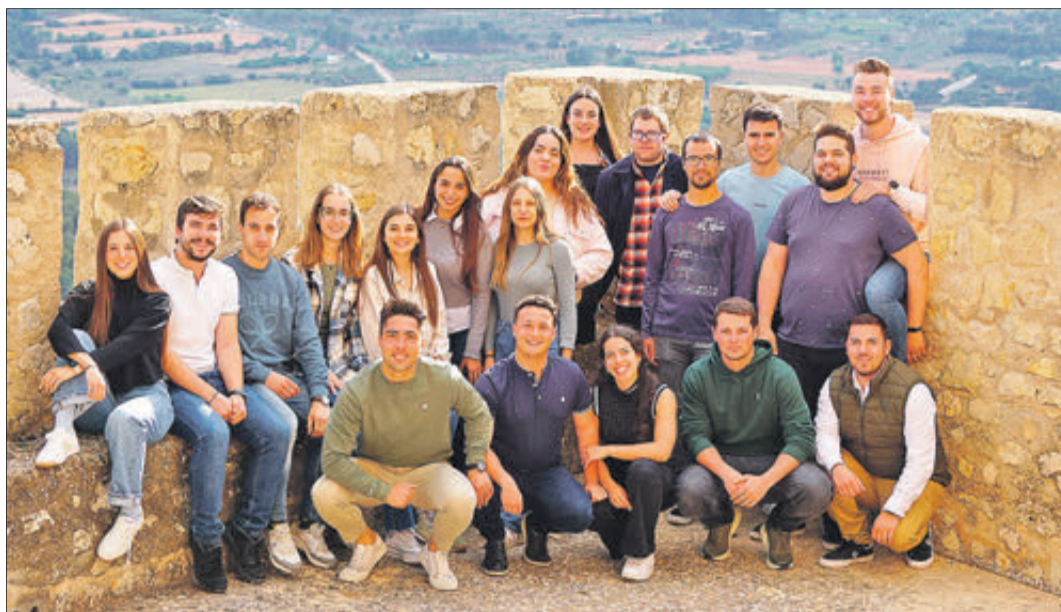
La Comissió de Festes de la Malena.

La portada està dissenyada per María Castelló.