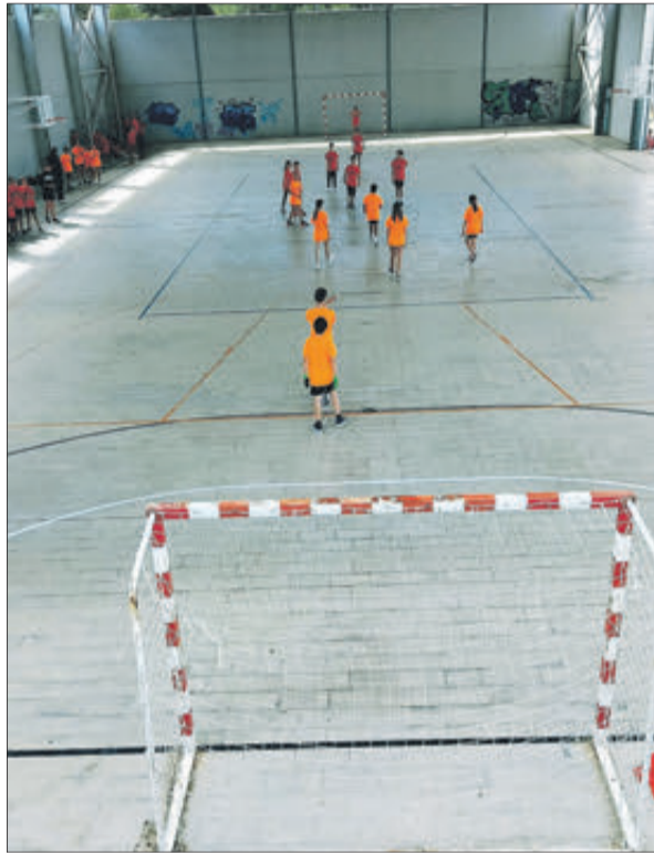
Disputa d'un partit de futbol.

L'ordre de guanyadors per cursos va ser el següent: 3r de Primària: Los Relámpagos, El Equipo Rayo, Los Capibara i Marvel Futbolísimos. 4t de Primària: Titanes, FBI i Los Invencibles. 5è de Primària: Team Capybara, Pio Pio, UD Bananitos i Coco Locos. 1 6è de Primària: 1r Los Sin Nombre, Mini Emilios, Los Óscar i Los 11.2.0.