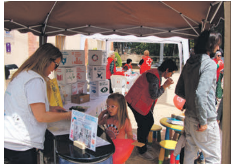
Informació turística i de desenvolupament sostenible.