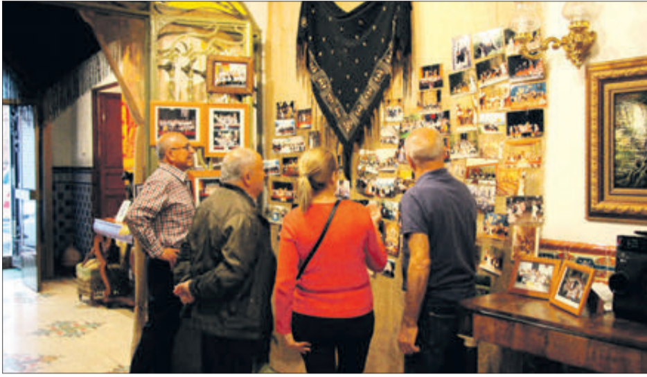
La Fundació Valor va obrir els portes per a mostrar l'exposició.