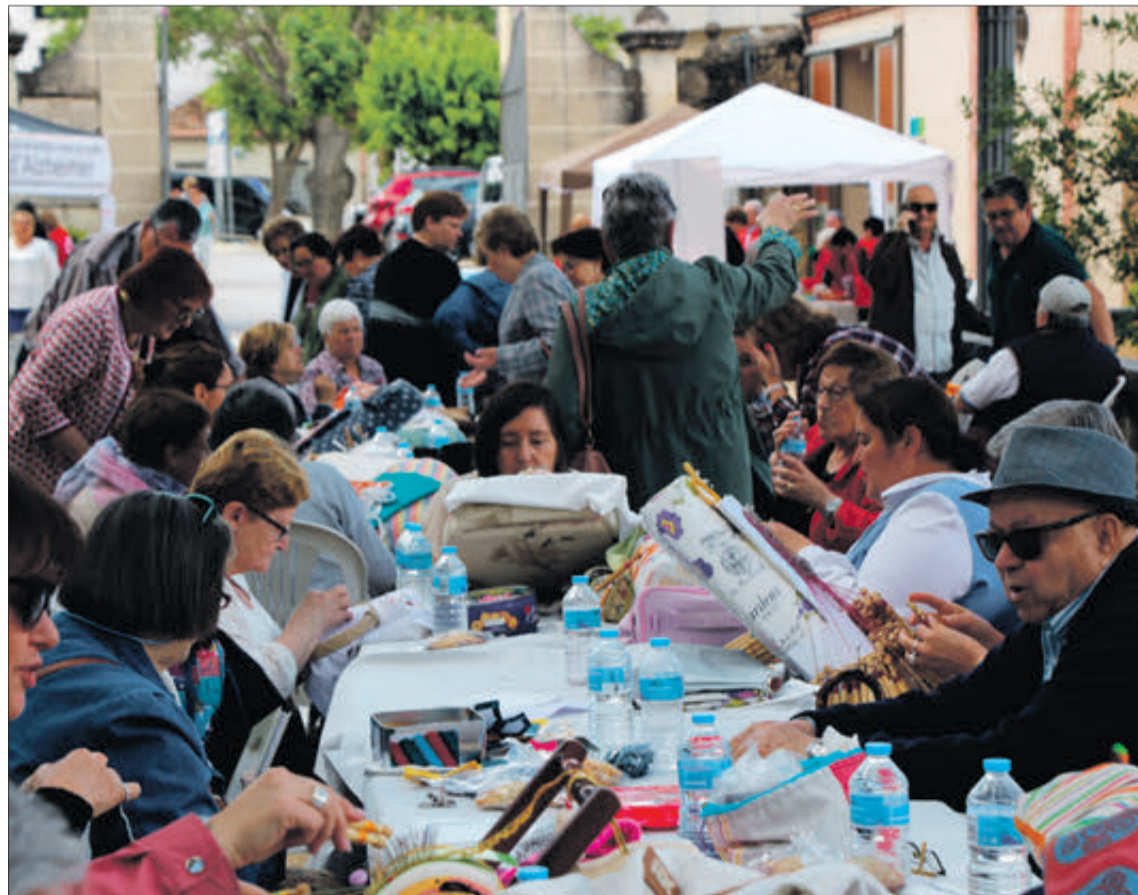
Encontre de boixets.