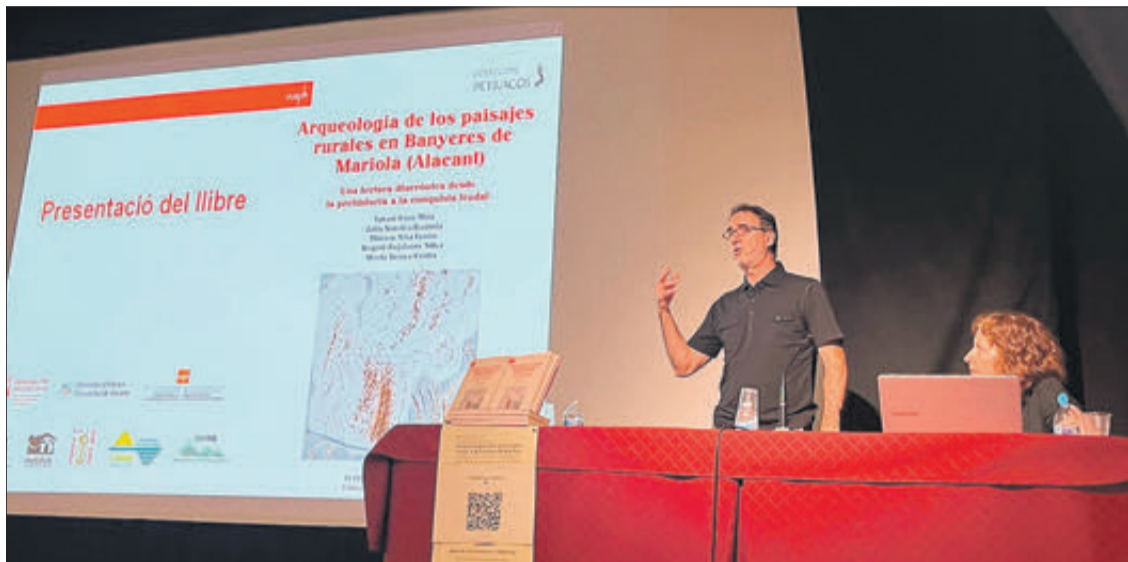
Moment de la presentació del llibre a la Casa de Cultura.