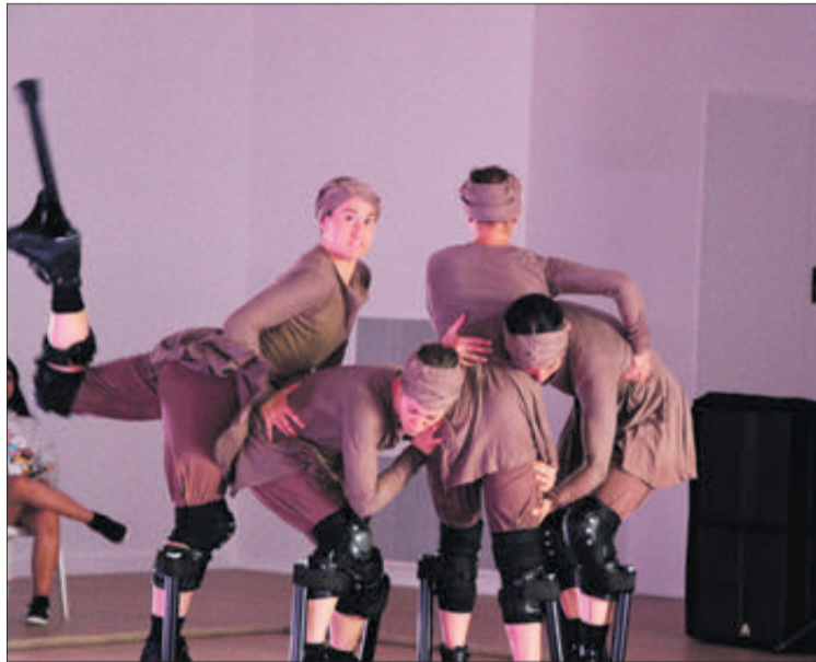
Espectacle 'Migrare' a l'interior del Cine Mariola.