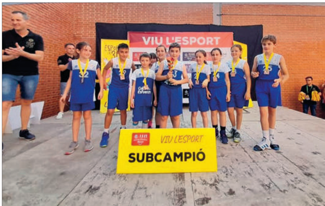
L'equip benjamí després de rebre el trofeu acreditatiu.

Després de la disputa del trofeu, socis i simpatitzants de la Penya Atlètica es van reunir en la seu del carrer València per a celebrar un dinar de germanor.