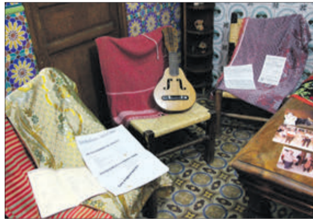
Instruments, cartells i programes d'actuacions.