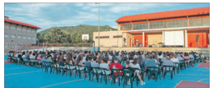
Cloenda de 2n de BAT de l'IES.