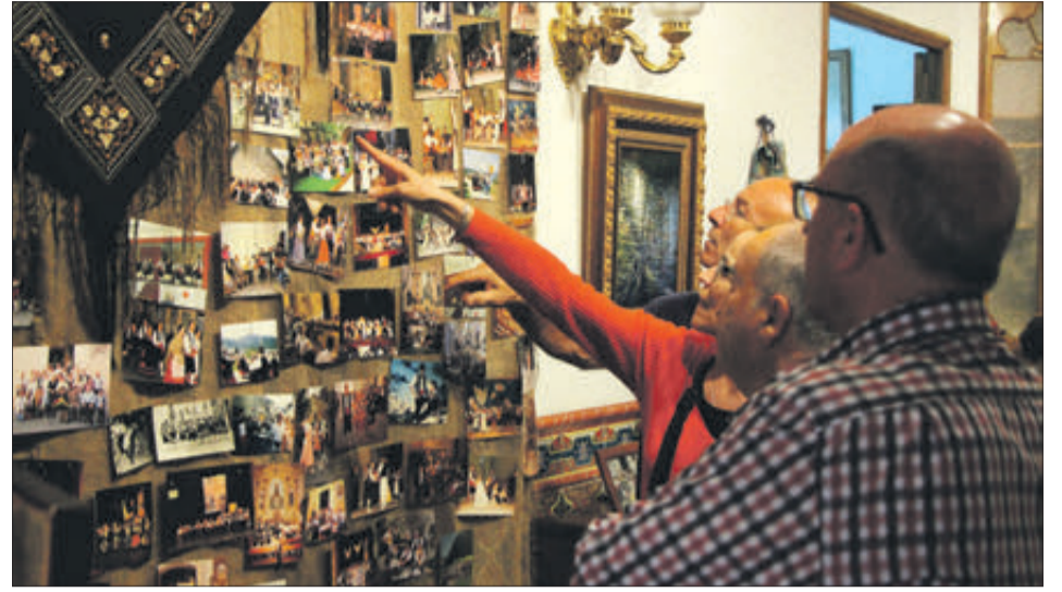
Fotografies i multitud d'articles han format la mostra.