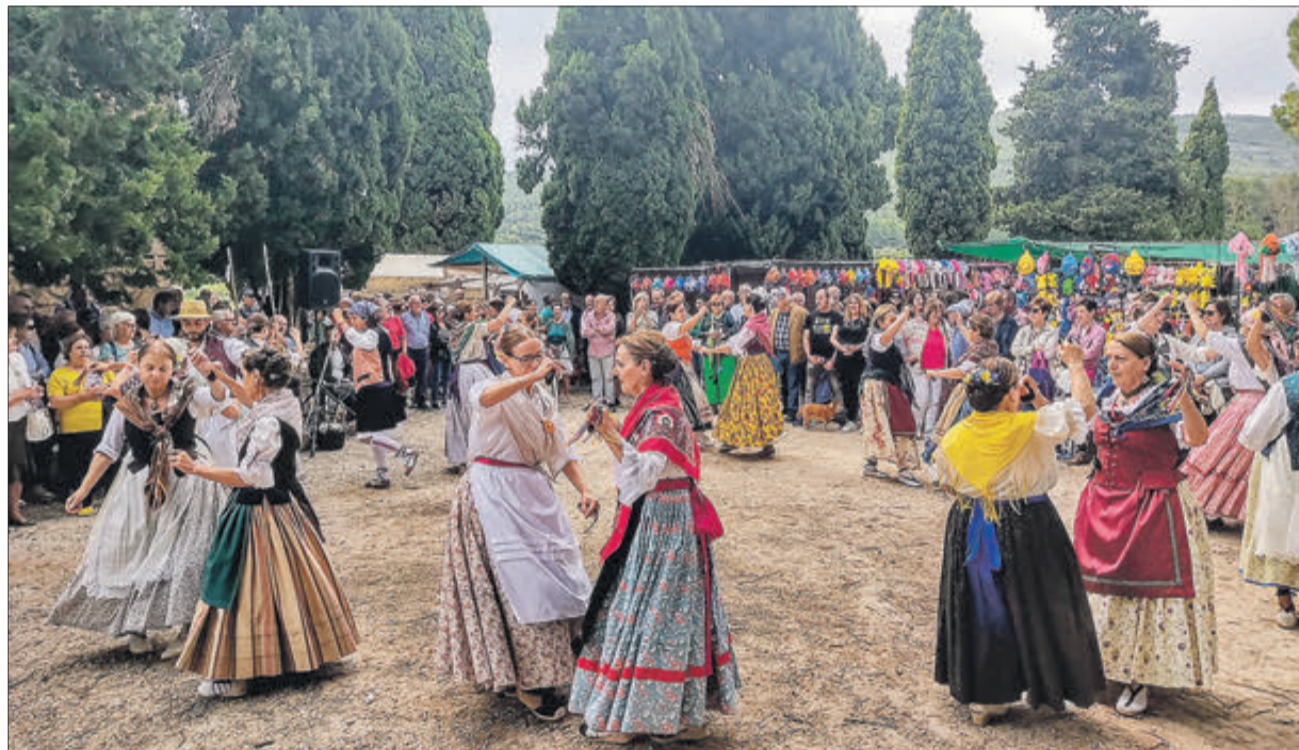
Actuació del Taller de Danses del Casal.