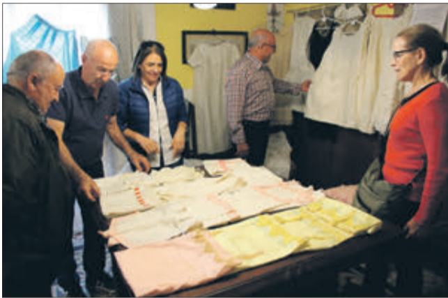
Vestimentes tradicionals que van marcar una altra època