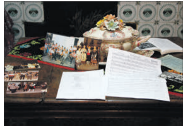
Partitures de cançons, detalls i imatges d'altres temps.

DINS DEL 40 ANIVERSARI DEL GRUP DE DANSES AIRES DE MARIOLA