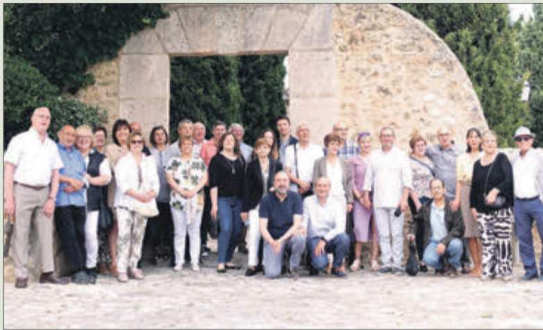
La junta de la Confraria 1994-1998 va erigir els locals parroquials.