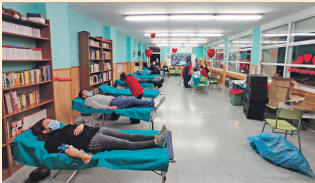
Donació de sang en les instal·lacions del col·legi Fundació Ribera.