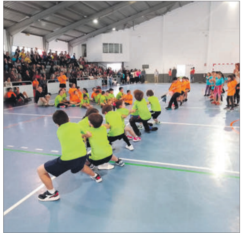
Competició d'estira de corda.