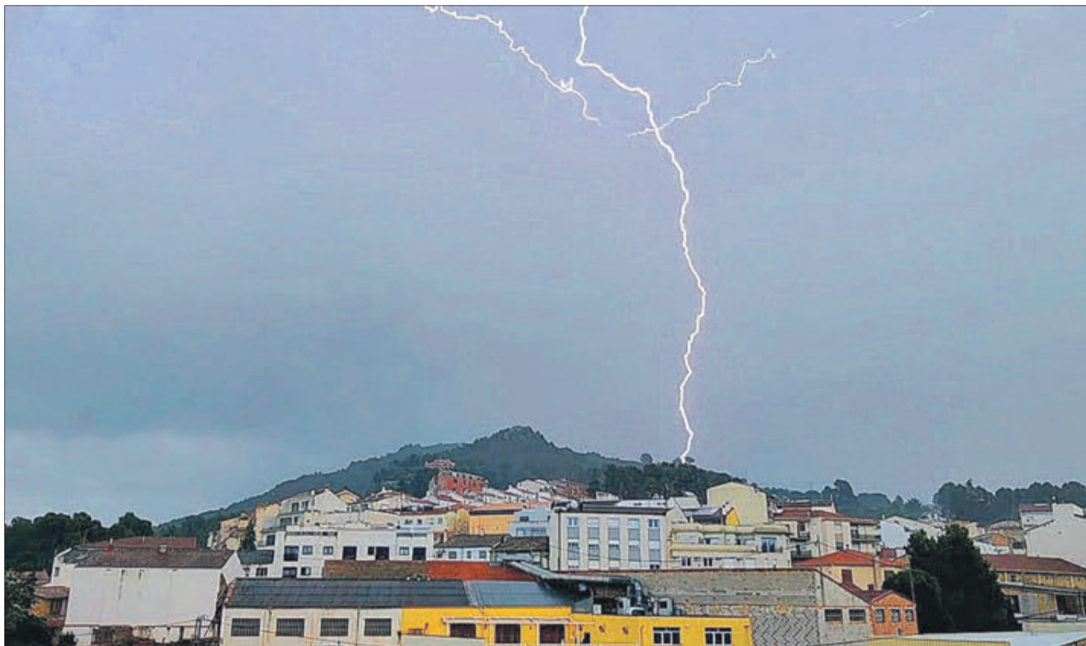
Espectacular imatge d'un llamp registrada el 3 de juny.

L'Ajuntament ha posat en marxa un servei d'obtenció d'informes meteorològics que realitza l'empresa Inforatge i que poden ser utilitzats pels ciutadans. Aquest servei és útil quan, per exemple, es necessita comptar amb algun document acreditatiu per a justificar davant la companyia d'assegurances els danys que haja pogut causar una tempesta elèctrica. El document pot ser descarregat per l'interessat o, en el cas que no es dispose d'impresora, obtenir-lo directament en les oficines municipals. El servei ha començat a funcionar amb motiu de l'episodi de descàrregues elèctriques que es va produir en la tempesta del 3 de juny i que va causar importants danys elèctrics en diferents punts de la població.