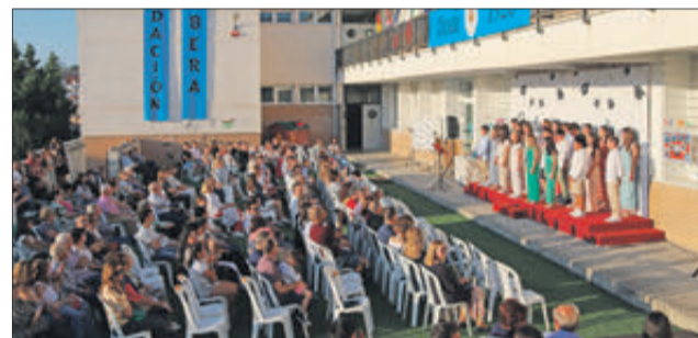
Acte dels alumnes de 6é de Primària en la Fundació Ribera.