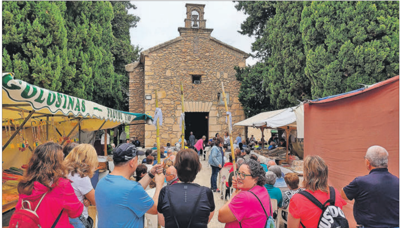
Molts banyerins van acudir a Sant Antoni.

El diumenge a les 8 del matí es va fer un volteig de campanes i a les 9:30 la missa solemne en honor de Sant Antoni de Pàdua i en sufragi dels Majorals difunts. Tot es va fer en el context d'una fira cada volta més reduïda que es va instal·lar a l'esplanada de l'ermita.