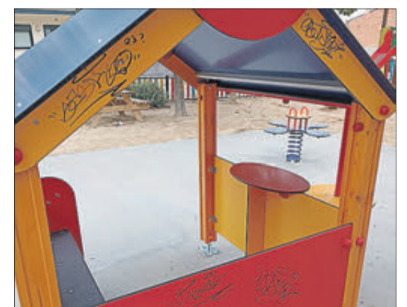
Pintades en jocs infantils.

RESTAURAR ELS MALS PROVOCATS COSTA DINERS A TOTS ELS VEÏNS