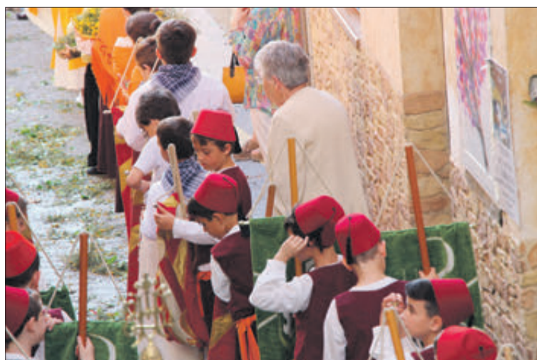
Xiquets encarnant personatges del Corpus.