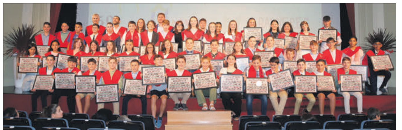
Entrega de beques i orles als alumnes de 6é de l'Alfonso Iniesta