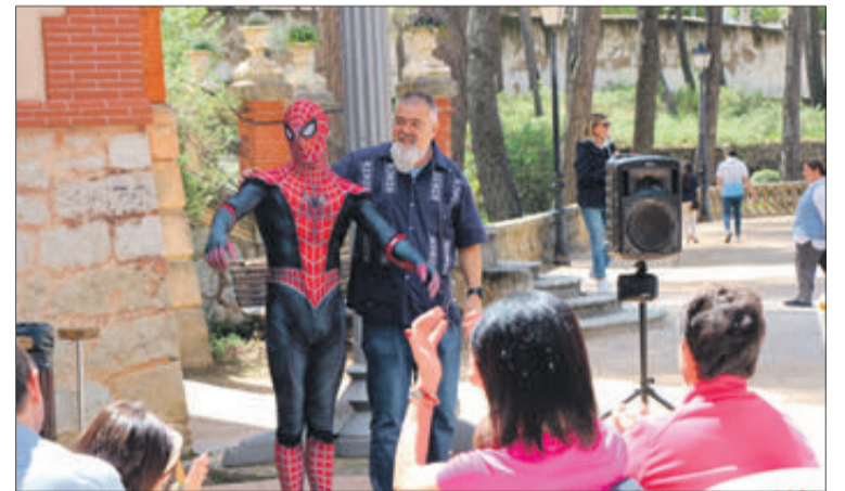
Activitat de contacontes al costat del Museu del Paper.