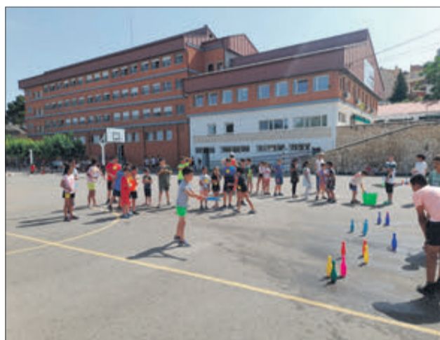
Jocs i activitats en el pati de l'Alfonso Iniesta.