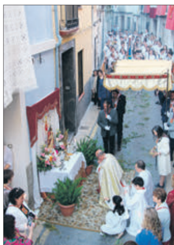
El Santíssim en un altar.