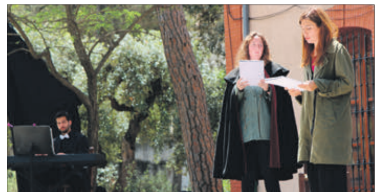
Lectura dramatitzada de la rondalla 'Abella'.