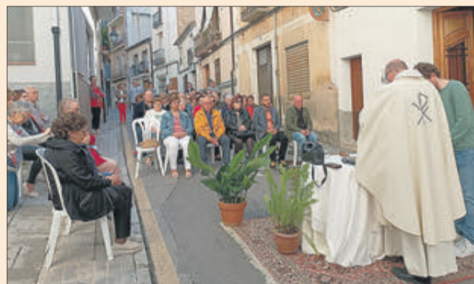
L'eucaristia es va fer al carrer Nou.

El cap de setmana precedent al de la celebració del Corpus Christi es van reunir els veïns del carrer Nou per a organitzar-se amb la idea d'anar preparant aquesta efemèride, ja que aquest carrer és un dels que es decora amb motiu del pas de la processó d'eixe dia. Entre les activitats que van fer va estar la de fer una missa de campanya al carrer.