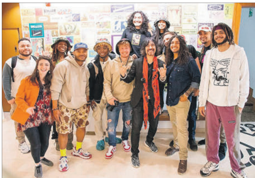
El grup al complet en el Museu Valencià del Paper