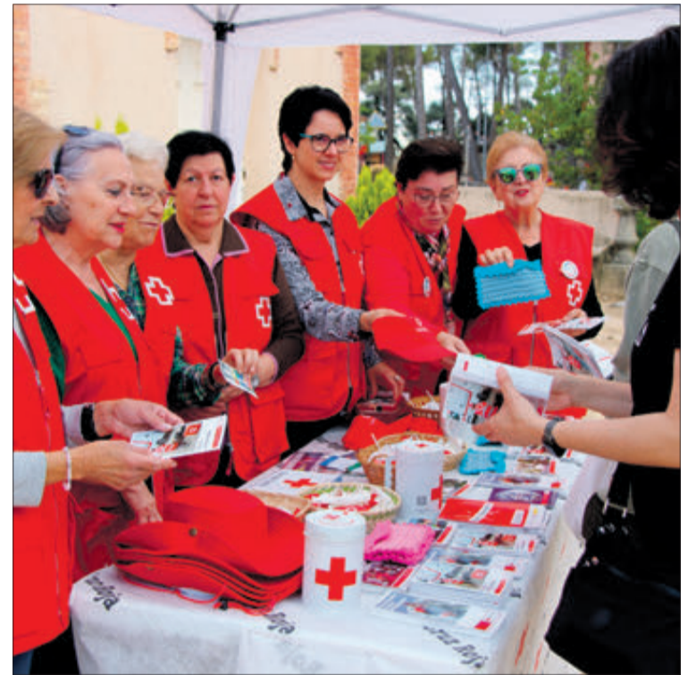
Estand de l'Assemblea Local de Creu Roja.