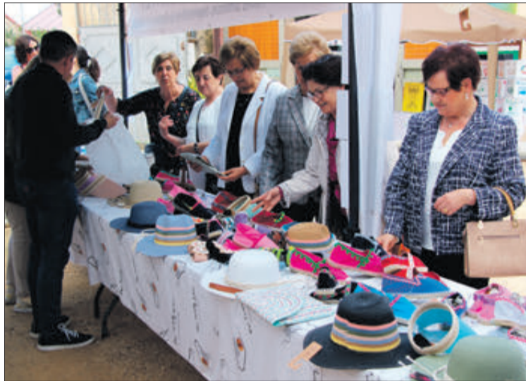
Punt instal·lat per l'Associació d'Alzheimer.