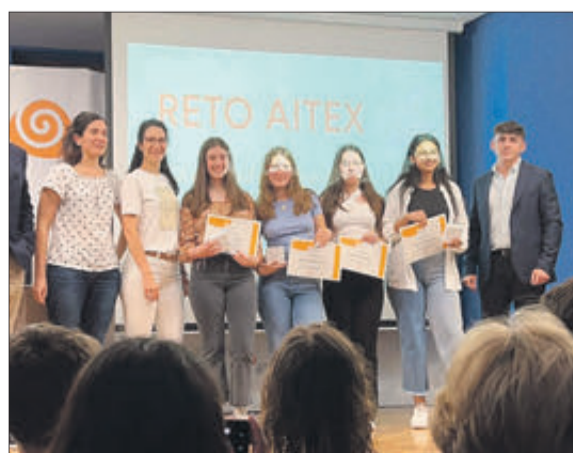
Equip premiat amb el 4t accèssit Repte Aitex.