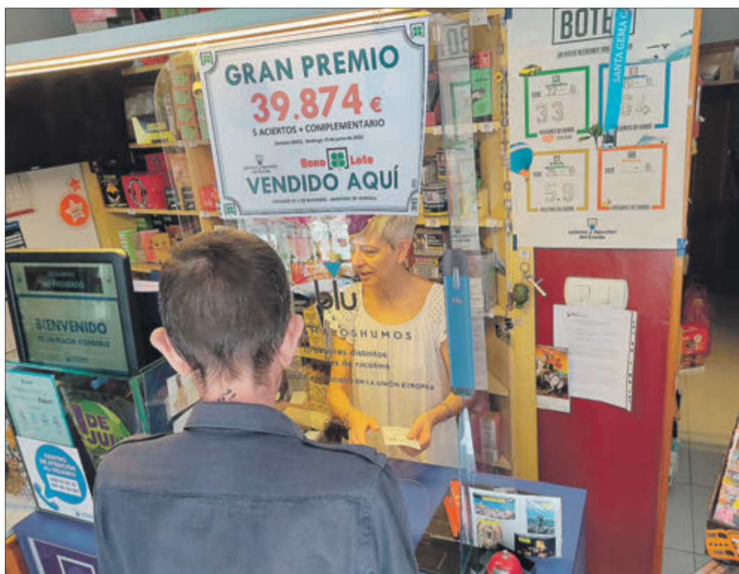
L'estanc núm. 1 ha registrat la Bono Loto premiada.