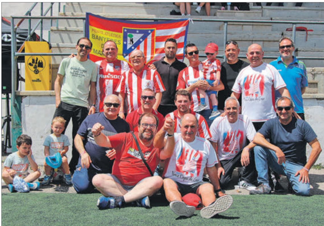
Membres de la Penya Atlètica, organitzadora del torneig.