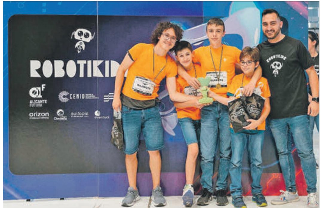
Els quatre joves van aconseguir el primer premi.

DISPUTADA EN EL CENTRE DE TECNIFICACIÓ D'ALACANT