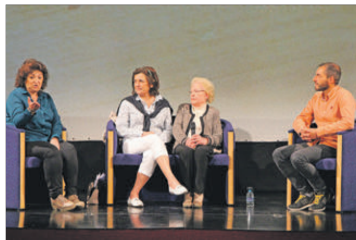
Després de la projecció es va fer una tertúlia.