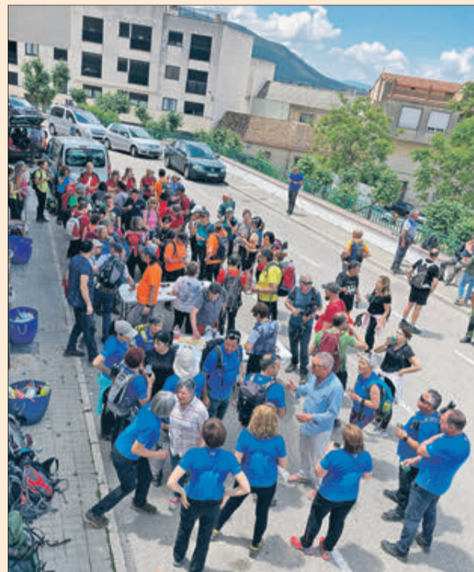
L'organització va oferir un refrigeri als participants.

El dia 4 de juny el Centre Excursionista Penya Roja va organitzar la tradicional "Marxa Intercomarcal" que va transcórrer per un itinerari a través de la Serra Mariola i part del traçat del riu Vinalopó. L'excursió va començar en la seu del Moto club en direcció de la Font del Cavaller fins prop del Camp de Tir. Des d'ací es va pujar fins al Pla de l'Ànima per a dirigir-se després cap als pous d'aigua de Bocairent i prendre la senda que entra pel congost on està la part més alta del riu. Després de passar per la Font dels Brulls es va arribar fins a la Font de la Coveta i més tard a Blanes. Des d'ací es va continuar fins a Galbis i, després de passar per la Font de la Mallaeta, es va tornar al punt de partida seguint l'itinerari del camí de la Mallaeta.