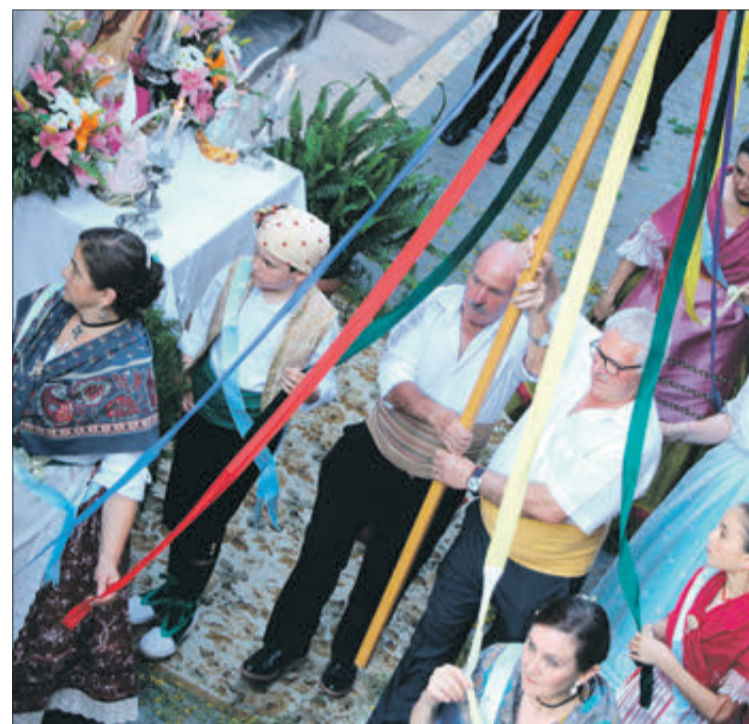
El grup de dances va obrir l'itinerari de la processó.