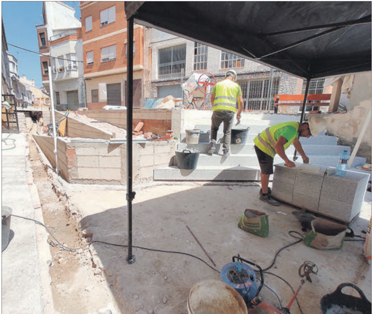
L'obra reduirà la barrera arquitectònica que implica l'actual escalinata.

L'Associació de familiars i amics de malalts d'Alzheimer i altres demències degeneratives de Banyeres de Mariola ha anunciat la celebració de l'assemblea general ordinària el dia 30 de juny. Serà en la seu social situada al carrer Doctor Fleming n. 39, baix, amb el següent ordre del dia: lectura i aprovació, si escau, de l'acta de la passió anterior; altes i baixes; informe de comptes i pressupostos; informe del president; i precís i preguntes.