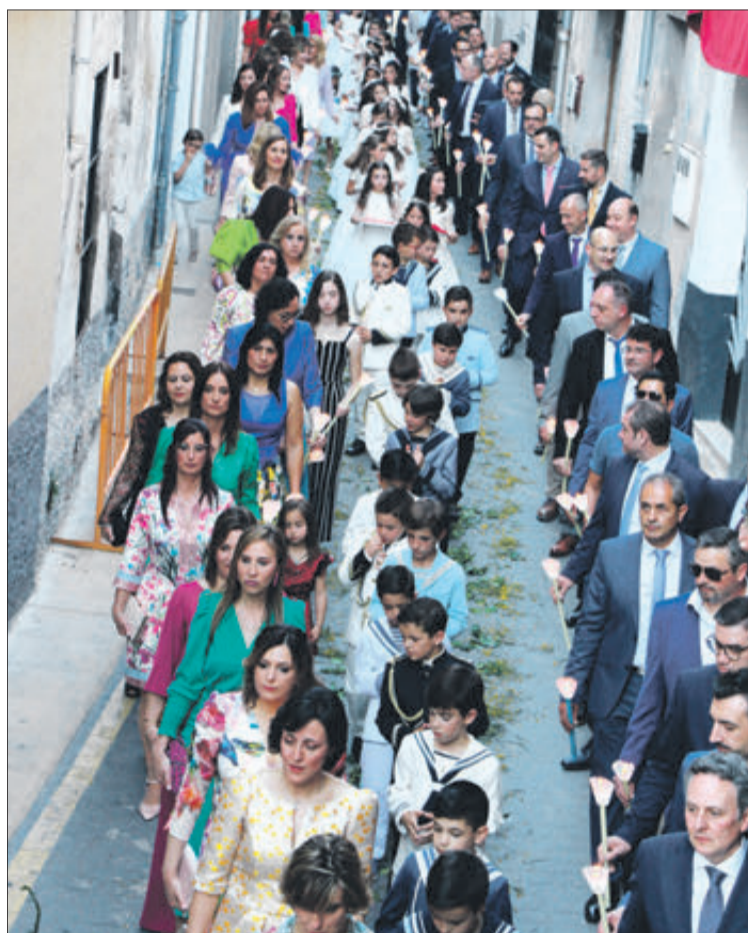
Xiquets i xiquetes de primera comunió amb les seues mares i pares.

A la vesprada es va celebrar la processó a través del recorregut habitual pels carrers ornamentats pels veïns i aromatitzats amb flors i herbes aromàtiques de la serra. En ella van participar personal de les dances, músics amb dolçaina i tamboret, fidels amb veles, estendards i representants de les diferents confraries, els xiquets i xiquetes de Primera Comunió acompanyats de les seues mares i pares, catequistes i representants de Càritas, els diferents personatges característics del Corpus encarnats en la figura de cavallets, llauradors, arquets i morets, la confraria del Cor de Jesús, el pal·li amb el Santíssim, les autoritats i l'acompanyament musical de la banda de música, que en aquesta ocasió va realitzar l'Agrupació Musical la Nova.