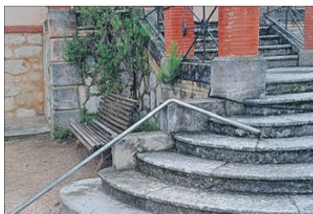
Desperfectes en l'accés al Museu Valencià del Paper.

escalons existents. Els treballs permetran millorar l'accés a persones amb discapacitat, persones majors, carrets de xiquets, etc. El pressupost base de licitació dels treballs ascendeix a 44.410,04 euros.