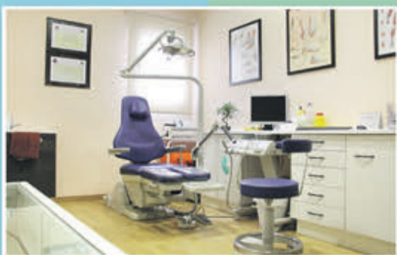
Cites de podologia Tf 660335448

costat els egos personals i partidistes i des de la perspectiva de fer les coses bé. Va considerar que al poble, més que mirar la política, el que es mira és la cara de les persones que dediquen el seu esforç per a millorar la vida dels veïns. Va concloure oferint el seu suport per al qual es necessita i demanant que es pugui treballar per Banyeres tenint en compte totes les opinions.