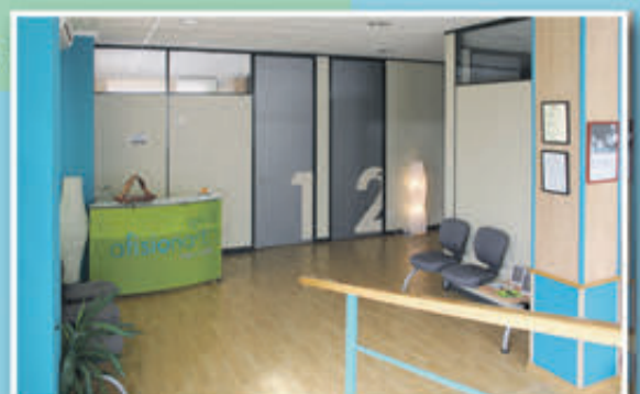
Cites de fisioteràpia Tf 695692689

Avda. Ramón y Cajal, 30, Banyeres de Mariola (Alacant)