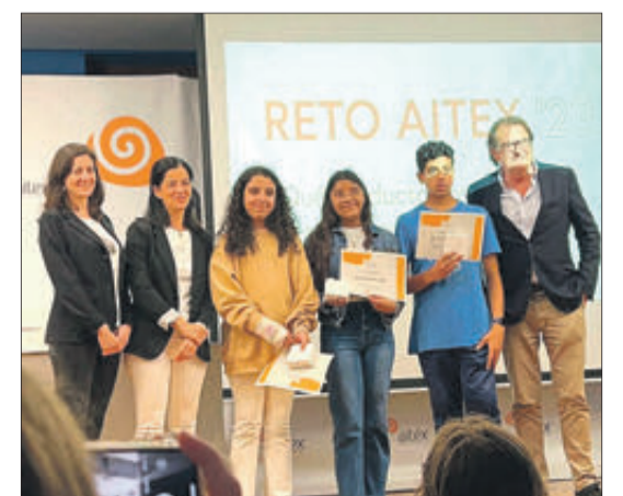
Equip premiat amb el 5é accèssit Repte Aitex.