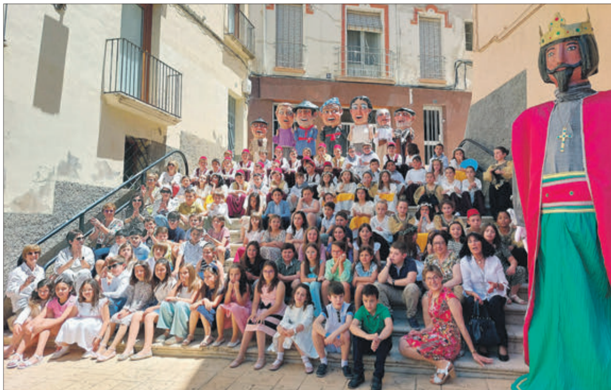
Xiquets, xiquetes i catequistes amb els nanos i gegants de la Fundació Ribera.