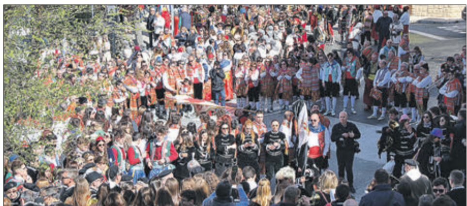
El "Barranc Fondo" replet de festers.