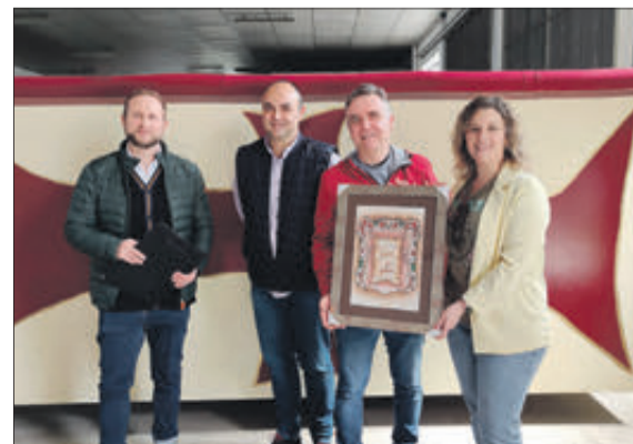
Concurs de carrosses: 2n Jordians.