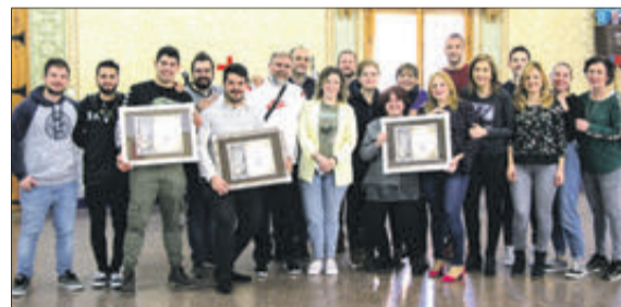
Guanyadors 2022 fanals: Cristians, Maseros i Moros Vells