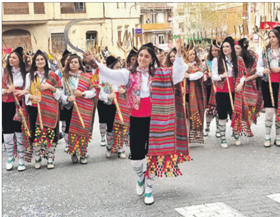
Esquadra de Maseres.