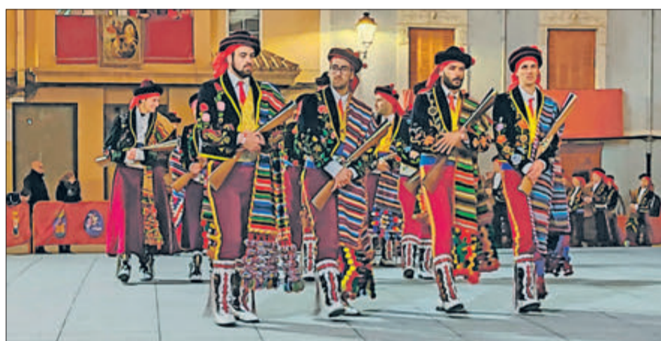
Festers arribant a la plaça Major.