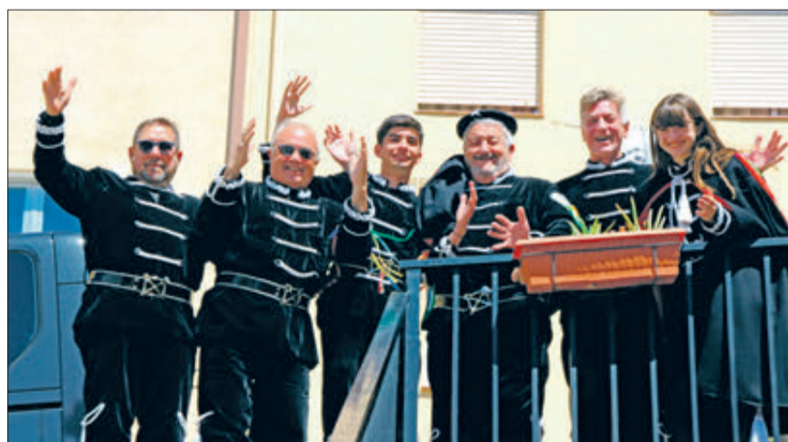
Estudiants saludant al personal.