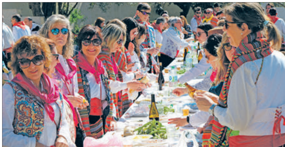
Festeres dels Maseros durant l'esmorzar en el Sant Crist.