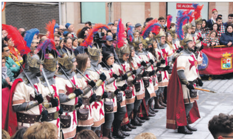
Els Jordians, segons en la Diana.

AMB PREMIS PER A MOROS VELLS, JORDIANS I MARROCS