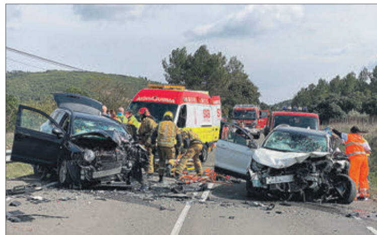
Els cotxes van impactar frontalment.

■ Els vents van ser normals. Les ràfegues més fortes van arribar a 74 km/h.