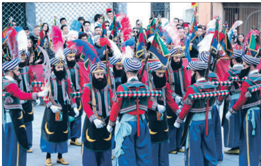
L'oficial dels Moros Vells va guanyar el primer premi.