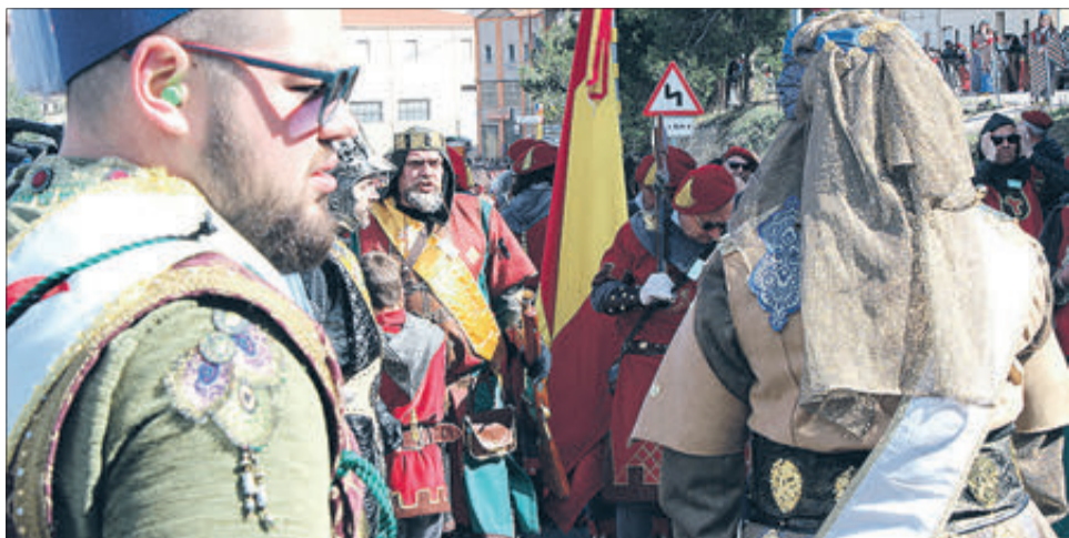
Parlament entre capitans que desencadena la lluita.