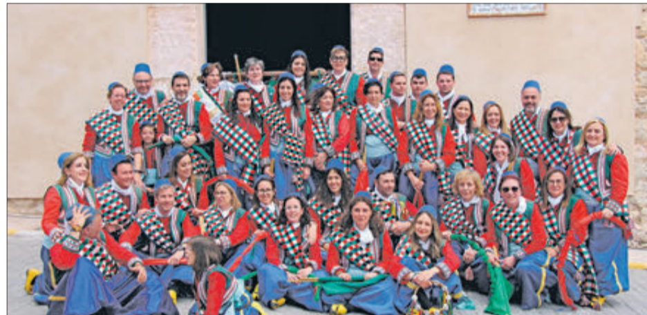
Components del "Ball Moro".