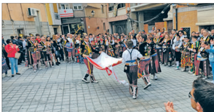
Contrabandistes ballant la bandera.