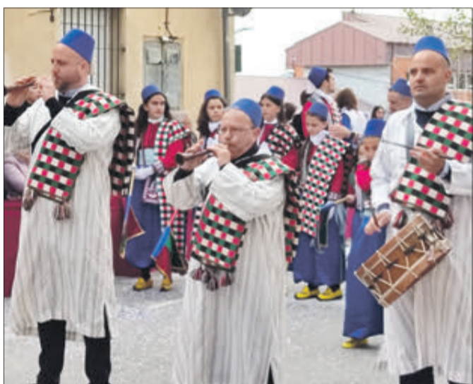
Xirimiters dels Moros Vells.