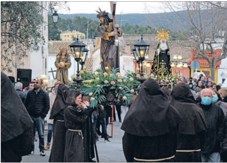
Inici del Via Crucis.