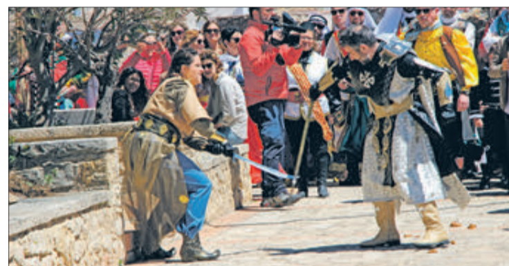
Moment de la lluita amb gran realisme.