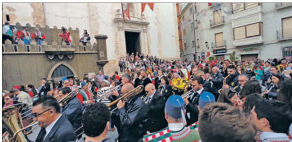
Aspecte que presentava la plaça després del Ball de Banderes.