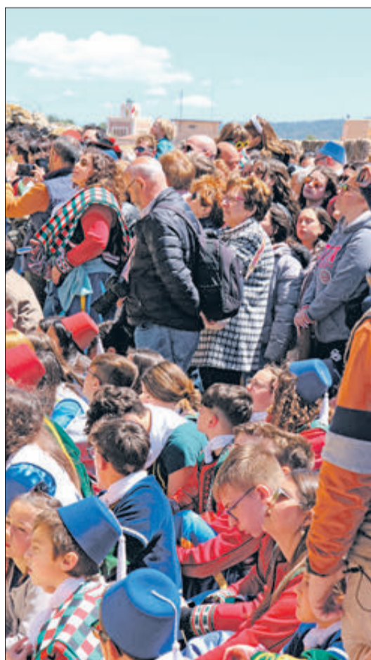
Castell replet de públic per a presenciar les ambaixades.