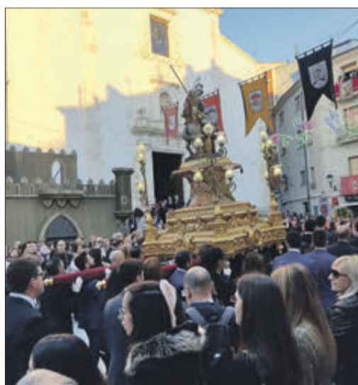
Trasllat de Sant Jordi.