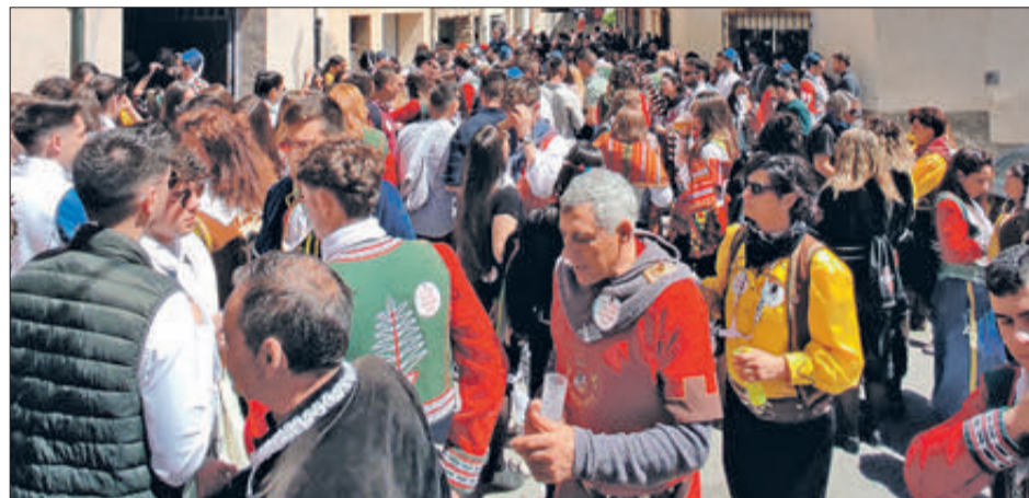
L'itinerari està poblat de punts de reunió.