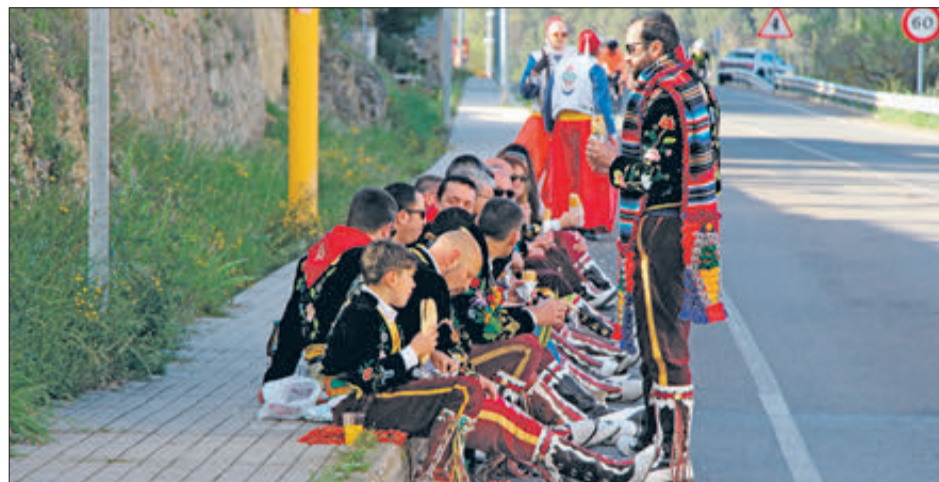
Grup de festers durant l'esmorzar.