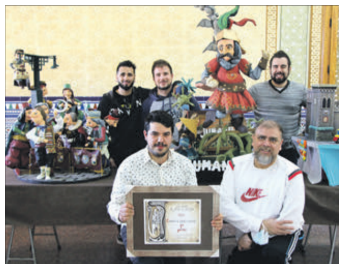
Fanal dels Cristians, guanyador del primer premi.