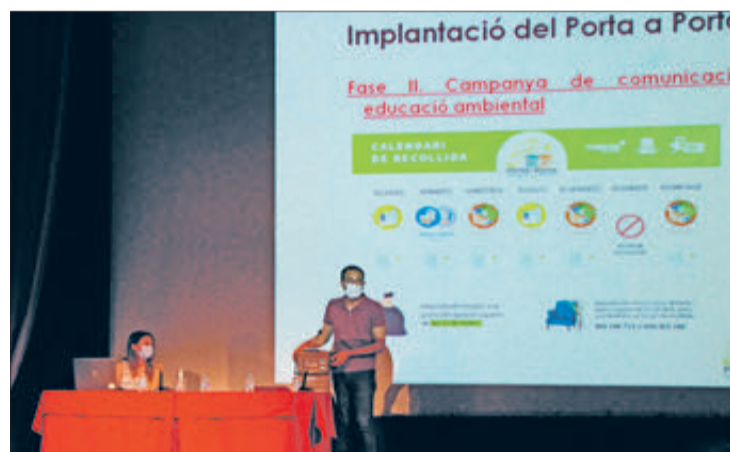
Una de les assemblees de barri en les que es va explicar el "porta a porta"

El Ple Municipal ha acordat aprovar el "Pla local de gestió de residus domèstics i assimilables" amb caràcter inicial i sotmetre-lo a informació pública. Els grups municipals de Compromís i PSOE van votar a favor mentre que el PP es va abstenir. El portaveu popular va aprofitar l'ocasió per a recordar la seua posició sobre el sistema de recollida de fem "porta a porta" i va insistir a dir que hi havia altres opcions, com la del cinquè contenidor, criticant a l'alcalde per no haver optat per aquesta solució. L'alcalde va contestar que l'elegida era l'opció tècnica i efectiva més adequada per a un municipi com Banyeres i va recordar els arguments repetits en reiterades ocasions sobre els avantatges d'usar aquest sistema.