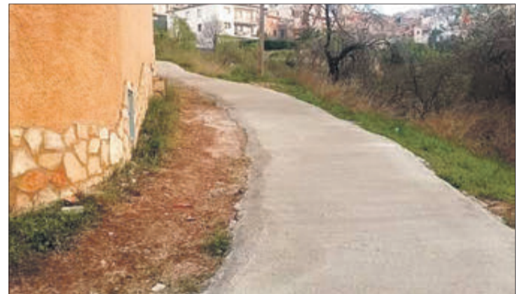
La senda ha sigut pavimentada.

Els grups de Compromís i PSOE van votar a favor mentre que el PP va votar en contra, argumentant que Banyeres no tenia res a veure amb la Ribera Alta i que pertanyia a la mancomunitat de l'Alcoià-Comtat. L'alcalde va explicar que aquesta era una qüestió que res tenia a veure i que la Ribera Alta únicament havia oferit els seus mitjans per a poder desenvolupar la gestió administrativa, la qual cosa alliberava la resta de pobles que s'associaren a haver de fer aquestes funcions. Va recordar, al mateix temps, que en l'associació s'integrarien municipis de tots els signes polítics, inclosos alguns del PP que també utilitzen aquest sistema.