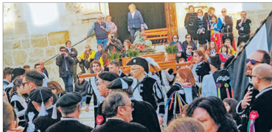
Estudiants en el "Trasllat del Sant Jordiet".