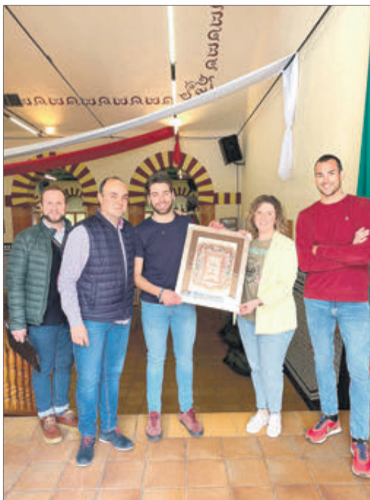
Concurs de carrosses: 1rs moros Vells.