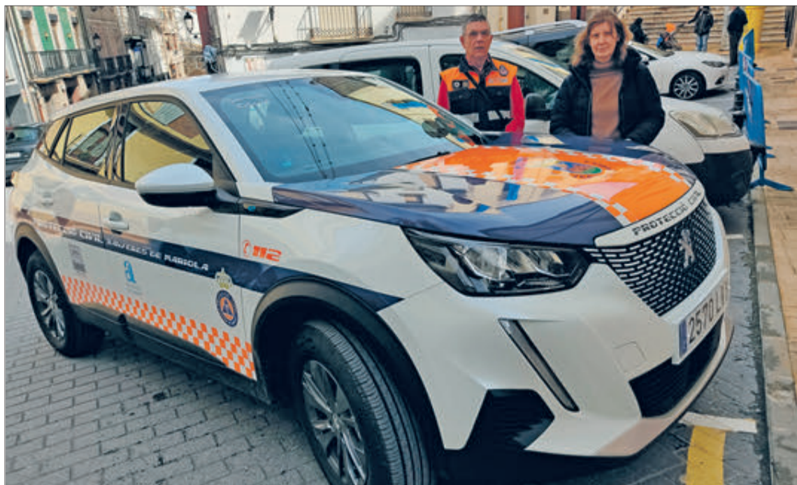
El nou vehicle ja està operatiu.