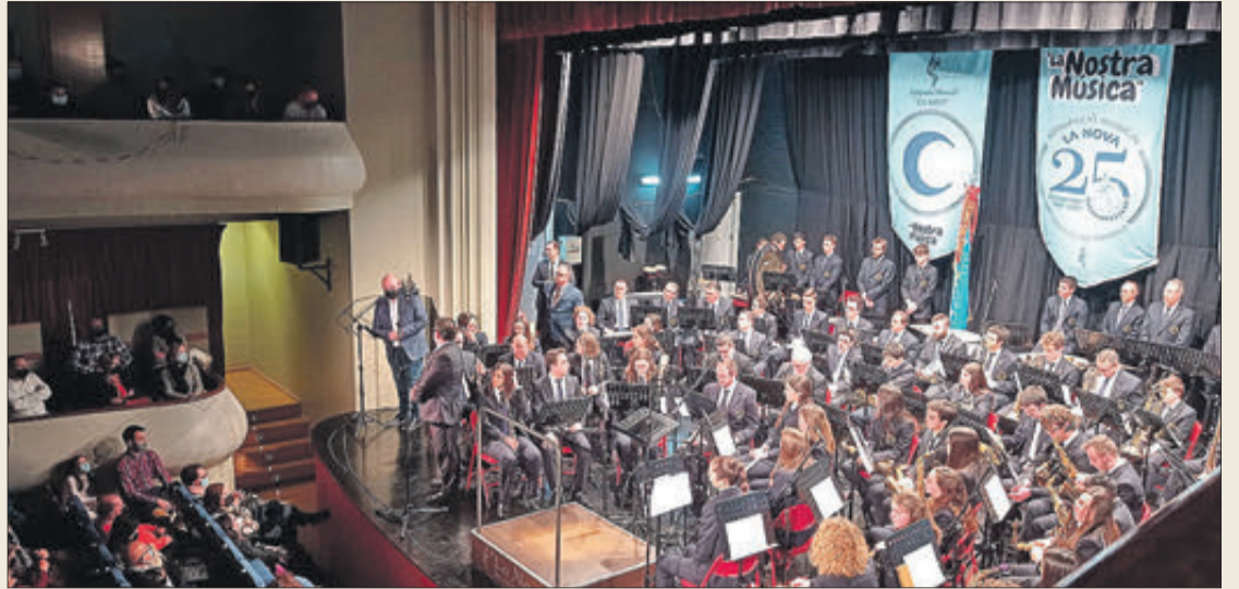
La recaptació va ser entregada a l'Associació d'Alzheimer.