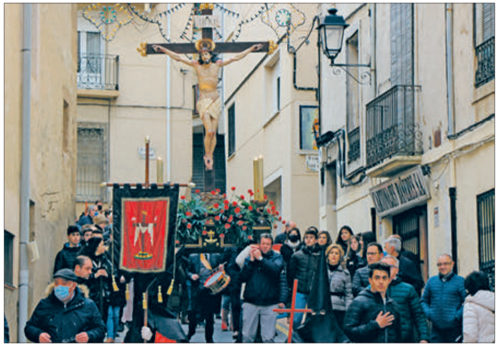
El Crist cap a l'església.