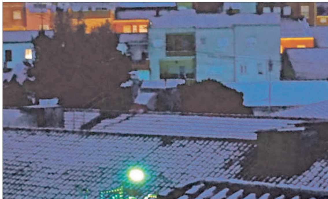
Teulades blanques en l'inici de la temporada.

Es últims vestigis del temporal de pluja que es va estendre durant bona part del mes de març i que es va prolongar durant els primers dies d'abril, juntament amb una imprevista baixada de les temperatures, es va traduir el 6 d'abril en una inesperada