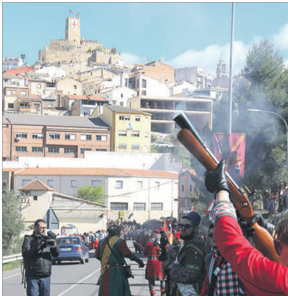
La guerrilla pretén la conquesta del Castell.