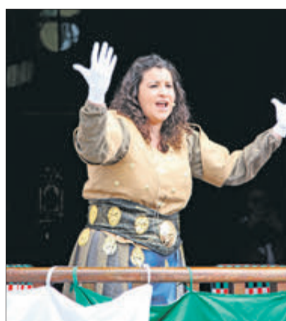
Escenificació del "Despojo" per M. Jesús Gisbert.