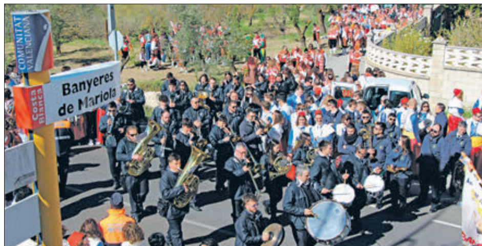
L'ambient en l'entrada del poble era indescriptible.