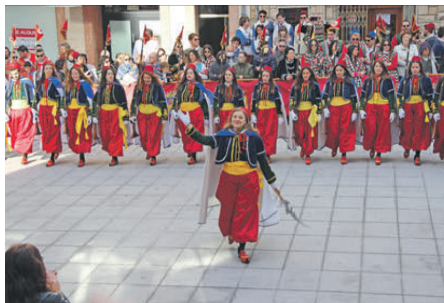
Esquadra de Marrocs, tercer premi en la Diana.

Com cada nit, la festa es va traslladar a última hora fins a la carpa instal·lada al parc Vil·la Rosario, prolongant-se fins a l'alba.