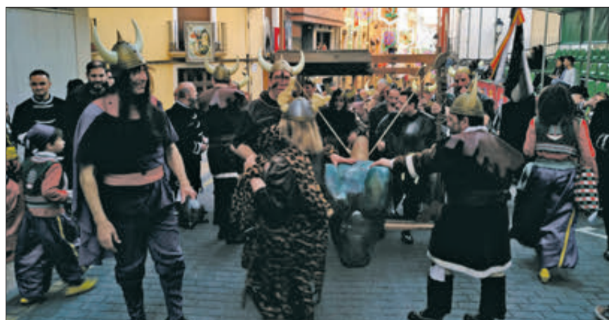
Ambaixada humorística dels Moros Nous i els Estudiants.