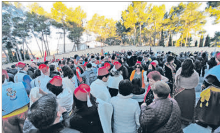
Aspecte que presentava "el Morer", replet de gent.

Va ser en el Morer on es van alçar els primers capitans i on la festa es replantejava, plena d'il·lusió, amb vista a l'edició del 2023. Des d'aquest punt els festers van disparar l'arcabuseria fins a passar per l'ermita de Sant Jordi, on van fer sonar els arcabussos amb salves d'honor, tornant-ho a fer en els dos recintes del Cementeri, en un acte que és "únic" en l'àmbit dels pobles que celebren festes de moros i cristians.