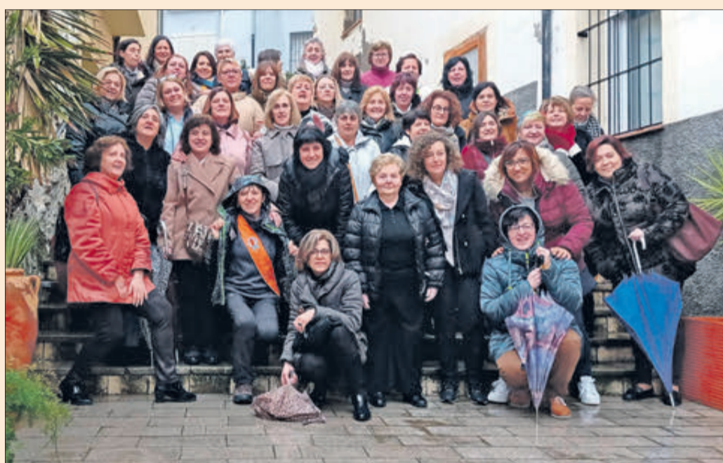
Exalumnes de brodat amb la protagonista.

nevada que va deixar neu en teulades, vehicles i les muntanyes que envolten Banyeres, com la Penya la Blasca, l'Alt de la Barcella i el Capollet de l'Àguila. Va ser un "anòmal" inici de la primavera amb temperatures gèlides que no es recordava des de feia temps.