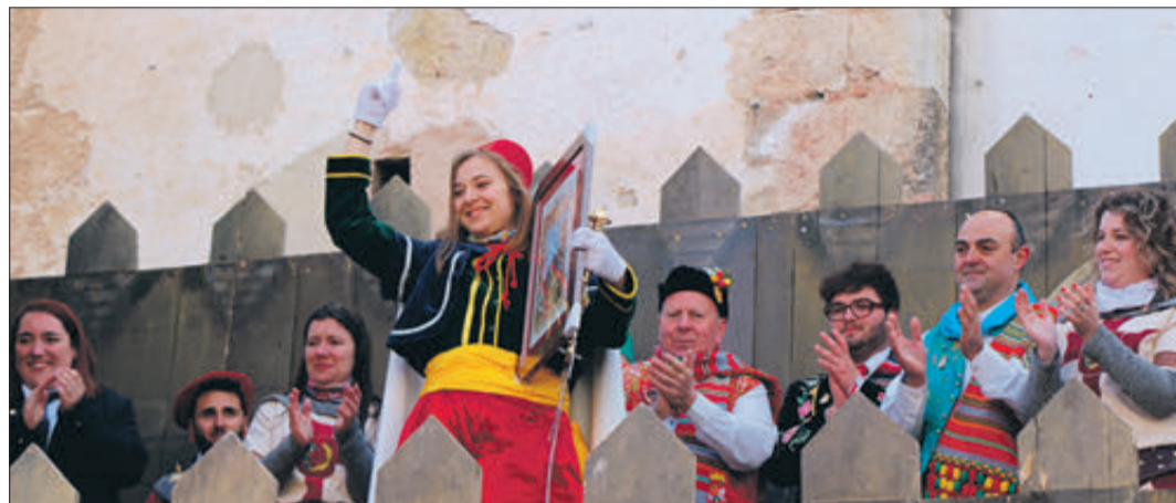
Cap de l'esquadra Marrocs rebent el premi.