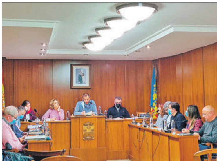
Celebració del Ple de Pressupostos.

El portaveu del PSOE va expressar la seua queixa per l'escàs temps disponible per a poder estudiar l'esborrany. De