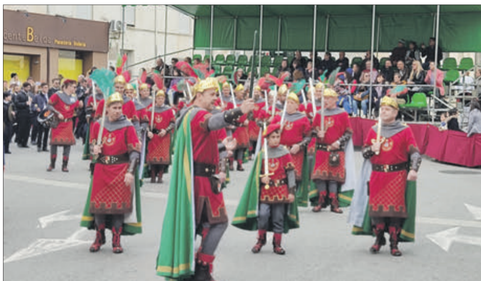
Cristians obrint la desfilada.