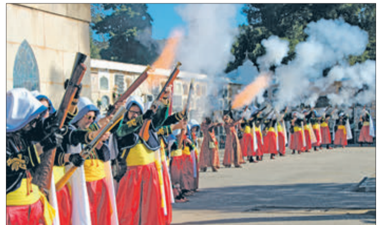
Marrocs fent sonar els arcabussos en el camp sant.