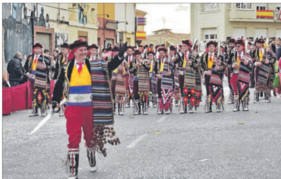
Esquadra de Contrabandistes.