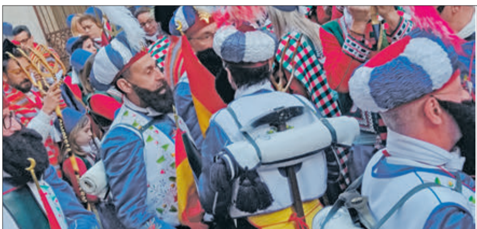
El lateral de l'església replet de festers.