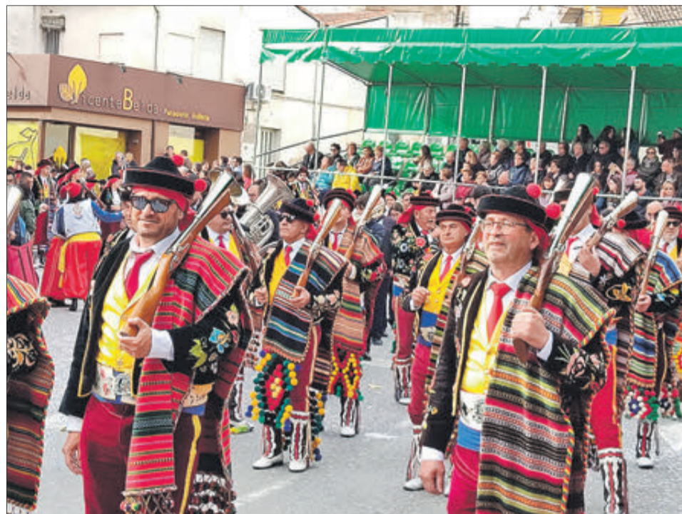
Piquet de Contrabandistes.

AL VOLTANT DE QUATRE MIL PERSONES ES CALCULA QUE VAN PARTICIPAR EN LA DESFILADA L'ENTRADA