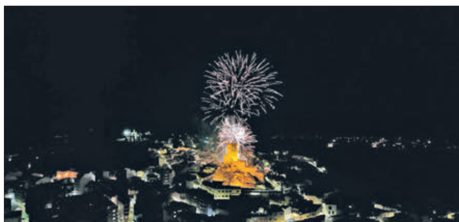
Espectacular imatge del castell de focs artificials.