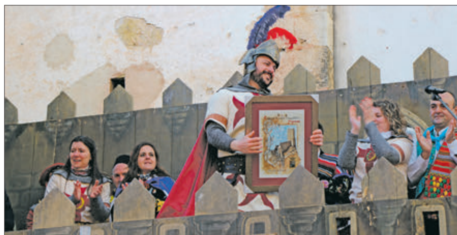
Cap de l'esquadra Jordians en rebre el guardó.