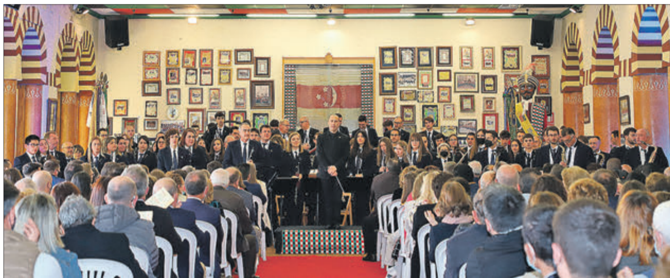
La Societat Musical Banyeres de Mariola en el maset dels Moros Vells.