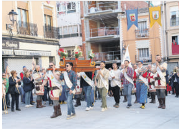
Jordians: Un grup d'amics format per músics i festers.