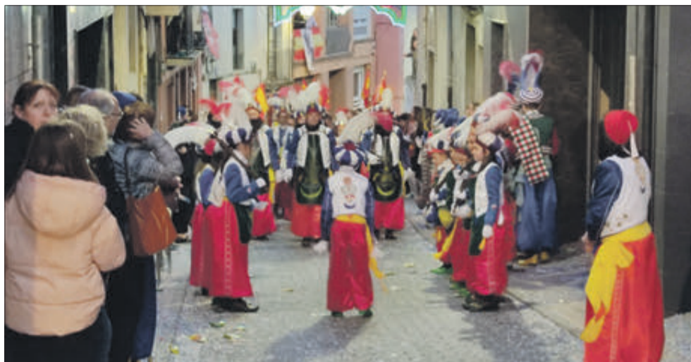
Moros Nous en l'Entrada.