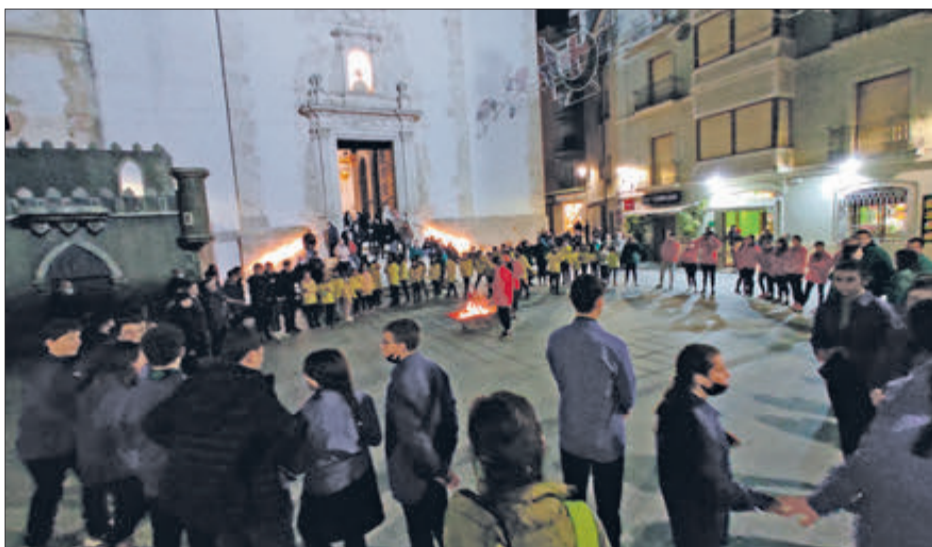
Concentració entorn del Foc.