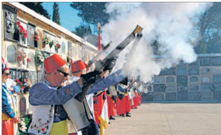
Salves d'honor en el Cementeri.