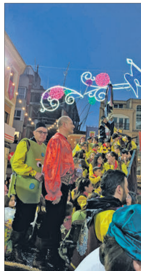
Ambaixada humorística de la filà Pirates.