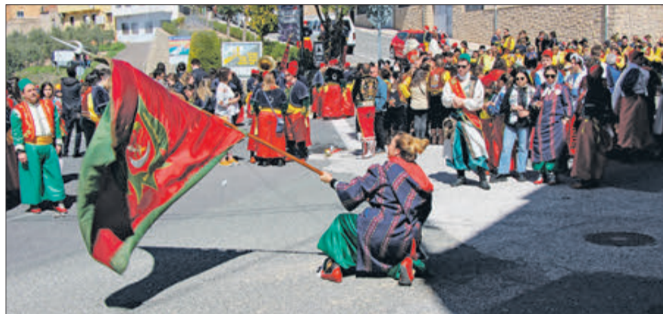
Festera ballant la bandera.