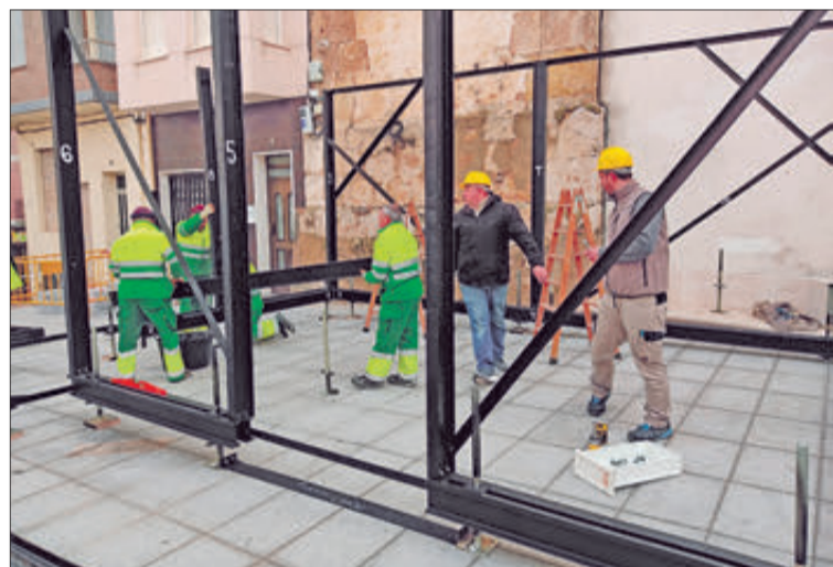
Operaris en el muntatge del castell en la plaça Major.