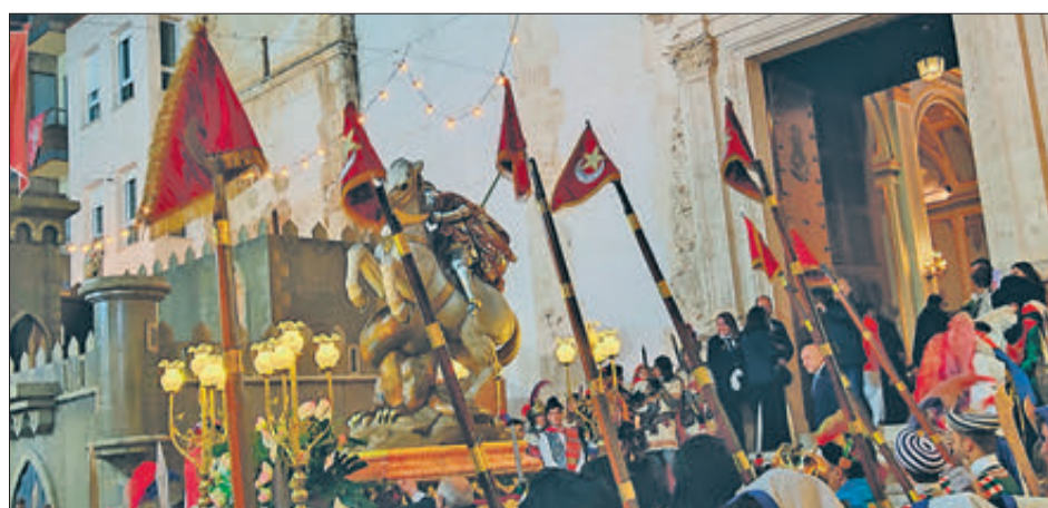
Sant Jordi accedint a l'església.