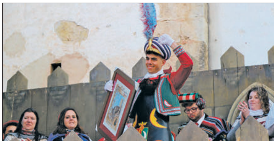
Cap de l'esquadra Moros Vells, primer premi.