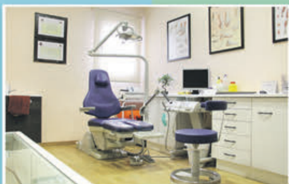
Cites de podologia Tf 660335448

La regidoria de Neteja i Residus Urbans ha remès una felicitació a les comparses i festers "per l'òptima" separació de residus realitzada durant les festes de Sant Jordi. En la circular fa especial menció als Moros Nous, seguit dels Moros Vells, per "l'excel·lent" separació i posterior lliurament. Afegint en la nota que la resta de filaes ha fet una bona feina i que només dues hauran de millorar considerablement. Des de la regidoria es dóna l'enhorabona a totes les filaes i li anima a continuar fent-ho igual o millor en pròximes celebracions.