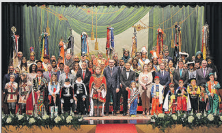
Capitans, bandereres i autoritats en l'escenari.

AMB LA COL·LABORACIÓ DE LA CONSELLERIA D'EDUCACIÓ, INVESTIGACIÓ, CULTURA I ESPORT DE LA GENERALITAT SEMPRE TEUA La teua llengua