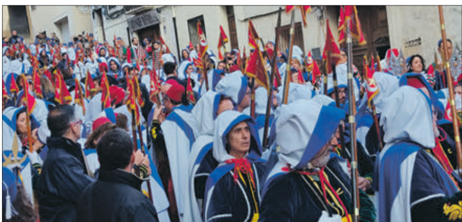
Festers preparant-se per a l'inici de la processó.