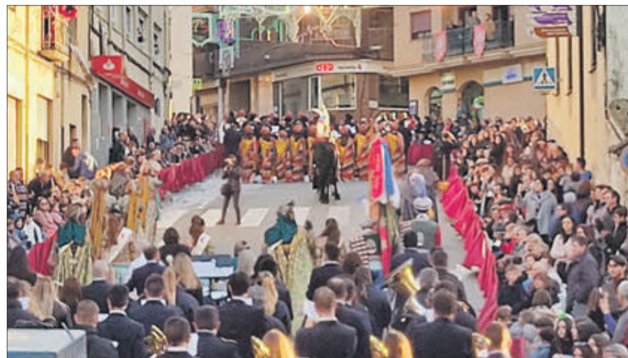
Aspecte de l'avinguda dels Furs.