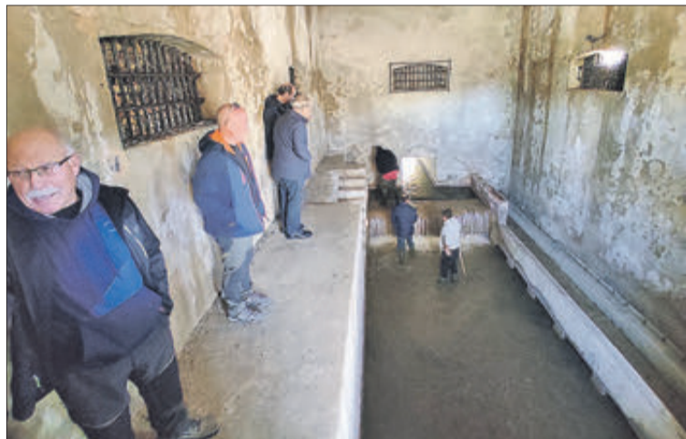
L'interior del Partidor durant la revisió a la instal·lació.

Els Sindicats del Reg Major de Banyeres, Bocairent i Beneixama van realitzar la tradicional obertura de la porta de tres claus del Partidor de les Aigües per a comprovar l'estat d'aquesta instal·lació hidràulica i reunir-se, més tard, en la celebració d'un dinar en la Venta el Borrego. Aquest ancestral costum sol tindre lloc l'últim dissabte de cada mes de març, encara que pot designar-se una altra data si fera falta. En aquesta ocasió va ser posposada al dissabte següent pel temporal de pluges que s'anunciava i que al final es va confirmar.