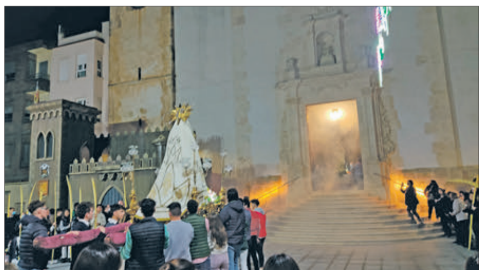
Processó de l'Encontre.

LA PROCESSÓ DEL SILENCI ES VA VEURE AFECTADA PER LA PLUJA, PER LA QUAL COSA ES VA HAVER DE FER EN L'ESGLÉSIA