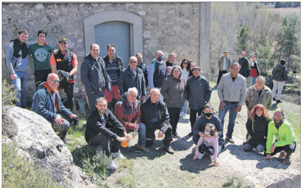
Autoritats i regants van assistir a la cita.