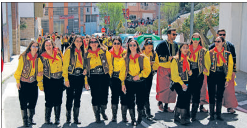
Quadrilla de Pirates.