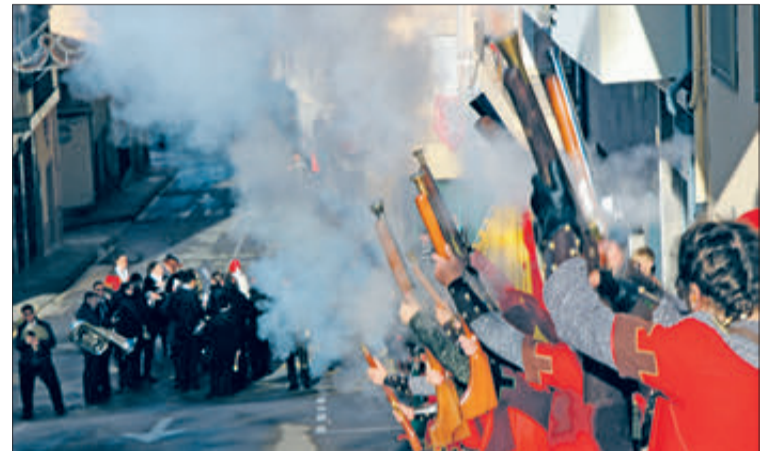
Cristians disparant davant l'ermita de Sant Jordi.