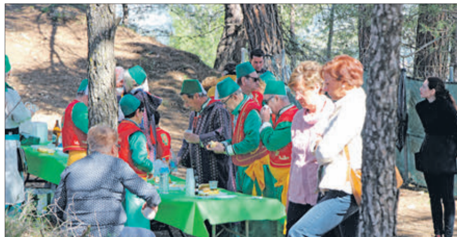
Califes davant la taula.