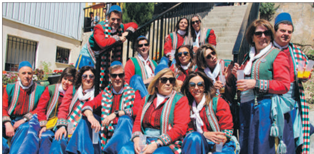
Moros davant la "Cova de Gadafi".