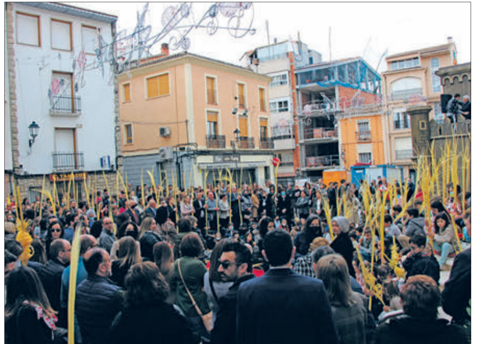
Missa del Diumenge de Rams.