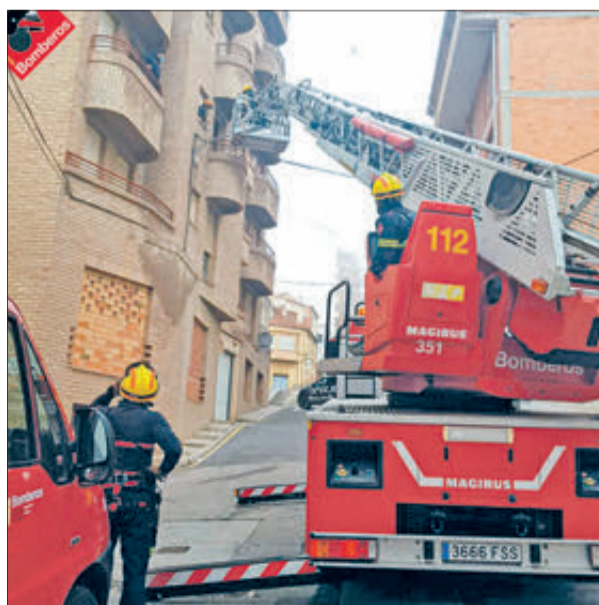
L'autoescala va permetre accedir al lloc on estava el xiquet.

Una dotació del Servei de Bombers es va desplaçar el dia 11 d'abril al poble per a alliberar un xiquet de 3 anys que s'havia quedat tancat a la seua habitació. El succés es va produir en el domicili familiar, situat en el número 10 del carrer Beneixama. Segons es va informar, la porta va quedar bloquejada sense que poguera obrir-se, tant des de dins com des de fora, el que va motivar una situació d'angoixa que va provocar que es cridara al 112 d'Emergències. Els Bombers van desplaçar un vehicle "autoescala" que els va permetre pujar al balcó i rescatar al menor. L'acció es va produir des del carrer Àngel Torró, des del que podia accedir-se directament al punt on estava el xiquet.