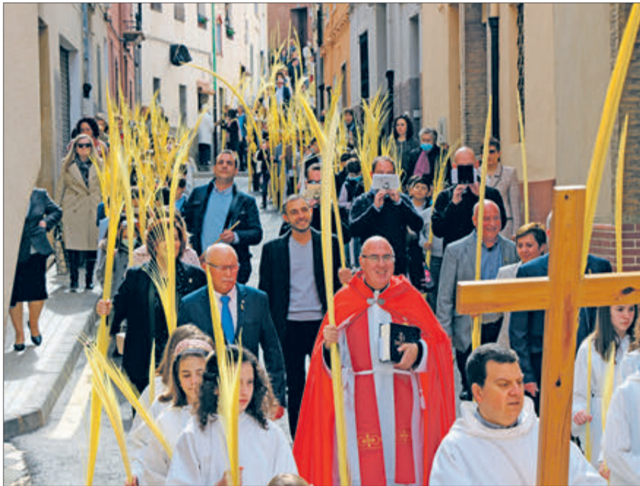
Processó de Rams i Palmes.