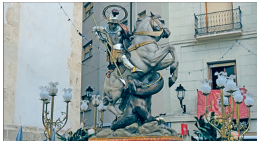
Imatge de Sant Jordi disposada per a l'inici de la processó.