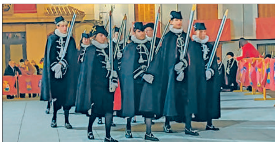
Estudiants en el final de la processó.