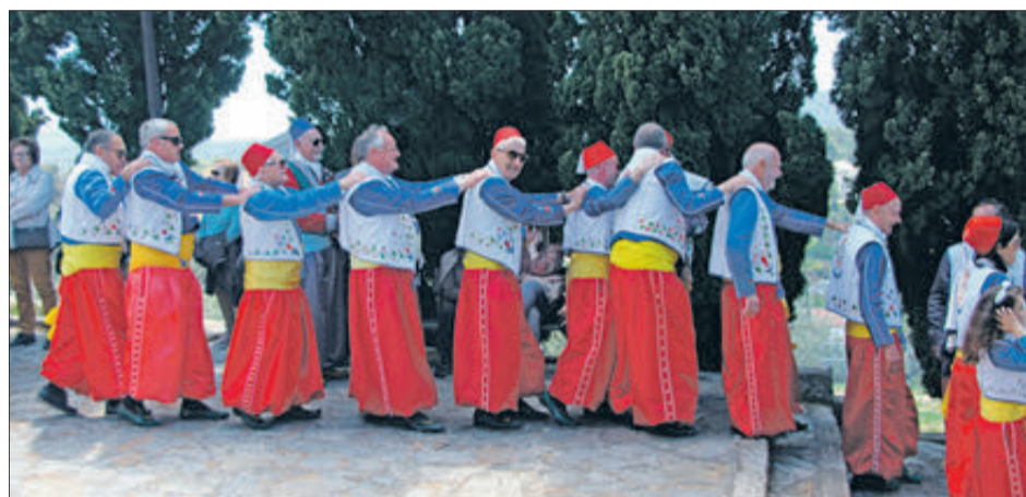
Moros Nous iniciant el camí per a baixar del Sant Crist.