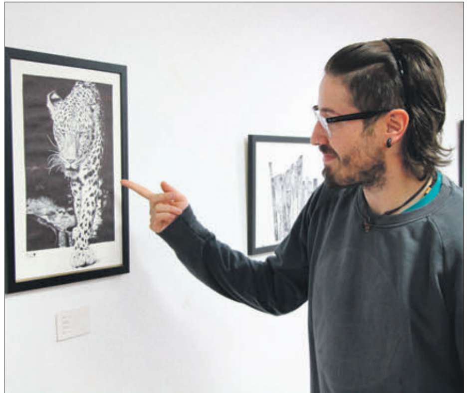
Treballs hiperrealistes amb elements d'extrema realitat i exactitud.