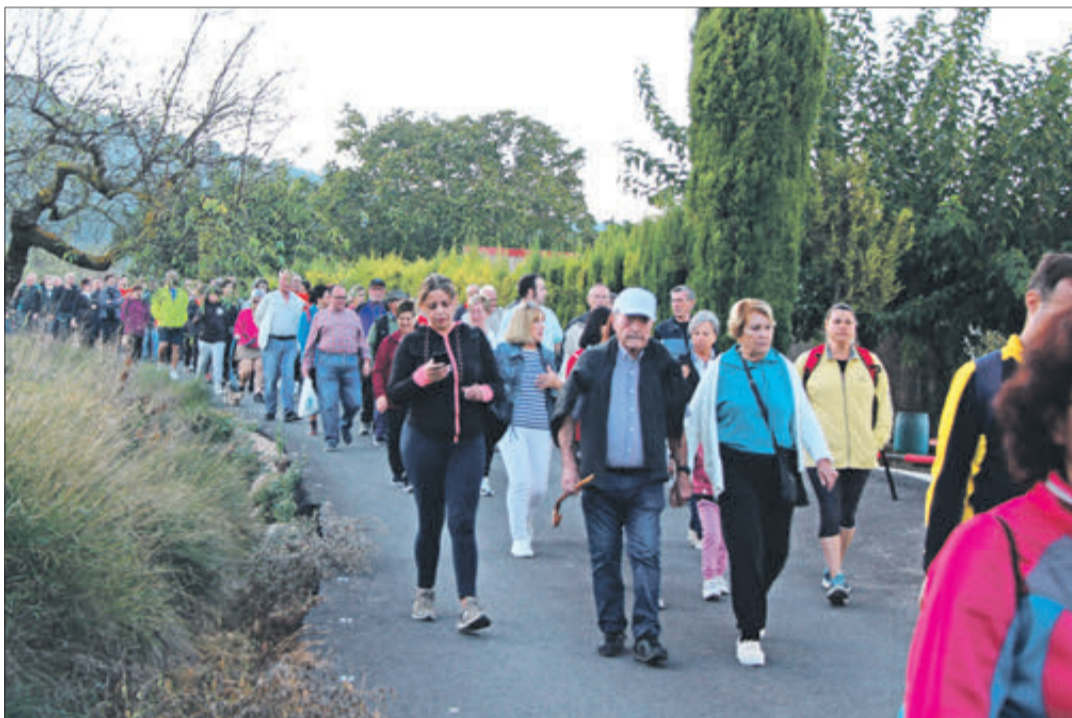
Un moment de l'excursió del 9 d'Octubre.

Va incloure una ruta de nul·la dificultat i apta per a tots els públics de poc més de 6 km. L'itinerari va transcórrer a través de diferents paratges: després d'eixir del nucli urbà pel camí que transita per davall de la Font del Cavaller en direcció a l'ermita de Sant Antoni, el grup es va desviar a l'esquerra per un camí recentment pavimentat fins a arribar a la zona del Masanet i seguir l'itinerari de la via verda per on circulava l'antic ferrocarril "Xitxarra". Des d'allí, superat el punt de primers auxilis de Creu Roja, es va desviar novament a l'esquerra per a seguir l'itinerari que portaria, després de travessar la carretera Banyeres-Biar, fins al camí que accedix directament al paratge natural del Molí l'Ombria, on es va oferir el tradicional esmorzar de coques.