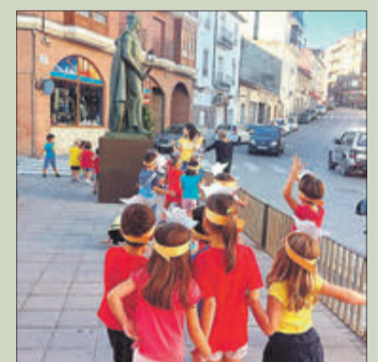
Xiquets i xiquetes davant el monument de Jaume I.