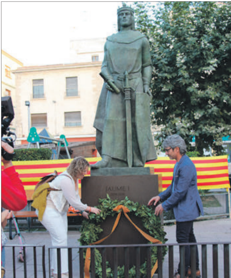
Col·locació de la corona de llorer en el monument de Jaume I