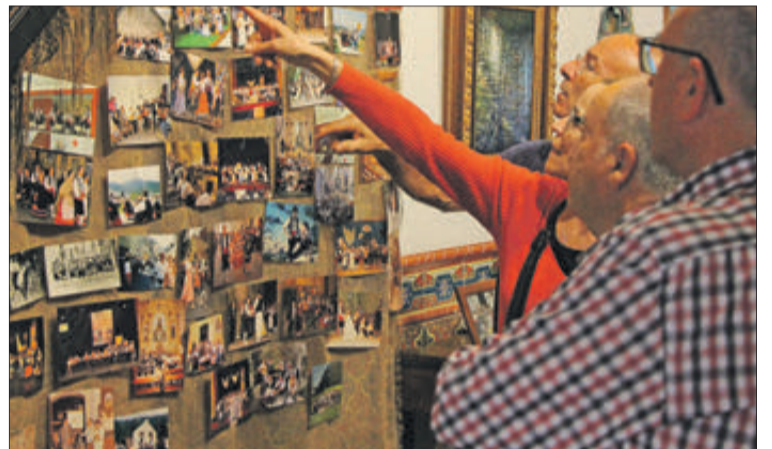
Exposició organitzada en la Fundació Valor.