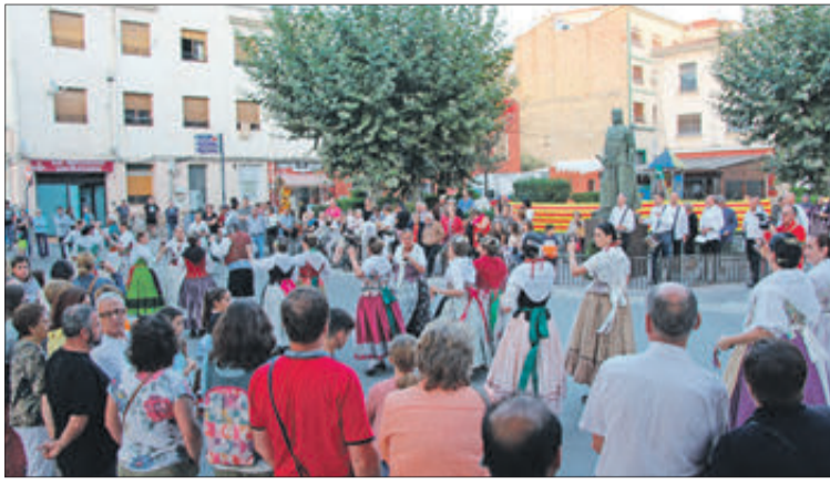
Ball de la "Dansà" davant el monument al rei Jaume I.