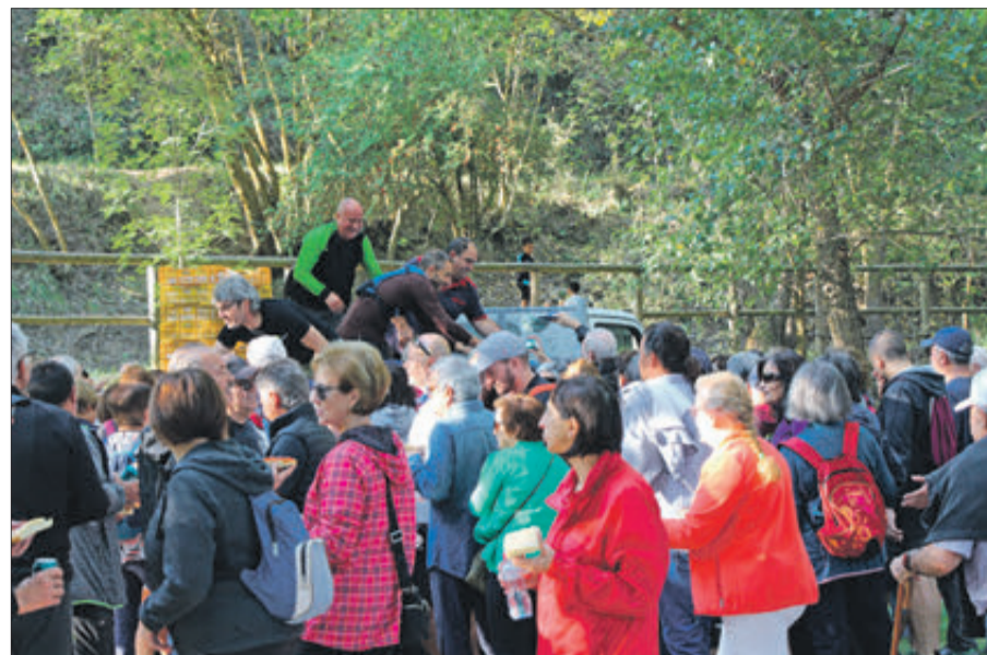
Els assistents van degustar un esmorzar de coques.