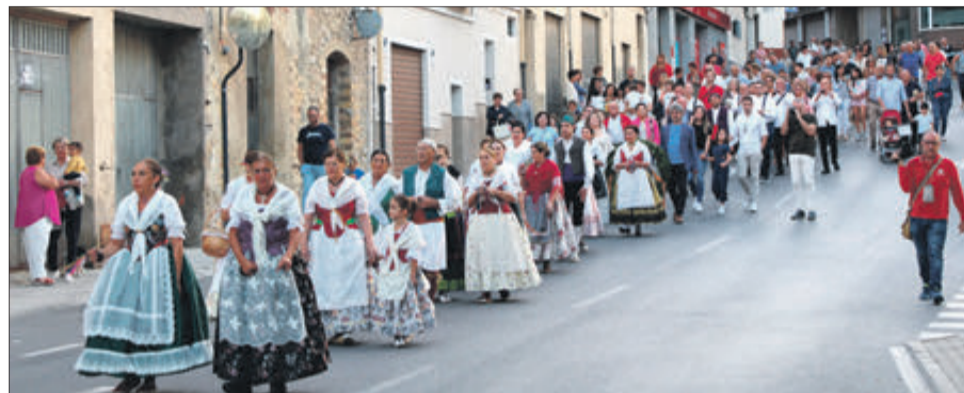
Integrants del Taller de Danses autoritats i públic durant la cercavila.