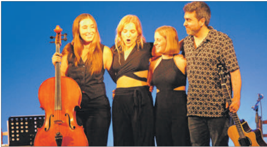
Els quatre intèrprets al final del concert.