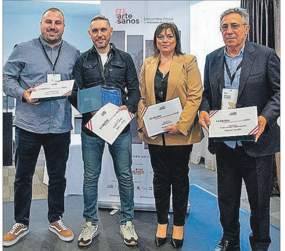
Va rebre el premi a la Innovació en el I Encontre d'Artesans de la Carn.

carnisser" davant la societat i donar visibilitat a un sector cada vegada més valorat i conegut fora d'Espanya, però no tant en territori nacional, on, no obstant això, hi ha grans professionals que res han d'envidiar als famosos carnisseros francesos o belgues, on l'ofici compta amb un gran prestigi i reconeixement.