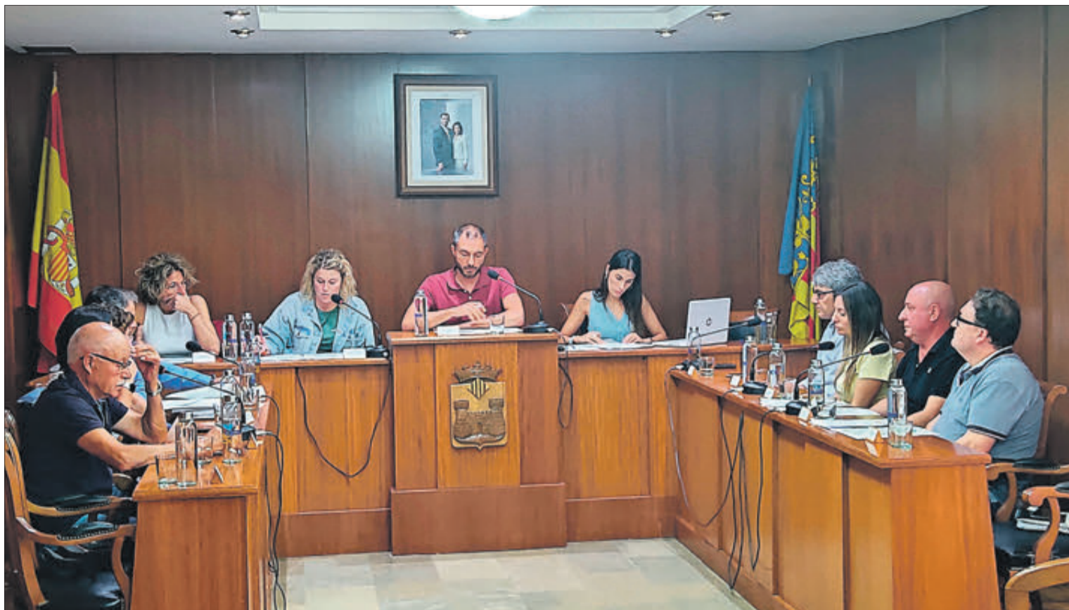
Ple de l'Ajuntament de Banyeres celebrat el 28 de setembre.

TINDRAN LES MATEIXES QUANTIES QUE EN LA PASSADA LEGISLATURA