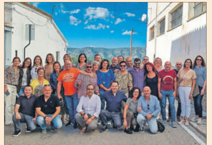
Junta dels Reis Mags que ha acabat.

D'igual manera van assenyalar que ara era el torn dels nascuts en 1973, "als quals desitgem molta sort i que aquesta experiència els resulte tan gratificant com ho ha sigut per a nosaltres. Fins aviat, i que la màgia vos acompanye sempre".