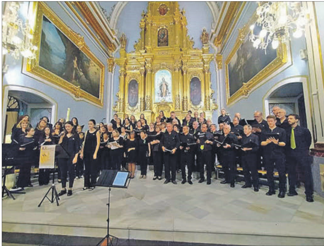
El concert es va oferir a l'església.