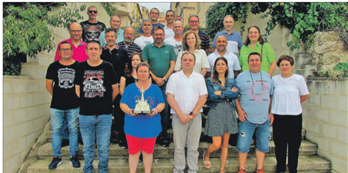
Junta dels Reis Mags 2022/2023 que s'ha acomiadat.

Càritas Parroquial de Banyeres ha tornat a enviar roba d'abrigar als temporers de l'oliva que treballen en la població d'Úbeda, a la província de Jaén. L'acció s'ha dut a terme per novè mes consecutiu i es du a terme enviant el material a la Casa Llar de la Verge Miraculosa, on es dona atenció a les persones que van a treballar en la campanya de l'oliva, procedents de molts punts d'Espanya i del nord d'Àfrica. L'acció és possible gràcies al personal voluntari que presta el seu suport al rober de Càritas i a la bona voluntat de les moltíssimes persones del poble que donen la seua roba a la institució.