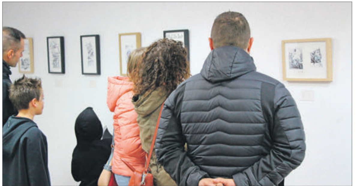
Públic contemplat els dibuixos de la mostra.