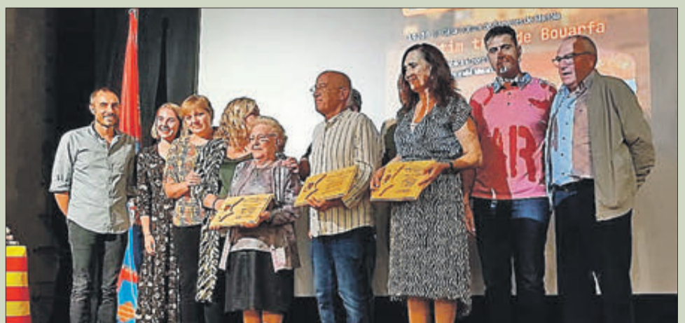
Premiats juntament amb l'alcalde i representants del Col·lectiu Serrella

El lliurament de premis es va fer a la Casa de Cultura i es va complementar amb una conferència sobre l'exili republicà que va pronunciar Antonio Vañó Mataix.