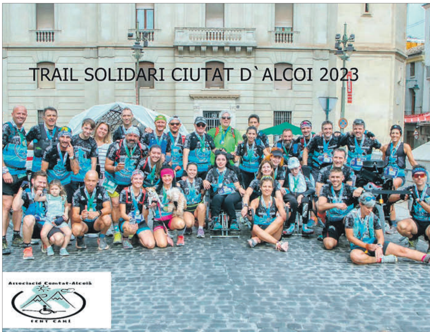
Banyeruts i altres membres de l'Associació Fent Camí que van participar.