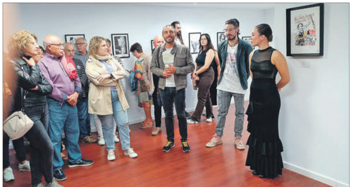
Acte d'inauguració de l'exposició en l'Espai Expositiu del Teatre.