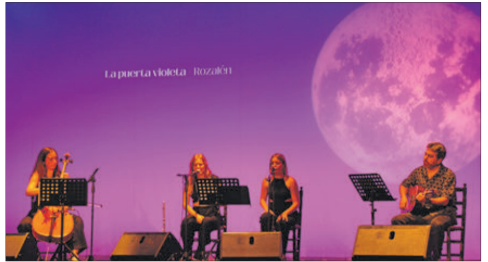
'La puerta violeta' de Rozalén va posar el bis a l'actuació.