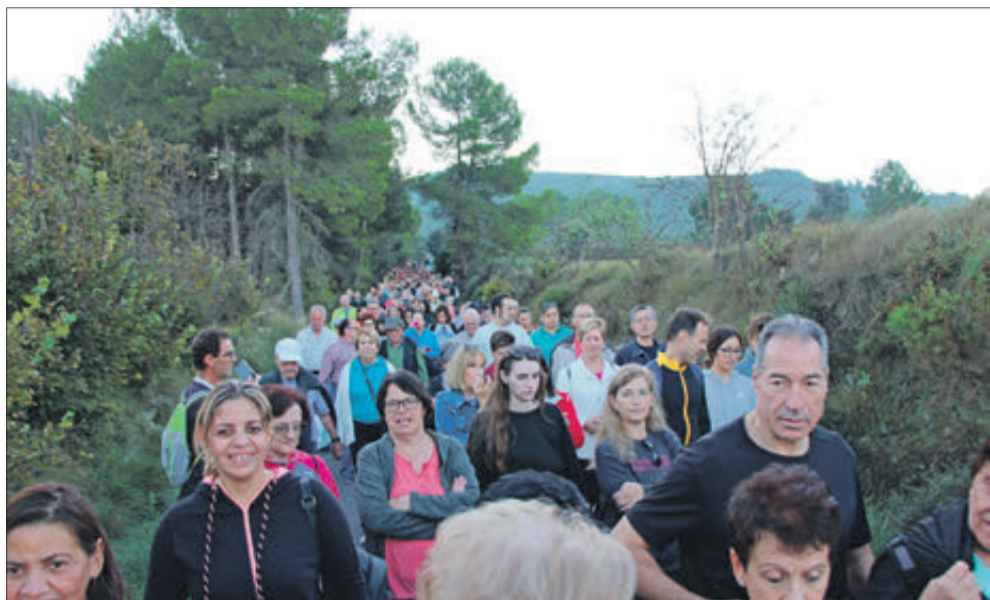
Van participar al voltant de cinc-centes persones.