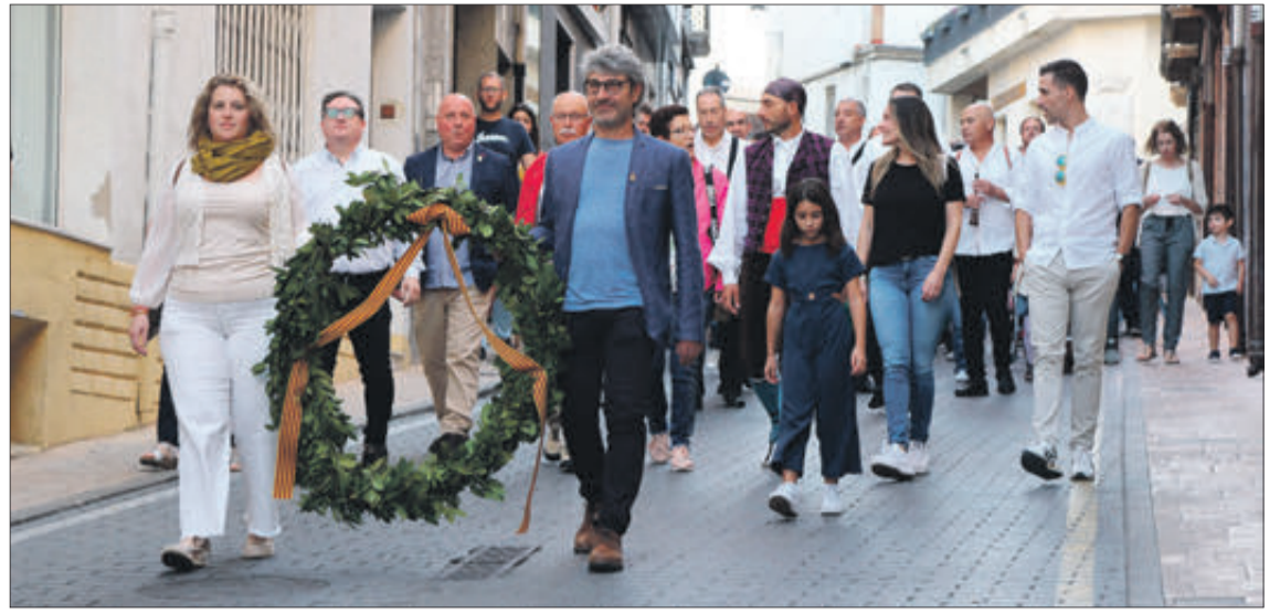
Autoritats portant la corona de llorer.