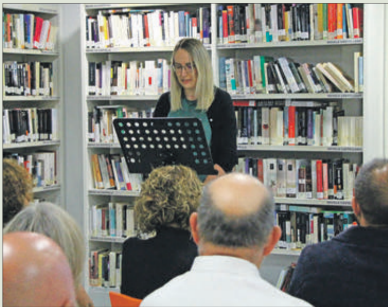
Es van llegir fragments de diferents escriptors.