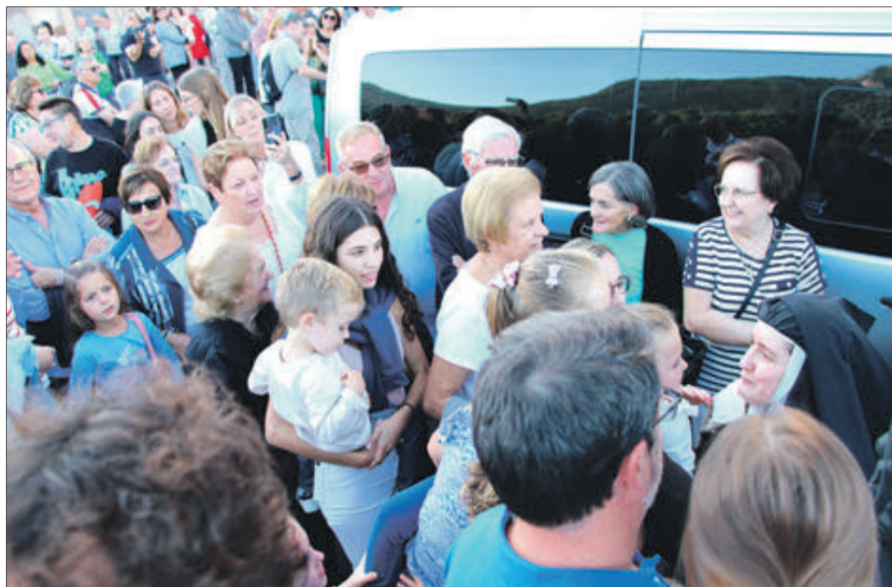
Una de les germanes és natural de Banyeres.