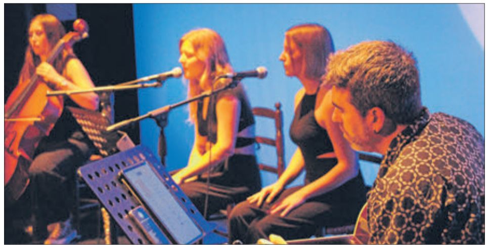
Veu, guitarra i violoncel en un concert acústic.