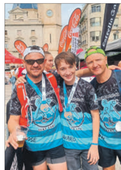
Ajuden a fer que persones amb dependència puguin fer excursions i proves esportives.