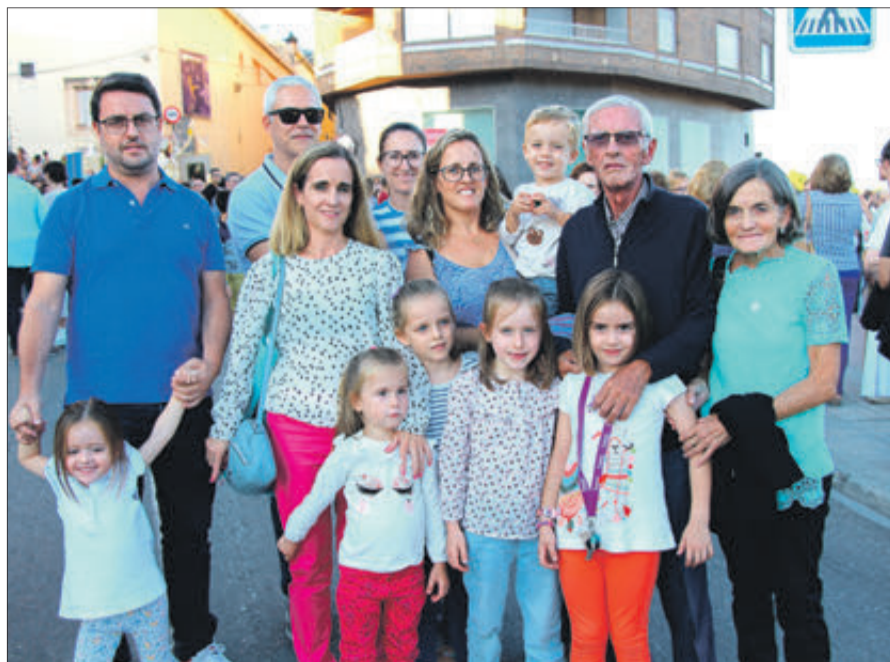
Familiars de la religiosa banyerina.