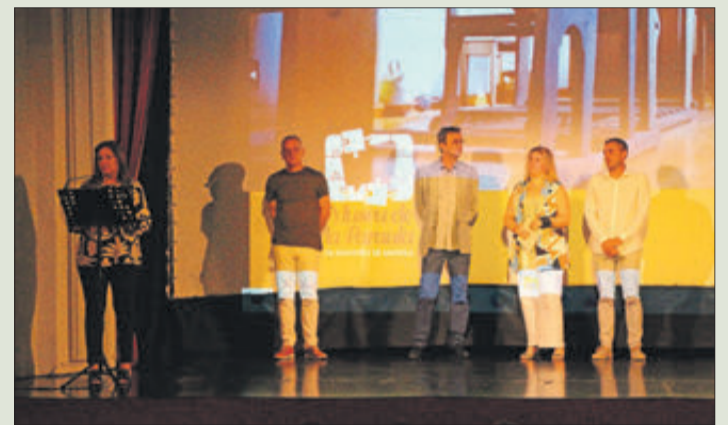
Presentació del documental 'El paper de l'escola'.

"El paper de l'escola" és l'últim documental del Museu de la Paraula que s'ha presentat. L'acte va tindre lloc el 29 de setembre en el Teatre Principal. El treball, dirigit per Josep Miquel Martínez i M. Ángeles Calabuig, amb Joan Josep Torró com a documentalista, fa referència a l'evolució dels col·legis i l'ensenyament en la població a través d'imatges i el testimoni de moltes persones, la major part d'elles en la seua condició d'antics professors o exalumnes, que narren les seues experiències i records relacionats amb el seu pas per l'ensenyament o que van tindre un paper rellevant en la població en el camp de l'educació. La informació inclosa en el documental està referida a l'ensenyament en Banyeres durant el segle XIX i el paper exercit pel Mestre Martínez, l'escola durant la dictadura de Primo de Rivera, les èpoques de la República i del Franquisme i les novetats de la nova Llei d'Educació introduïdes a partir dels anys 70. El treball posa de manifest els canvis produïts en l'educació durant tot aquest temps. El document pot veure's en el canal de YouTube de Museus de Banyeres de Mariola.