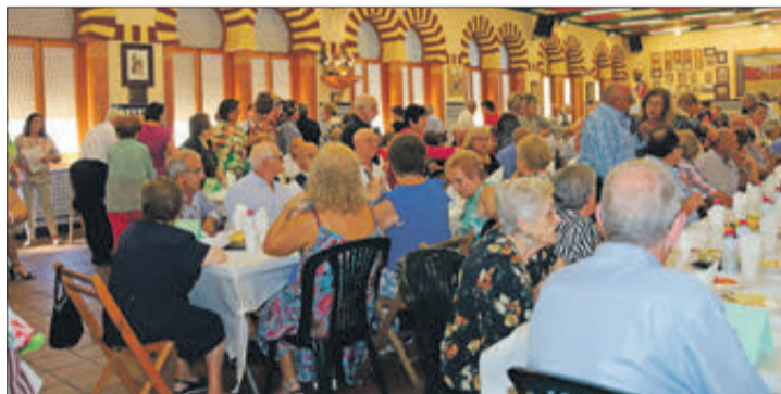
El dinar es va fer en el maset de la filà Moros Vells.