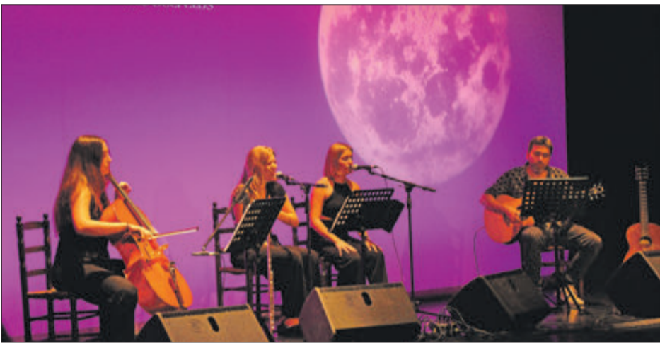
El repertori va incloure temes de diferents estils.