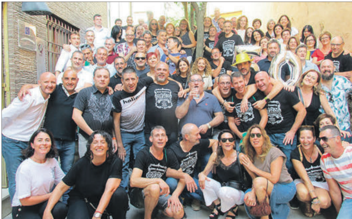
El grup davant les portes del restaurant Piràmide.

Aquesta jornada va ser el punt de partida per a preparar l'arribada dels Reis Mags d'Orient, tasca organitzativa que ha sigut encomanada a aquesta quinta.