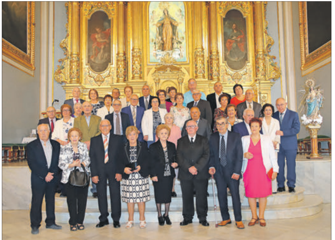
Matrimonis homenatjats pel seu aniversari.