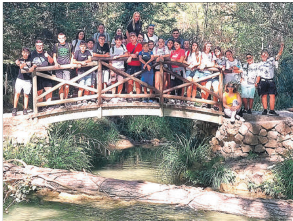
Excursió de la banda jove de Carlet per la Ruta dels Molins.

MODIFICACIONS EN L'ORGANIGRAMA DE LA DIRECCIÓ DE LA BANDA