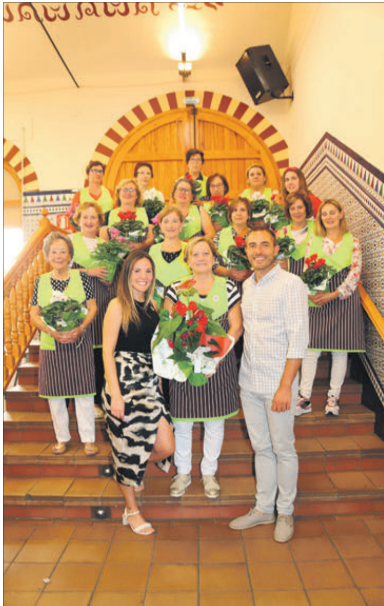
Agraïment a la col·laboració de les Ames de Casa.