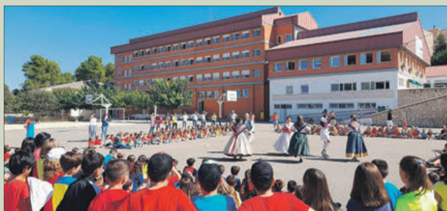
Actuació del Taller de Danses en el col·legi.

El CEIP Alfonso Iniesta es va sumar a les celebracions del 9 d'Octubre, fent activitats el divendres anterior. Eixe dia es va organitzar una visita per a tots els alumnes al monument dedicat a Jaume I, situat en la plaça dels Plàtans, on personal de l'Oficina de Turisme va explicar la història del País Valencià. A continuació els alumnes van interpretar la cançó del Rei Jaume. Seguidament, ja al col·legi, el Taller de Danses del Casal va oferir una actuació de balls populars.