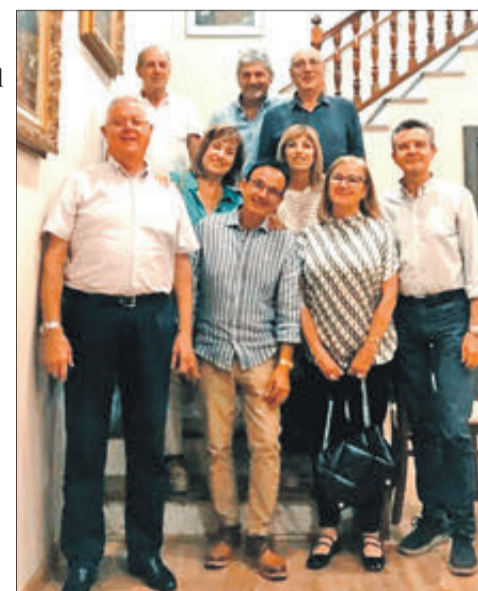
El grup es va reunir en la Venta el Borrego

Un grup d'antics treballadors i treballadores de la fàbrica "Viuda d'Ismael Albero", una empresa que estava dedicada a la fabricació de fil, que tenia una trentena d'operaris, que estava situada entre els carrers Fray Leonardo i el carrer Laporta i que va tancar les portes fa 37 anys, es va reunir per a fer un dinar de germanor en la Venta el Borrego. La reunió va aprofitar per a recordar l'època en la que tots treballaven en aquesta filatura i que el temps i les circumstàncies han fet que cadascú prenguera camins diferents.