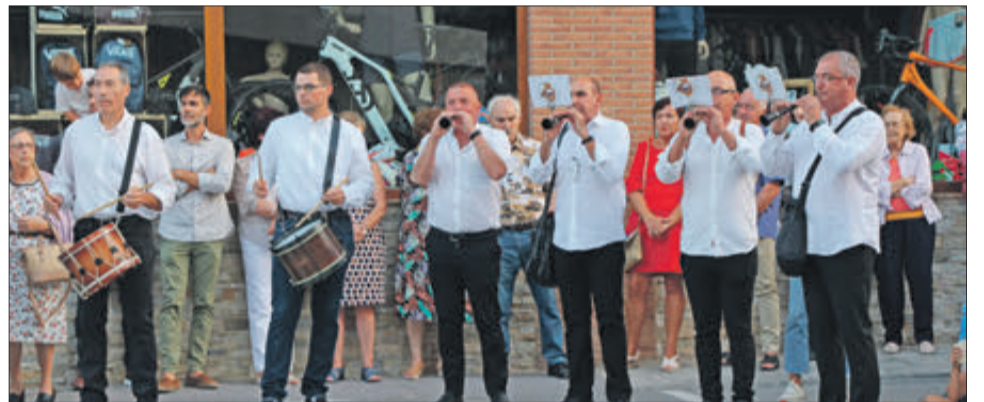
El grup El Braçal durant la interpretació de la Muixeranga.

S'HA COMPLIT UN ANY DE LA INSTAL·LACIÓ EN LA PLAÇA DELS PLÀTANS D'UNA ESTÀTUA DE JAUME I