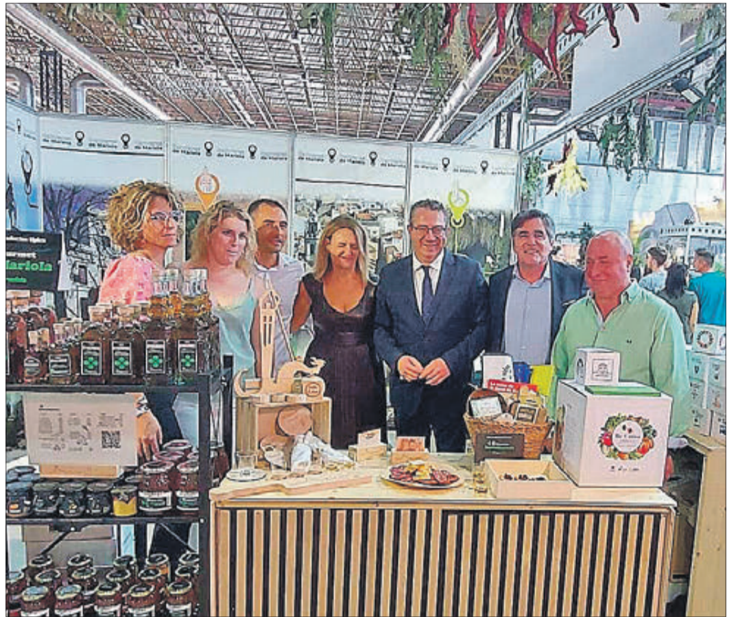
El president de la Diputació en l'estand de Banyeres a IFA.